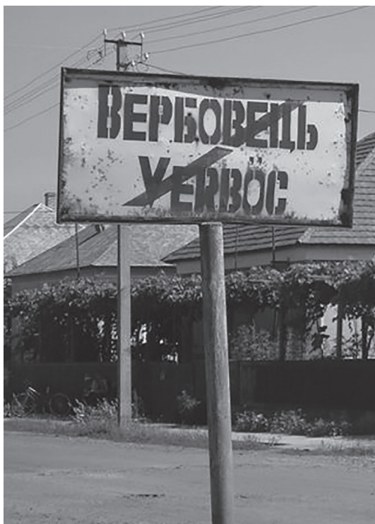
13–14. kép Helységnévtáblák napjainkban 13

Néhány évvel később mindkét község visszakapta magyar nevét (BEREGSZÁSZI 2005), így ma már a Verbőc (13. kép), illetve a Tiszakeresztúr (14. kép) felirat jelenhet meg a falvak határában található helységnévtáblákon és az önkormányzatok épületének homlokzatán.