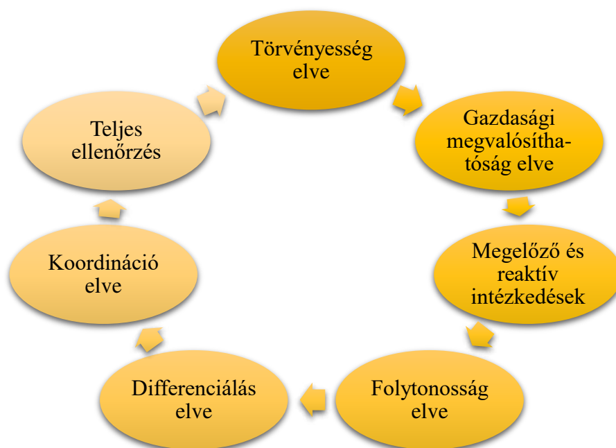
1.5. ábra. A vállalkozás gazdasági biztonságának hatékony kezelésének elvei

A vállalkozás gazdasági biztonságának hatékony kezelése az 1.5. ábrán látható elveken alapul.