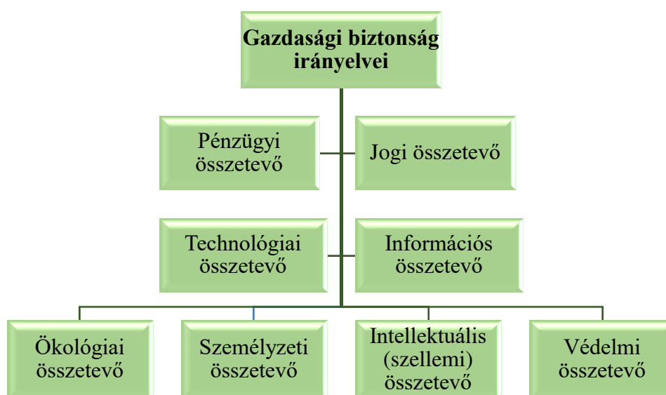
1.3. ábra. A vállalkozás gazdasági biztonságának fő irányelvei

A vállalkozás gazdasági biztonságának fő irányelveit az 1.3. ábra szemlélteti. Összesen 8 elvet különítenek el.