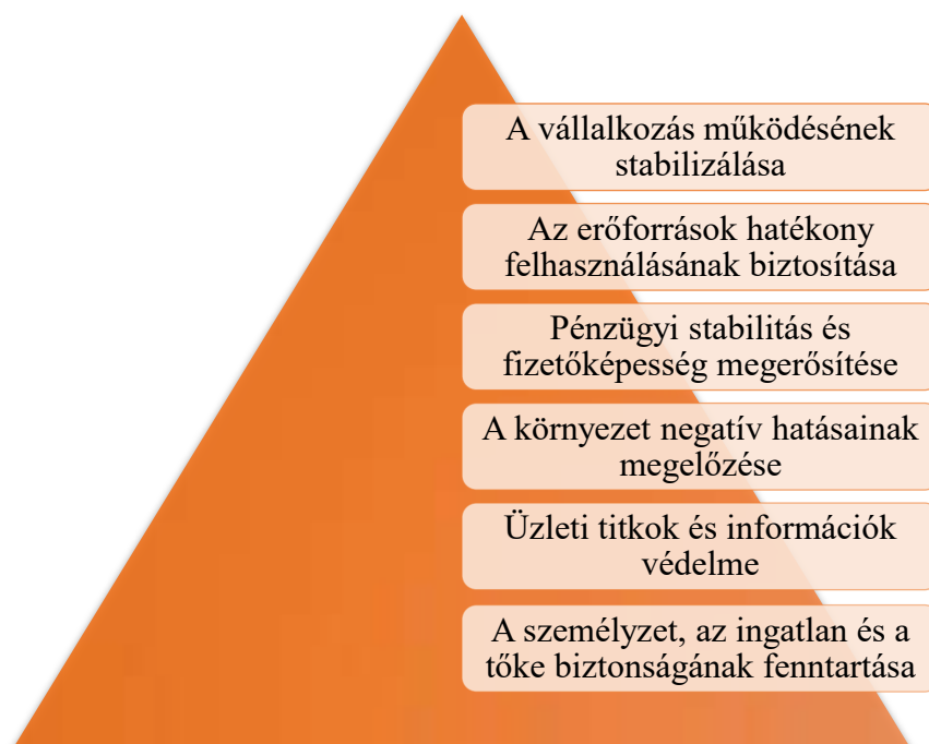
1.2. ábra. A gazdasági biztonság fő feladatai

A gazdasági biztonság fő feladatai a vállalkozás szempontjából az 1.2. ábrán vannak feltüntetve [26, 2. o.].