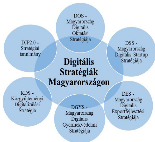
5. ábra. Digitális Stratégiák Magyarországon (2019. május 15.)