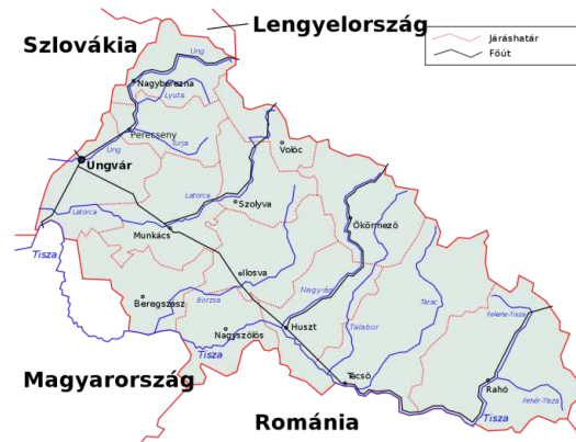
1. ábra. Kárpátalja határai