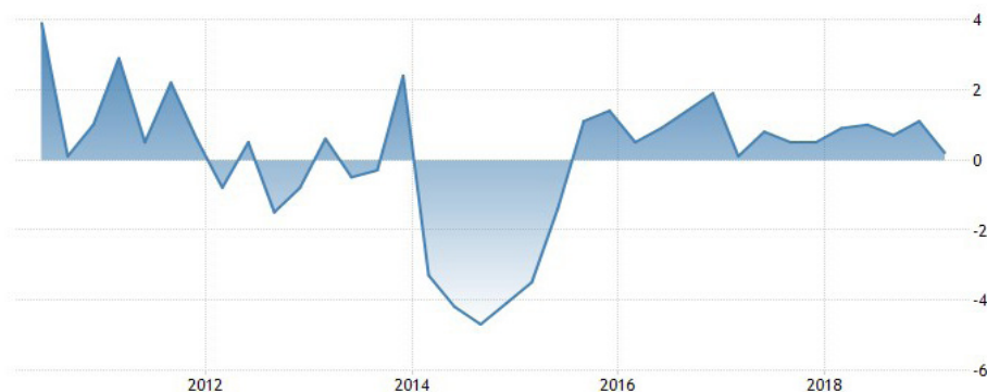
2. ábra. Ukrajna GDP-növekedése 2013–2018 közötti időszakban