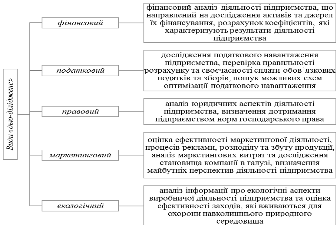
Рисунок 1 – Види «дью-ділідженс»*

*джерело: узагальнено на засадах джерел [2,3]