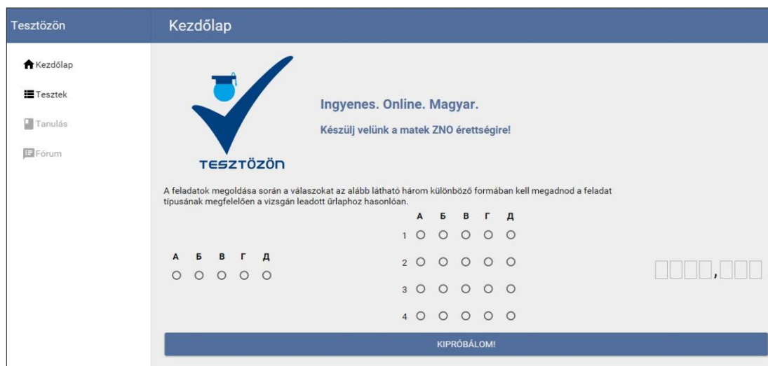
2. ábra. A Polymer Core és Paper elemeit, valamint standard elemeket felhasználó weboldal