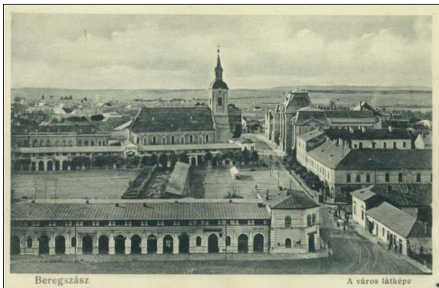
1. ábra. A beregszászi református templom látképe az 1900-as évek elején, korabeli képeslapon

Az első világháború, amelyet a kortársak még „nagy háborúnak” neveztek, nagyon sok megszorítást, majd nyomorúságot hozott Beregszász város lakói számára is. Azonban azt, ami a háború negyedik évében, 1918-ban történt, senki sem gondolta a beregszászi református közösség tagjai közül még legrosszabb álmában sem. Először a közösség szomorúan vette tudomásul, hogy az osztrák–magyar hadvezetőség elrendelte a harangércék és vörösréz anyagok beszolgáltatását, s ebből kifolyólag a beregszászi templom tornyából a három harang közül elvitték a két kisebbiket, így csak a legnagyobb maradt a helyén.