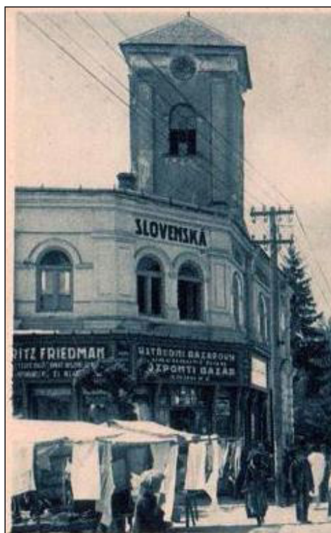
4. ábra. A beregszászi református templom tornya 1921-ben, az ideiglenes toronytetővel