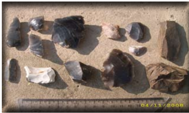
3. ábra. A Nagymuzsaly-A késő-paleolit lelőhely régészeti anyagának nyersanyagtypusai: obszián, kova, limnokvarcitéskovásodott homokkő /Сировина археологічних знахідок пізньопалеолітичного місцезнаходження Мужієво-А: обсидіан, кремій, лімнокварцит і кремнистий пісковик

1 – Мужієво-А, 2 – Золотиста гора, 3 – Велика гора, 4 – Бене – Кішвартего, 5 – гора Келемен. Території, виділені лініями, являються місцезнаходженням опалолітів