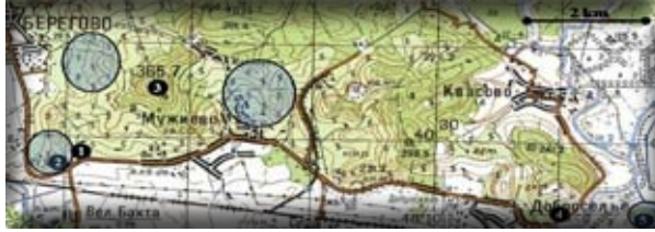
2. ábra. A Beregszászi-dombvidék déli része. 1 – Nagymuzsaly-A, 2 – Aranyos-hegy, 3 – Nagy-hegy, 4 – Bene – Kisvártető, 5 – Kelemen-hegy. A körvonallal megjelölt területek az opalitok előfordulásának helyét mutatják. /Південна частина Берегівського горбогір'я.

1 – Мужієво-А, 2 – Золотиста гора, 3 – Велика гора, 4 – Бене – Кішвартего, 5 – гора Келемен. Території, виділені лініями, являються місцезнаходженням опалолітів