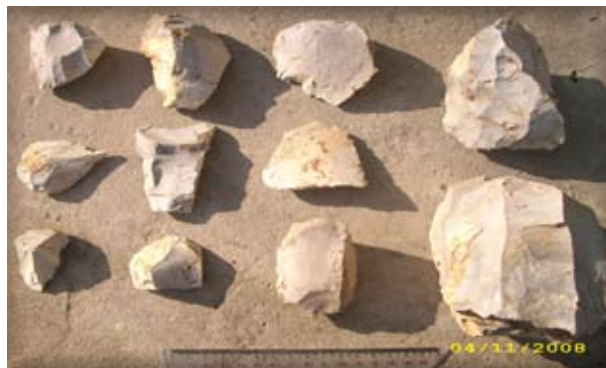
5. ábra. Régészeti leletek a Nagyuzsaly-A lelőhelyről/ Археологічні знахідки з місцезнаходження Мужієво-А