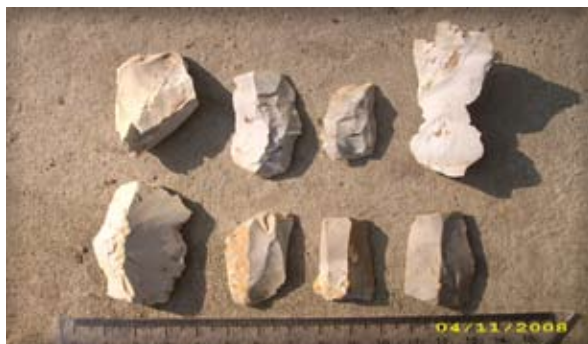
6. ábra. Régészeti leletek a Nagyuzsaly-A lelőhelyről/ Археологічні знахідки з місцезнаходження Мужієво-А