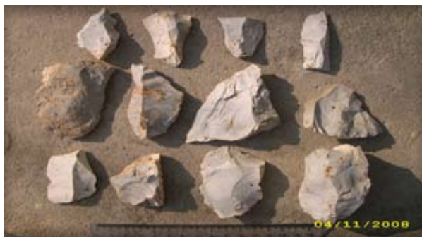
4. ábra. A Nagymuzsaly-A késő-paleolit lelőhely régészeti anyagának nyersanyagtypusai: opalitok /Сировина археологічних знахідок пізньопалеолітичного місцезнаходження Мужієво-А: опалоліти