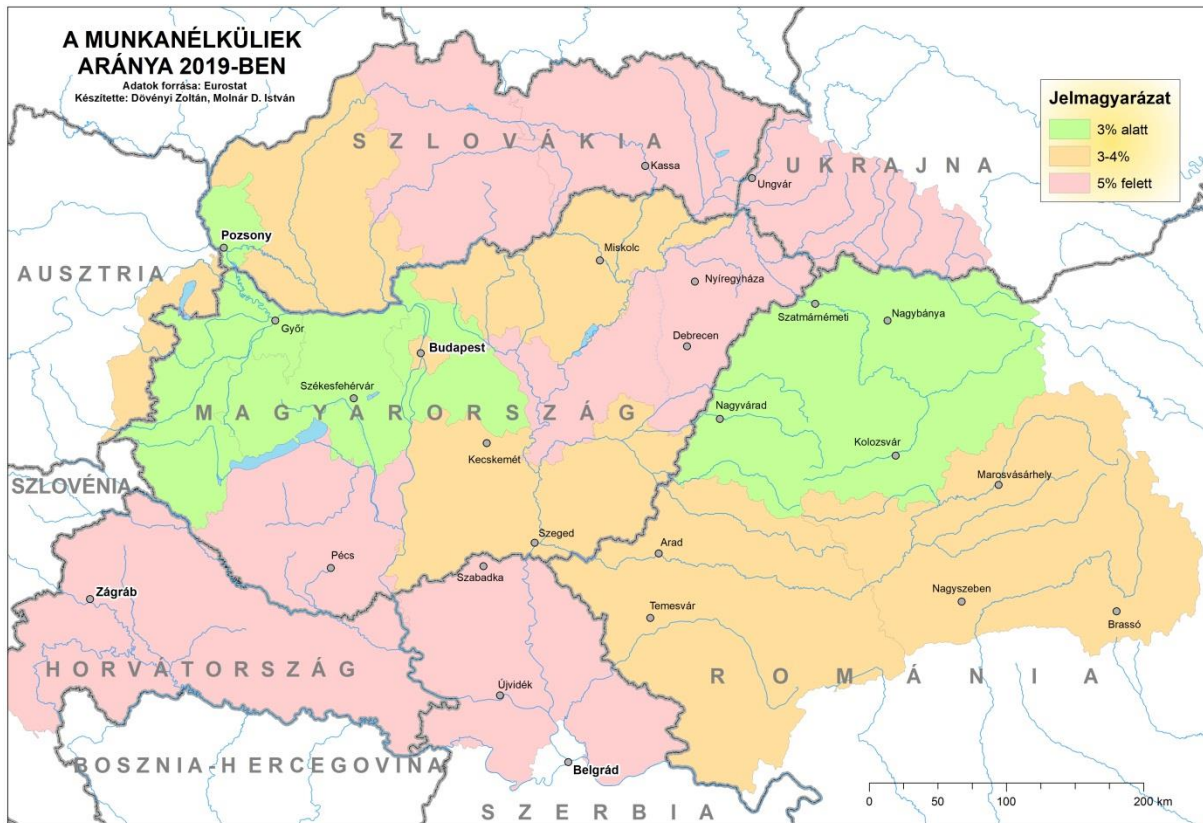
2.2.5.2. ábra. A munkanélküliség aránya 2019-ben

jelzi, hogy a munkanélküliség jelentősebb különbségei az egyes országokon belül, nem pedig az országok között alakultak ki (2.2.5.2. ábra).