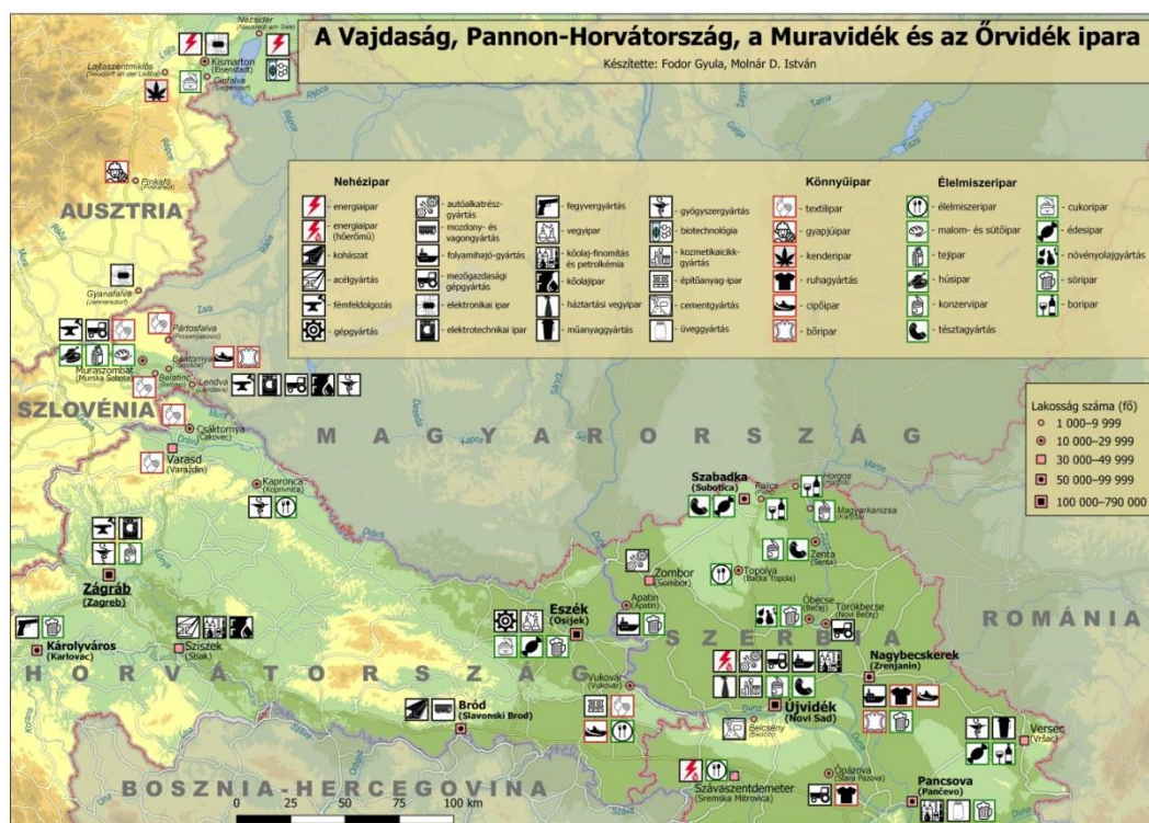
3.6.2.1. ábra. A Vajdaság, Pannon-Horvátország, a Muravidék és az Órvidék ipara

Az állattenyésztés jelentősége messze elmarad a növénytermesztésé mögött. Szerbia teljes szarvasmarha-állományának például alig több mint 1/10-e található a Vajdaságban, tenyésztésük Zombor, Topolya, Szabadka, Szávaszentdemeter környékén összpontosul. Országos viszonylatban sokkal jelentősebb a régió sertésállománya , amelynek földrajzi elhelyezkedése jelentős átfedést mutat a szarvasmarha-tenyésztés vidékeivel. A juh- és a baromfitenyésztés térségszerte elterjedt, míg az édesvízi haltenyésztés Óbecse és Versec környékén koncentrálódik.