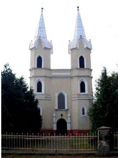
19. kép A szürtei református templom