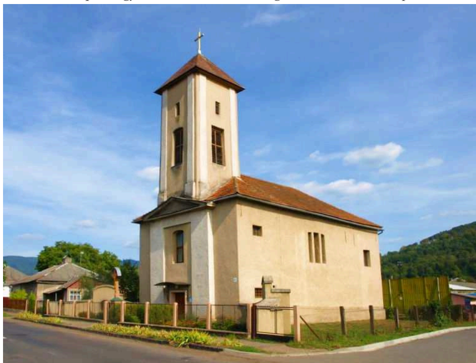
22. kép A nagybereznai Szentháromság római katolikus templom