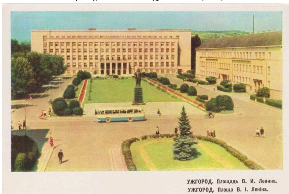
2. kép Ungvár, Lenin tér, egy 1967-es képeslapon