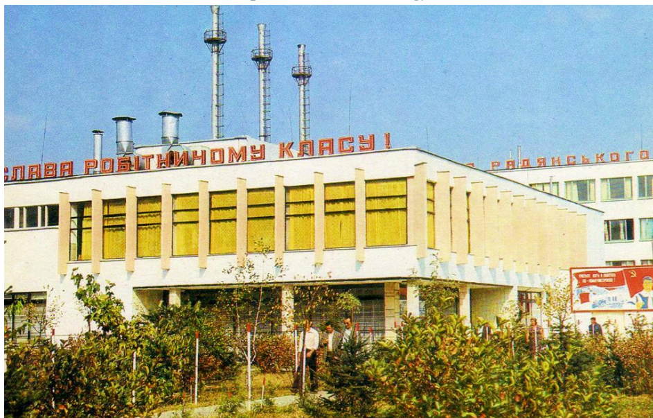
3. kép A Munkácsi Bútorgyár