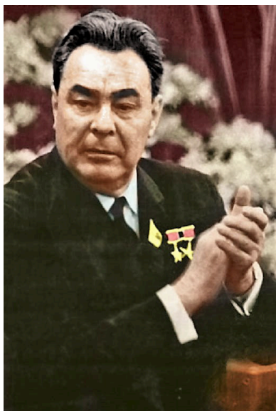
1. kép Leonyid Iljics Brezsnyev 1967-ben