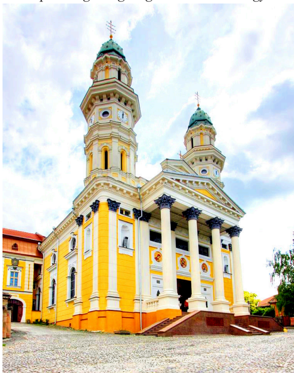
6. kép Az ungvári görögkatolikus székesegyház