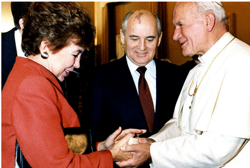
10. kép Mihail Gorbacsov és felesége, Raisza II. János Pál pápával 1989-ben

Forrás: https://www.rbc.ru/politics/24/05/2017/5925526a9a7947d23775b916 , letöltés 2021. júl. 23.