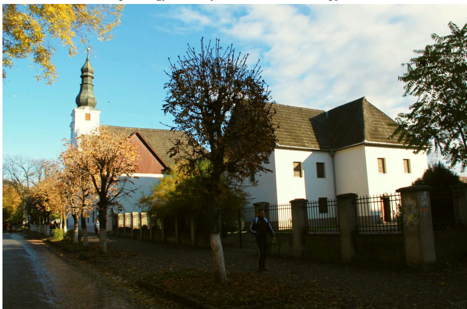
15. kép A nagyszőlősi ferences kolostor napjainkban