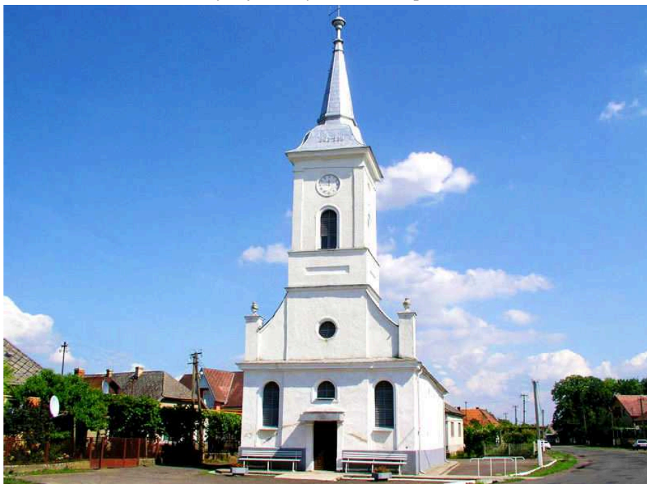
17. kép Tiszapéterfalva, az 1989-ben visszaadott és felújított református templom