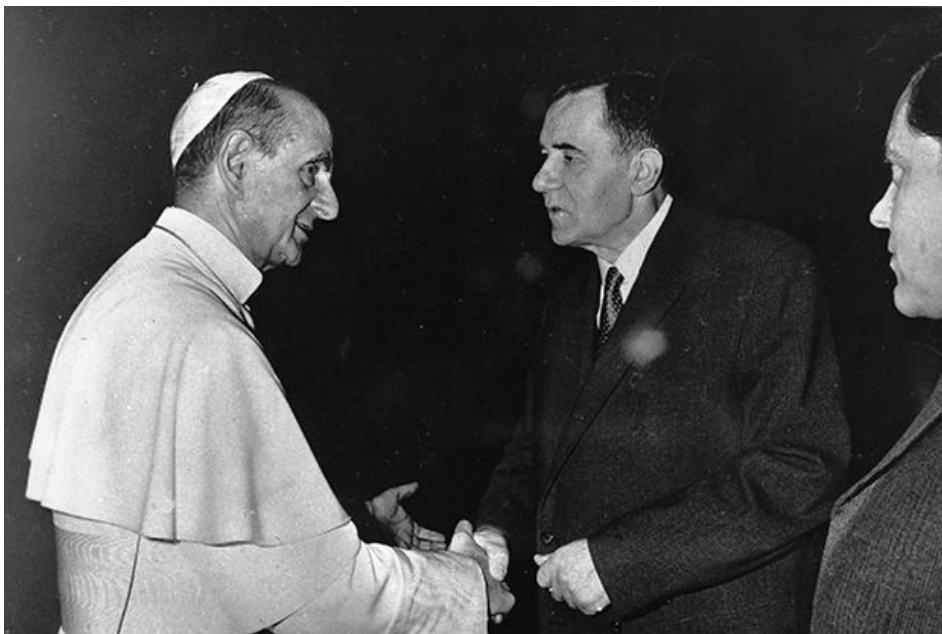
16. kép VI. Pál pápa és Andrej Gromiko találkozása 1966. április 27-én a Vatikánban