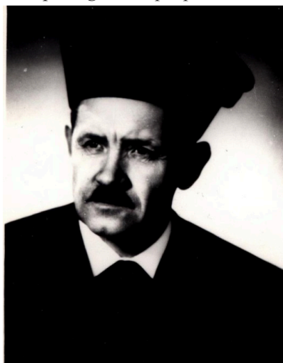
21. kép Forgon Pál püspök 1978-ban

új püspökök között az egyik legalkalmasabb személyként néztek az 1972-ben beregi esperessé választott Forgon Pálra. Végül 1977 decemberében a 78 éves püspök tisztségéről lemondott. Ekkorra Forgon mellett már csak Mitró István ungi esperes maradt, aki szóba jöhetett, mint püspök aspiráns. A legmagasabb református egyházi pozícióban bekövetkező személycserének a kérdése az államapparátus élénk figyelmének középpontjában volt, ám a már több mint egy évtizede beregszászi lelkészként szolgáló Forgont ők sem kifogásolták. Így történt, hogy 1978. május 21-én Beregszászban Forgon Pált iktatták be a KRE püspöki tisztségébe.