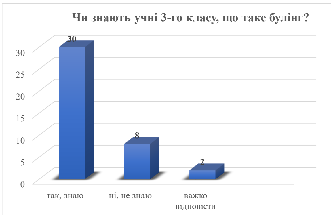
Діаграма 2. Чи знаєш ти, що таке «булінг»?

Аналізуючи питання, чи знає дитина, що таке булінг, ми отримали такий розподіл відповідей, нижче наведений в діаграмах: