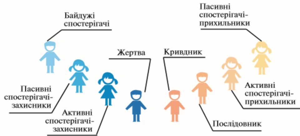
Мал.1. Коло булінгу