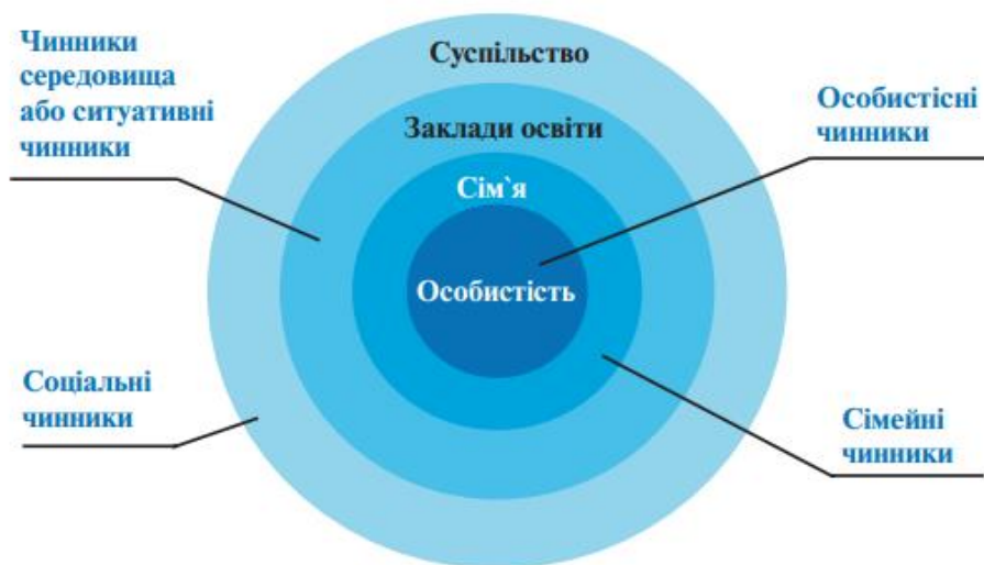
Мал. 2. Групи чинників булінгу (цькування)

Виникнення булінгу (цькування) у міжособистісних взаєминах може бути спричинене різноманітними факторами, які можна класифікувати у чотири групи: особистісні, сімейні, соціальні та оточення (середовище).