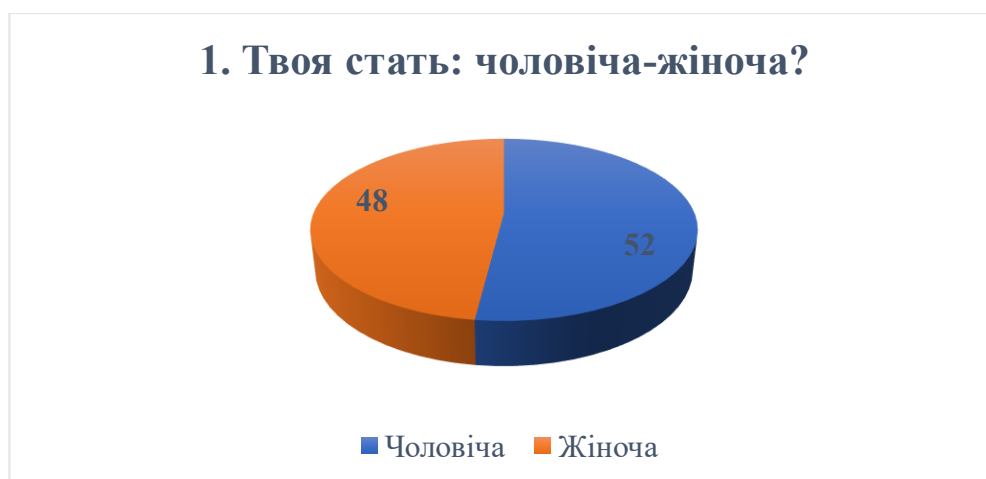
Діаграма 1. Стать опитуваних

Запитання в анкеті умовно поділили на три категорії: