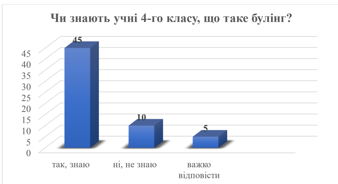
Діаграма 3. Чи знаєш ти, що таке «булінг»?