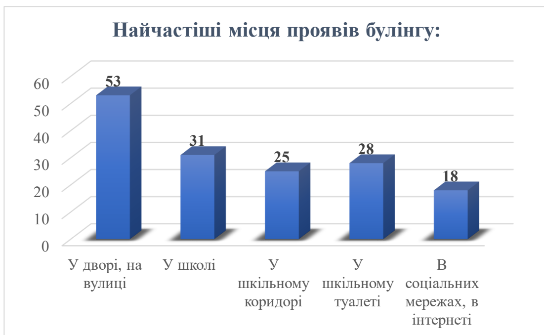
Діаграма 6. Місця, в яких учні найчастіше зазнавали булінгу

Аналізуючи дану діаграму, ми спостерігаємо, що найчастіші прояви булінгу спостерігаються у дворі та на вулиці, тоді як найменші випадки зафіксовані в соціальних мережах та Інтернеті.