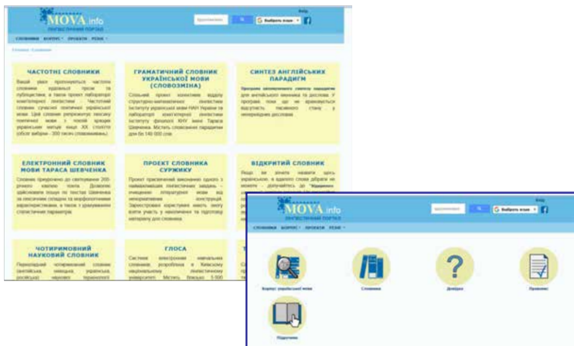
Рис. 1. Інтерфейс лінгвістичного порталу MOVA.info

У процесі професійної підготовки фахівців філологічних дисциплін пропонується використання різноманітних порталів, зокрема Мова.інфо – лінгвістичний портал, який надає можливість: отримувати консультації та роз'яснення з питань, пов'язаних з українською мовою; розміщувати наукові статті, монографії, підручники, бюлетені та інші матеріали наукового характеру, пов'язані з лінгвістикою; отримувати безкоштовний доступ до інформаційних ресурсів (корпус української мови, електронні словники тощо). На цьому порталі пропонуються сайти, безпосередньо пов'язані з різними аспектами функціонування української мови у реальному та віртуальному світах; мовні ресурси від освітянсько-новинних до розважальних (рис. 1).