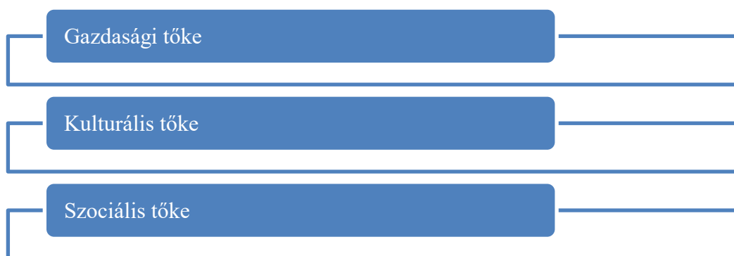
1.1.2.ábra. Tőke jellege szerinti csoportosítás

Jellege szerint a tőkét 3 főbb csoportra lehet bontani, majd azon belül több ágazatra is.