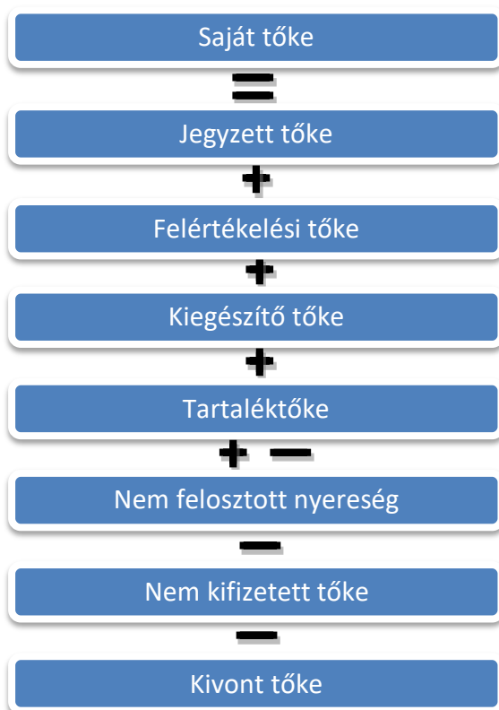
1.2.1.ábra. Saját tőke meghatározása