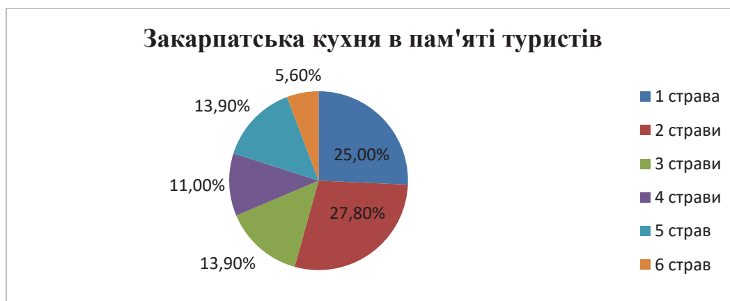
Рис. 3. Знання страв закарпатської кухні туристами