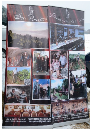
Фото 12 і 13. Вівіска команди з Угорщини та вівіска закарпатського винороба на Міжнародному фестивалі різників у с. Геча

Міжнародний фестиваль вина у Берегові. Як і на фестивалі в Гечі, на Міжнародному фестивалі вина в Берегові головний «фасад» та реклама «заманювали» гостей двома мовами (українською та угорською) (фото 14 та 15).