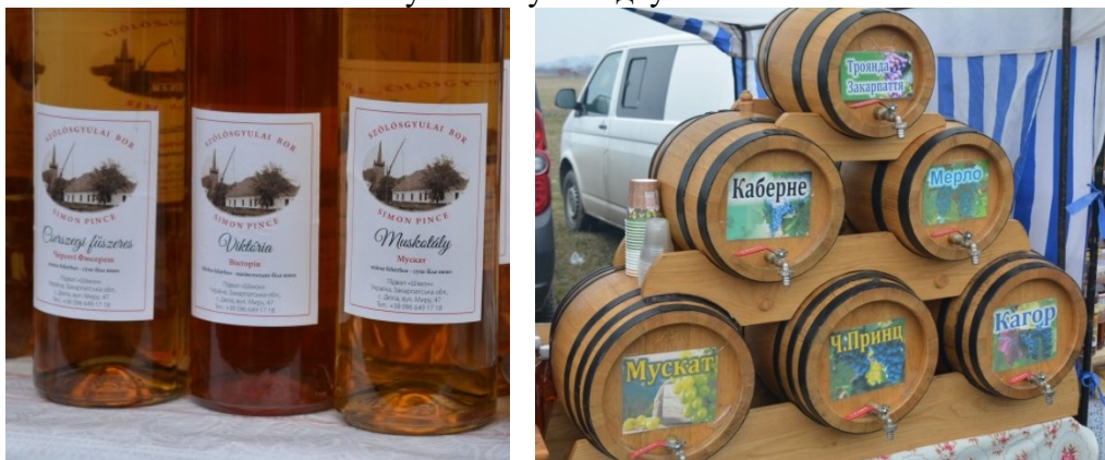
Фото 9 і 10. Товари з двомовними написами одного винороба поміж стендів із одномовними назвами вин та інших страв

На стендах, де пропонують напої (переважно вина та домашні наливки), тільки Спілка угорських виноробів Закарпаття у своїх павільйонах подавала інформацію переважно двома мовами (див. фото 9). Натомість в інших місцях представлено написи тільки державною мовою (див. фото 10). Проте й серед павільйонів учасників Спілки були стенди, де табличка з іменем винороба двомовна, але назви вин подані лише українською. Написи іншими іноземними мовами тут теж були відсутні.