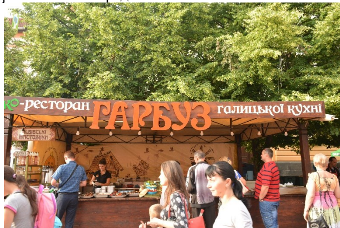
Фото 22. Стенд ресторану галицької кухні

На території, розташованій далі від головної сцени, домінує українська мова. Зважаючи на те, що тут свої товари й вироби пропонують, наприклад, продавці риби з Поділля та Хмельницької області, кулінари та продавці сувенірів зі Львова та Івано-Франківська, це зовсім не дивно (див. фото 22). Частина місцевих продавців, які прибули із закарпатських сіл, де компактно проживають угорці, незначна на цій території фестивалю, та навіть їхні вивіски зрідка оформлені угорською мовою. Інформації іншими іноземними мовами на цій частині фестивалю не представлено.