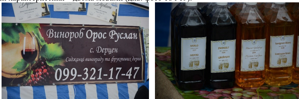
Фото 18 і 19. Українська вивіска і двомовні етикетки

Винороб із Дерцена представляє вивіску державною мовою, а назви продукції та її головні характеристики – двома мовами (див. фото 18 і 19).