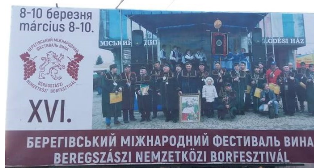
Фото 14 і 15. Сцена Міжнародного фестивалю вина з двомовним написом та рекламний щит у с. Яноші

Територія фестивалю вина поділена на дві чітко окреслені частини: поруч із центральною сценою, на якій розмістилися члени Лицарського винного ордену святого Венцела, та розташована трохи далі територія, де встановлені кулінарні та сувенірні палатки і стенди. З погляду лінгвістичного ландшафту ці дві території відрізняються, адже якщо на локаціях членів ордену святого Венцела всі написи зроблені двома мовами (угорською та українською), то на інших представлено написи лише державною мовою. Проте на всіх локаціях фестивалю відсутня інформація, перекладена іншими іноземними мовами.