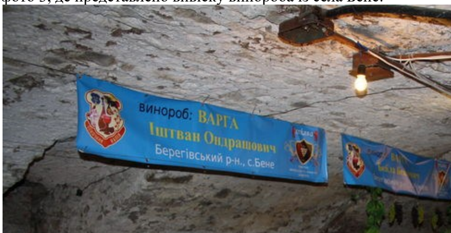
Фото 3. Вивіска винороба з Бене на ужгородському фестивалі «Закарпатське божолє»

На більшості фестивалів ні господарські організації з угорською часткою власності, ні винороби угорської національності зазвичай подають відомості про себе лише українською мовою. Відсутня інформація угорською чи англійською мовами, як це зафіксовано на фото 3, де представлено вивіску винороба із села Бене.