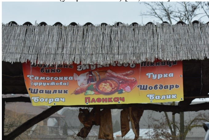
Фото 7. Це теж гурка...

На фестивалях, що відбулися у 2018 та 2019 роках, з-поміж команд, які готували страви та брали участь у змаганнях, двомовні написи використовували тільки учасники з Угорщини та Сербії, а решта інформувала гостей заходу лише українською мовою. Зокрема, в написах натрапляємо на такі назви: шовдарь , гурка , пikниця , балик , бограч , шашлик , стейк (див. фото 7). Натомість не зафіксовано вивісок ні угорською, ні українською, ні іншою іноземною мовою, де б рекламували такі традиційні під час різання свині угорські страви, як свинячі реберця з квашеною капустою по-угорськи (угор. toroskáposzta ) та бульйон зі свинини (угор. húsleves ) [25, с. 138].