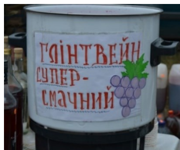
Фото 5 і 6. Двомовна реклама глінтвейну у 2012 році та українською мовою у 2018 році