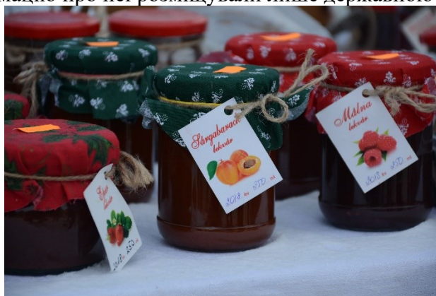
Фото 11. Продукція з села Бене

Вівіски домашньої випічки, повидла, джемів та інших товарів одномовні, угорські написи зафіксовано тільки серед продукції двох сусідніх угорських населених пунктів (див. фото 11). Сільськогосподарські виробники та підприємці, які прибули з населених пунктів, де не проживають угорці, назви своєї продукції (мед, сири, м'ясні вироби, солодощі тощо) та інформацію про неї розміщували лише державною мовою.