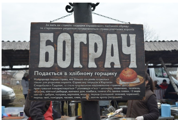
Фото 8. Реклама бограча у представленні команди «Гарбуз»

Галицька команда «Гарбуз» 1 навіть «містифікує» бограч (гуляш). На українськомовній вивісці, яка рекламує бограч, читаємо, що цю страву протягом століть готували виключно для угорських королів; страва, приготовлена в Карпатах, сподобалася гуцулам, після чого стала їхньою національною стравою. Згідно з описом, для приготування бограча використовують сім різновидів м'яса та дванадцять видів овочів (див. фото 8). Насправді історія бограча (гуляша) пов'язана з селянами Середньодунайської низовини (Альфельд), які самі готували страви, зокрема й гуляш, який спочатку їли без картоплі, а з хлібом. Спершу для приготування бограча використовували яловичину, а з кінця XVIII століття – уже й баранину. Своє місце в щоденному меню як міщан, так і дворянства ця страва здобула у XIX столітті (докладніше див.: http://www.mnhsz.com/magyar-gulyasleves ).