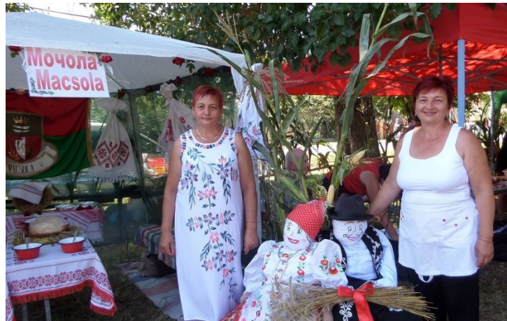
Фото 4. Вивіска учасника на фестивалі «Лечо» в селі Чома

«Зовнішній вигляд» кулінарних фестивалів, організовуваних на Берегівщині й орієнтованих насамперед на туристів з Угорщини та місцеве угорське населення, спочатку був представлений угорською мовою або двома мовами: угорською та українською. Після 2010 року на цих фестивалях все більше проступало двомовне угорсько-українське «обличчя», а внаслідок зростання потоку внутрішніх туристів почала домінувати українська мова або ж двомовні українсько-угорські написи й вивіски. Інформація іншими мовами (хоча б англійською) для закордонних туристів, як і раніше, відсутня й нині.