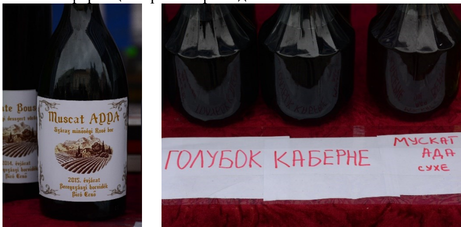
Фото 16 і 17. Етикетка угорською мовою та напис українською під корчагами з вином

Як і в селі Геча, на Міжнародному фестивалі вина в Берегові лише угорські винороби на своїх стендах використовують двомовні написи. Хоч там теж не завжди використовують угорську мову, наприклад, на стенді одного винороба представлено етикетки на пляшках вина угорською мовою, а на прилавку під корчагами з вином розташований виготовлений вручну напис українською мовою (див. фото 16 і 17). Вивіска ж біля стенду містить інформацію про винороба двома мовами.