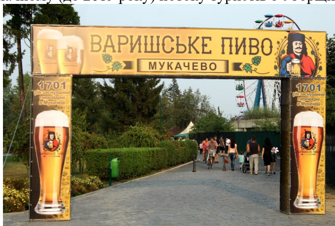
Фото 2. Святкова рамка на фестивалі «Варишське пиво» (Мукачеве)

компактним проживанням угорців (наприклад, Міжнародний фестиваль вина у Берегові), двомовним є тільки головний «фасад» (наприклад сцена, написи на входах до території фестивалю тощо), натомість на більшій частині локацій розміщені стенди лише з інформацією українською мовою. На інших фестивалях навіть головний «фасад» одномовний. У мовному ландшафті фестивалів не бачимо ні мов міжнародного спілкування (англійської, німецької, французької), які можуть інформувати іноземних туристів, ні державних мов сусідніх держав (словацької, румунської, польської), ні інших іноземних мов (див. фото 2). Поряд з українською, у мовному ландшафті фестивалів засвідчено тільки угорську мову, що можливе завдяки закарпатській угорській нацменшині, а також значному (до 2019 року) потоку туристів з Угорщини.