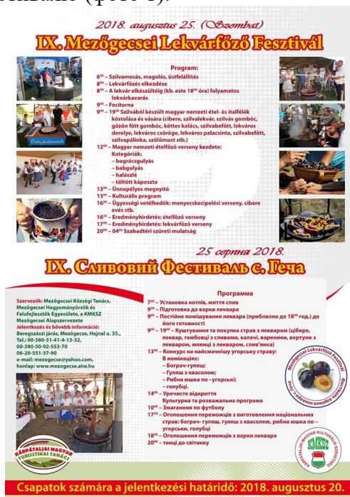
Фото 1. Двомовне оголошення про Сливовий фестиваль у с. Геча

Гастрономічні фестивалі (особливо фестивалі вина) завойовують усе більшу популярність у фестивальному туризмі Закарпаття та приваблюють до нашого краю велику кількість туристів [35, с. 375]. Завдяки цьому на фестивалях у селах із компактним проживанням угорців українська мова постає першочерговим засобом маркетингової діяльності з популяризації фестивалю (фото 1).