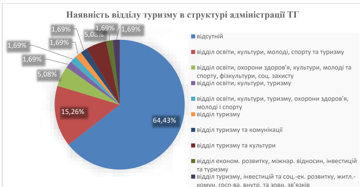
Рис. 2. Наявність відділів з питань розвитку туризму в структурі адміністрацій територіальних громад Закарпатської області

Ситуація на місцях подібна. На території регіону створено 64 територіальні громади (далі – ТГ). З проаналізованих 59 сайтів ТГ (сайти 5 ТГ на момент проведення дослідження були неактивні), лише в 21 (35,6%) громаді сформовано відділи / управління / комісії, що опікується розвитком туризму (див. рис. 2), при цьому 17 (81%) поєднують туризм з культурою, і лише 2 (9,5%) – з економікою.