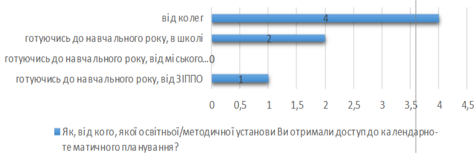
Рис. 2. Доступ до календарно-тематичних планів

В анкеті було відкрите питання, тобто опитані педагоги могли вільно описати свої враження стосовно календарно-тематичного плану.