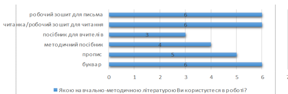
Рис. 3. Методичні засоби та матеріали

Окреме питання було присвячене методичній літературі, якою користуються вчителі у своїй роботі (рис. 3).