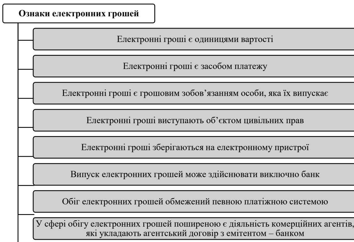
Рис. 1. Ознаки електронних грошей*

Ознаки електронних грошей наведено на рис. 1.