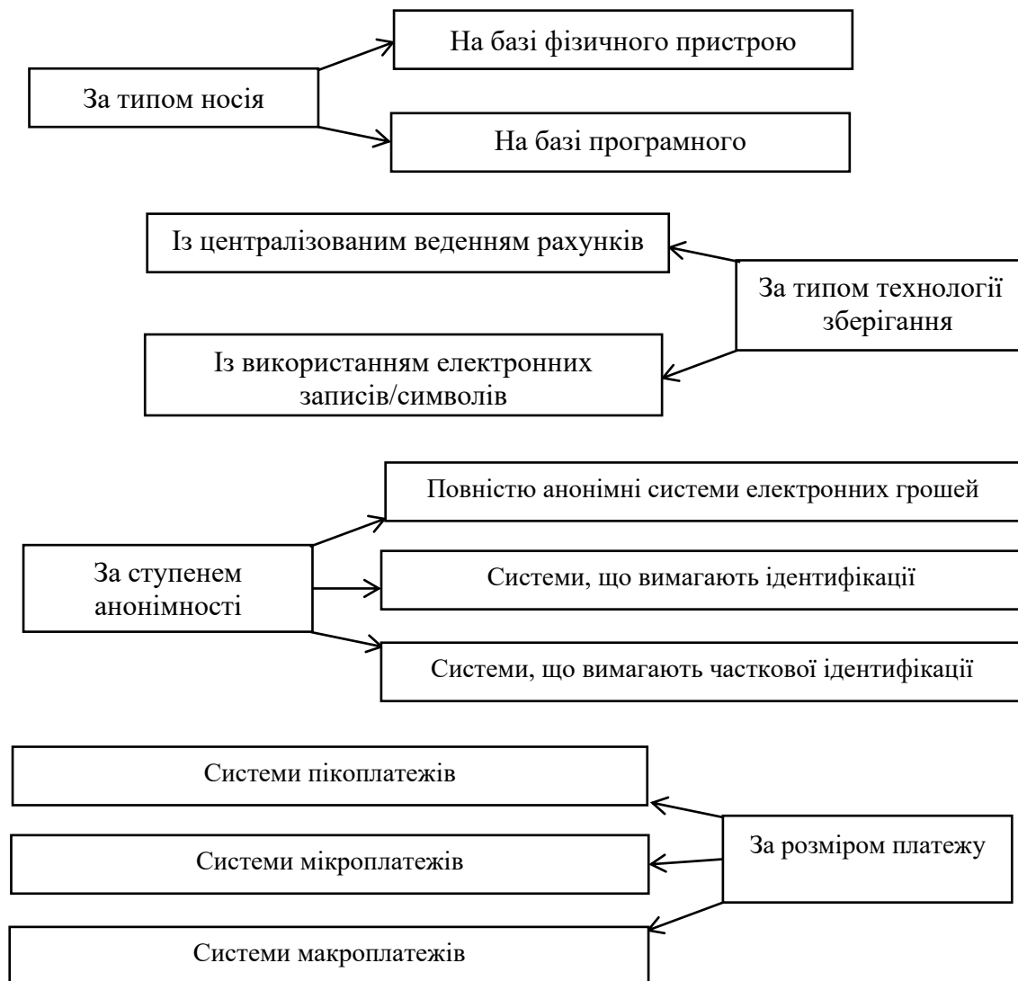
Рис. 2. Класифікація електронних грошей*