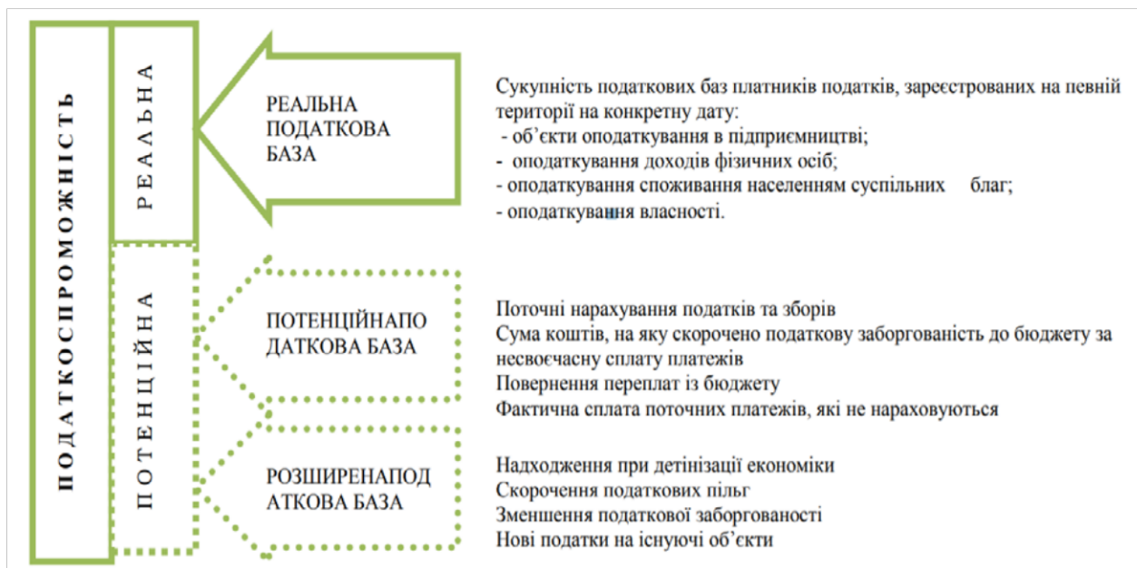
Рис. 1. Складові формування податкоспроможності територіальної громади [8]

Аналізуючи рис. 1, ми бачимо, що структура податкоспроможності регіону є досить розгалуженою та включає три основні складові: реальну податкову базу, потенційну та розширену. Остання може стати каталізатором економічного розвитку території та відновлення виробництва та підприємницької діяльності в межах відповідної адміністративно-територіальної одиниці.