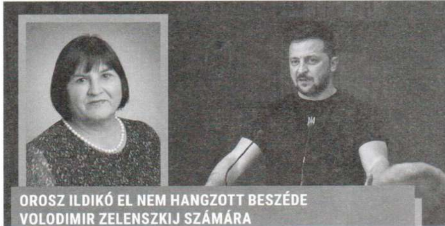
OROSZ ILDIKÓ EL NEM HANGZOTT BESZÉDE VOLODIMIR ZELENZSKIJ SZÁMÁRA