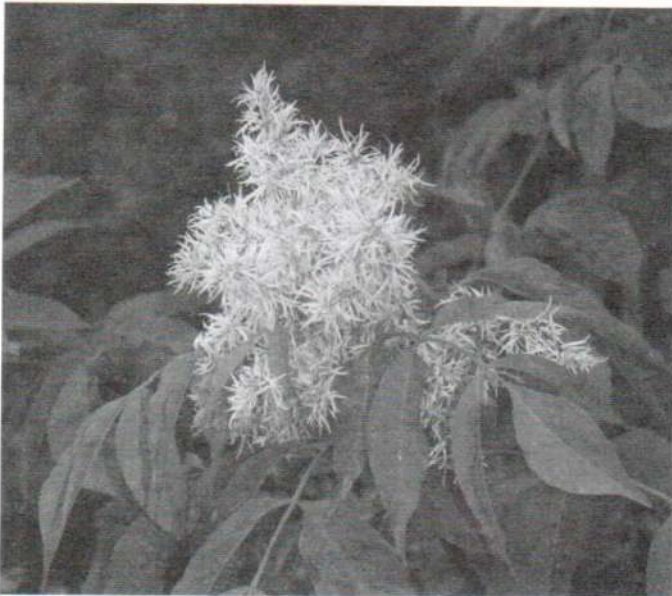
Virágos kőris ( Fraxinus ornus )

A rezervátum számos érdekes növényfajnak ad otthont. A növényvilág gazdagsága leginkább a hegy tetején, a sziklás lejtőkön látható. Különösen tölgy- és bükkerdők találhatóak itt - ezek főként a hegy északi lejtőjén nőnek. A rezervátumnak azon a részén, ahol andezitsziklák kerülnek a felszínre, elterjedt a virágos kőris ( Fraxinus ornus ). Az állomány nagyobb területet foglal el, ez egy ritka reliktum faj, amely csak itt maradt fenn egész Ukránban.