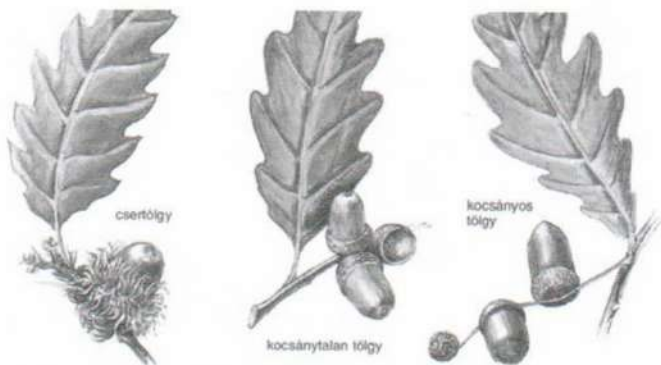
A cser-, a kocsánytalan- és a kocsányos tölgy termésének összehasonlítása

A Gyulai - hegy a Kárpátok legkisebb masszívuma, amely a Tisza folyó völgyében, a Gutini masszívum délnyugati kitüremkedésein (a Vihorlát - Gutini gerinc része) helyezkedik el, és keletről a román államhatár határolja. A rezervátum