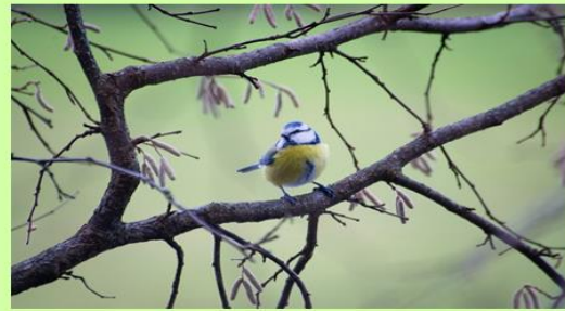
4. ábra Szülföldemen c. vers tanítása, 1. feladat