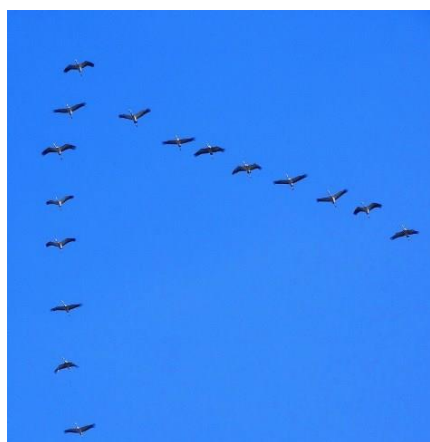
19. ábra V alakban repülő darvak