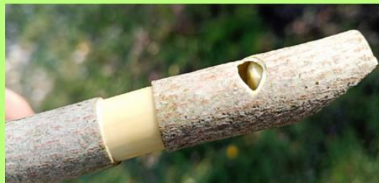
10. ábra Fűzfasíp