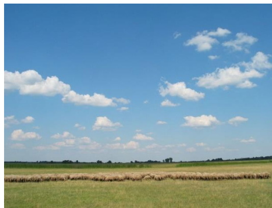
17. ábra Síkság