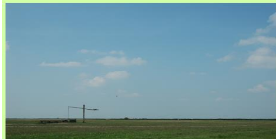
9. ábra Az Alföld