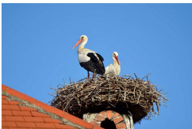
18. ábra Gólya