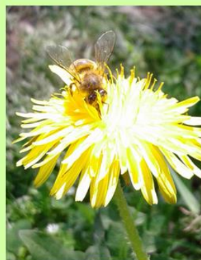
11. ábra Méh a virágon