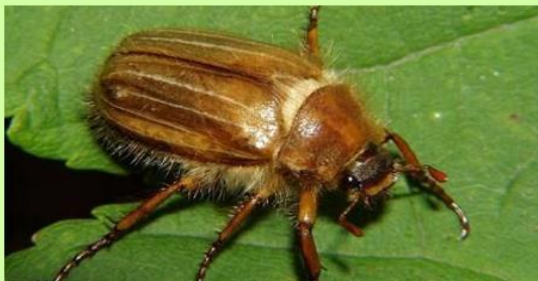
8. ábra Sárga cserebogár