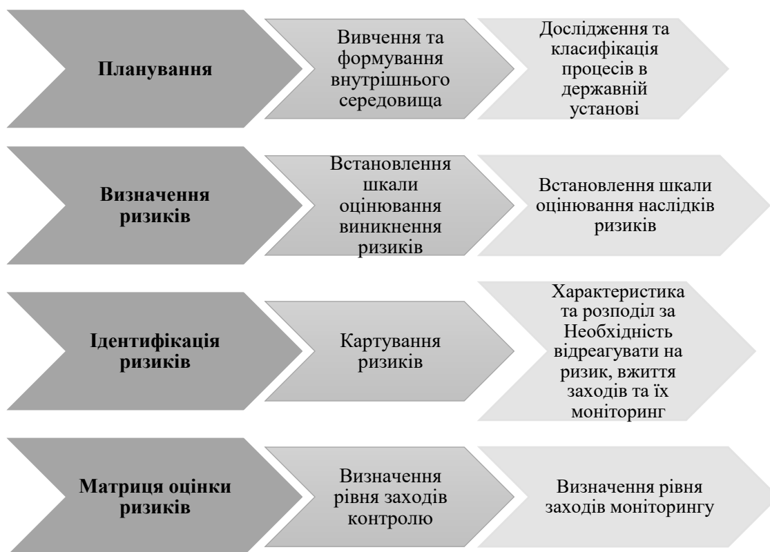
Рис.2. Система внутрішнього контролю на основі ризико-орієнтованого підходу в державних установах