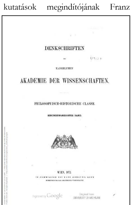
3. ábra: A Die slavischen Elemente im Magyarischen borítólapja

Miklosich 75 oldalas tanulmánya 15 fejezetből áll. A tizenharmadik fejezet az általa szláv eredetűnek minősített 956 szó adatbázisát (18–63), míg az azt követő a magyar megfelelők ábécé szerint rendezett regiszterét tartalmazza (63–73). A munkát egy közel háromoldalas 36 tételből álló