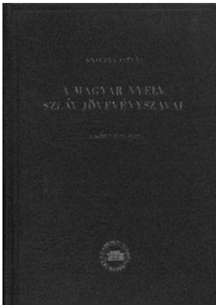
4. ábra: A magyar nyelv szláv jövevényszavai 1955-ös borítója

írja: „A magyar nyelv szláv jövevényszavai kutatásának részletes történetét, az eddigi vélemények általános jellemzését és kritikáját, csak e munka második kötete fogja tartalmazni, vagyis az, amely a szláv jövevényszavaink, hangtanával, szóképzésével, a szláv jövevényszavak rétegeinek kérdésével, szláv és magyar társadalmi háttérével és még néhány egyéb részlettel fog foglalkozni” (Kniezsa 1955 I/1: 3).