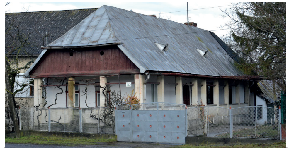
A líceum étkezdéjeként szolgáló egykori családi ház