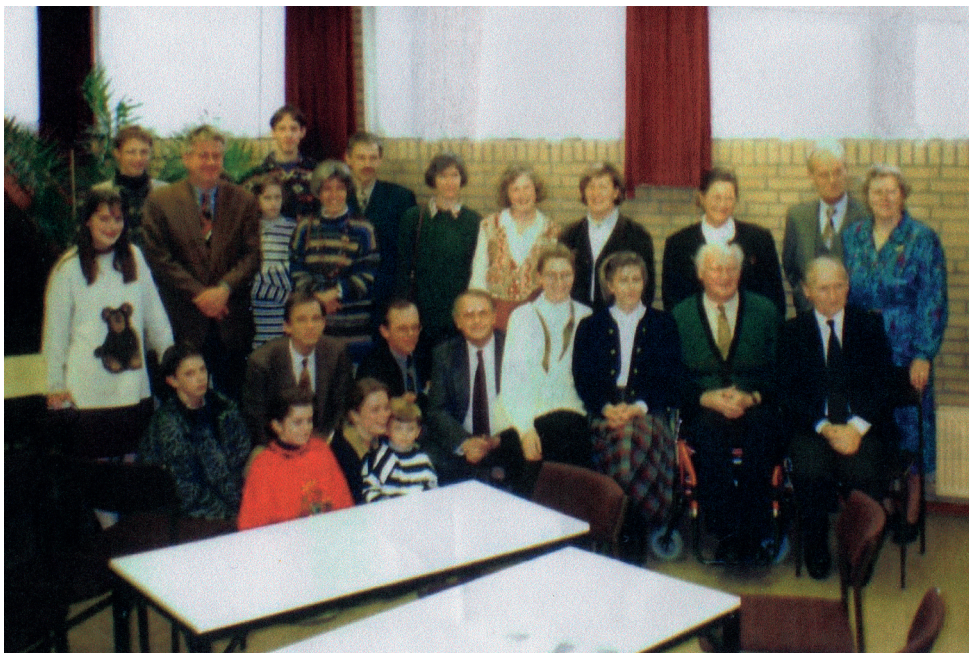
A líceumot támogató családok (Ridderkerk, Hollandia, 1995) 16

A megalakuláshoz szükséges anyagi alapot az ETI – a holland Uni iskolaügyi szervezete – biztosította, amely a magyarországi és Kárpát-medencei keresztény iskolák ügyével foglalkozik. 14 Ebbe a munkába kapcsolódott be az amerikai Christian Reformed World Missions (CRWM) református misszió, 15 valamint segítséget nyújtottak a hollandiai ridderkerki gyülekezet tagjai, akik konzerv élelmiszer-ellátmányt küldtek az iskola számára évente 3–4 alkalommal.