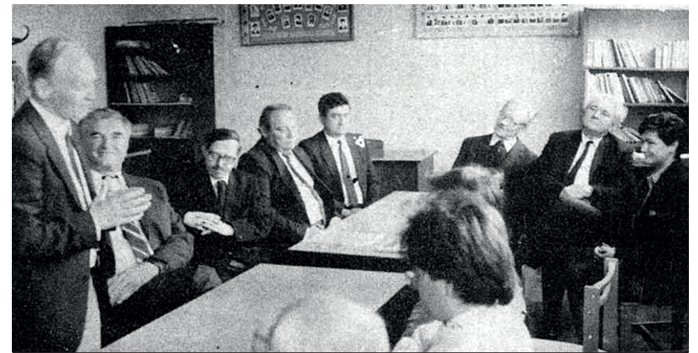
Megbeszélés a Nagyberegi Középiskola tanárijában, 1993. szeptember 8. 6