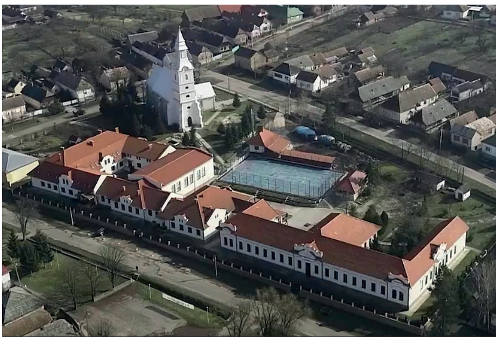
Az épület új és régi szárnya (2020)

A következő jelentős iskola-strukturális változást ismét egy ukrán állami rendelet miatt lépte meg az intézmény vezetése. Ezt az – ominózus, 2017-ben elfogadott – új ukrán oktatási törvény miatt megtett kényszerű lépést szinte minden egyházi fenntartású líceum meglépte, mivel az említett törvény szerint az állami fenntartású intézményekben csak államnyelven lehetett volna oktatni majd (pár év átmeneti idő után). Kárpátalja magyar nemzeti-ségű közössége számára ez a törvény az addig – több mint 70 éve – működő anyanyelvi oktatás intézményhálózatának a felszámolását vetítette előre. Menekülési útvonalat jelenthettek a vidék egyházi oktatási intézményei – közöttük az NbRL is –, melyek nyitottak lefelé, vagyis 2020-tól a 4. osztályt végzettek is beiskolázták. Így az NbRL immár – a 10 és 17 éves korosztály oktatásával – hétéves líceummá vált.