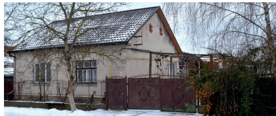
A Gázla utca 147. szám alatti egykori családi ház