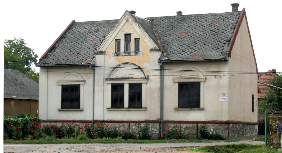
A pár évig fiú-, majd leánykollégiumként használt épület, egykori néptanítói lakás