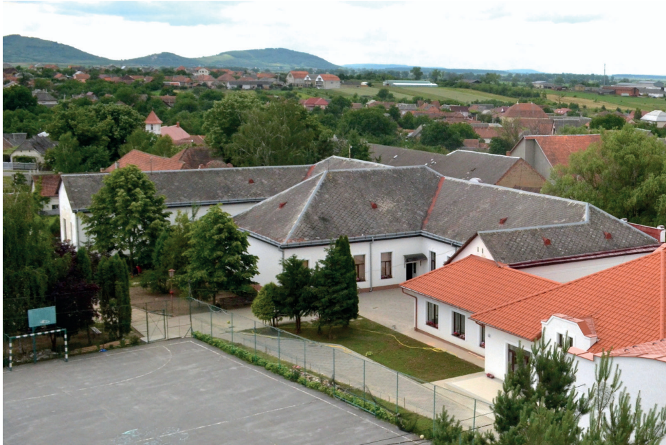
Az egykori népiskola belső udvara a hozzáépítést követően (2014)

Az 1908/09-es tanévben vezetett egyik mulasztási napló belső borítóján akadtam a kézzel írott feljegyzésre, miszerint „Az új iskolába átjöttünk 1909. január 16-án. A téli Canonica visitatio volt 1909. január 25-én.” 20