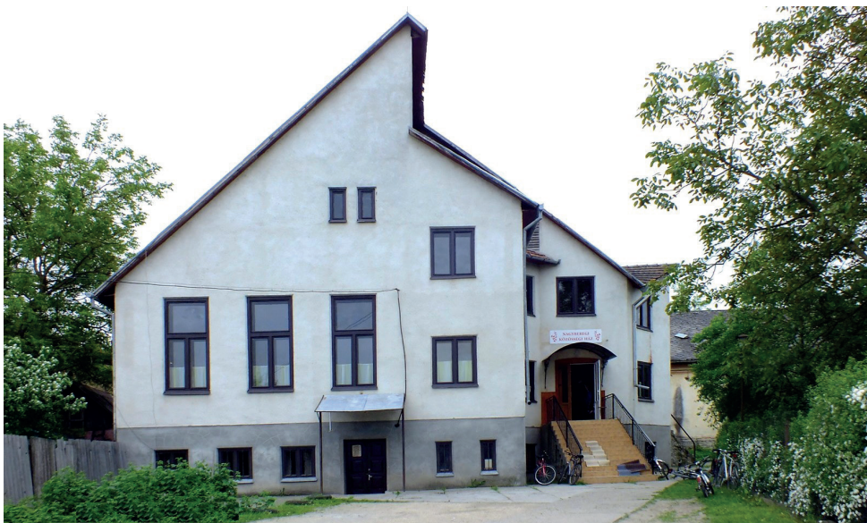
A KRE által a régi helyett megépített új kultúrház

ám ennek fejében a KRE kötelezte magát, hogy új kultúrházat épít a falu számára. Az új kultúrház – amely 1996-ban készült el – helyileg az ún. falusi klub mögé került (lásd az alábbi képet).