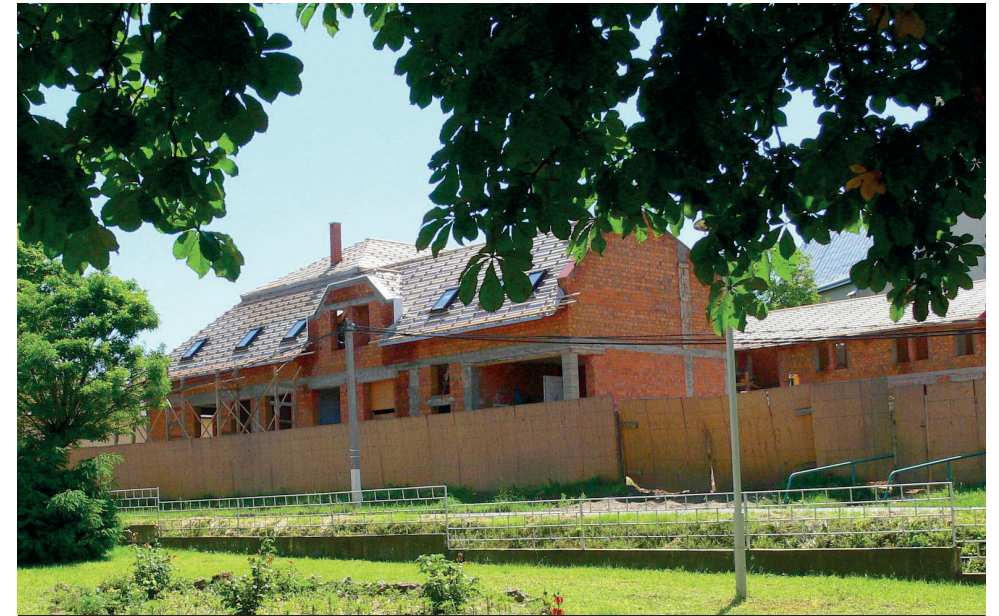
2010-ben már álltak a falak és kész volt a tetőzet is

tályt végzettek számára is a felvételi lehetőséget. A következő – 2013/14-es – tanévben pedig már a 7. és 8.-at végzettek is jelentkezhetek. Így immár a 8–9–10–11. osztályokban folyt az oktatás. Ezt követően már a dinamikus diáklétszám növekedése is bizonyította és egyértelműsítette az intézmény infrastrukturális bővítésének indokoltságát és megalapozottságát.