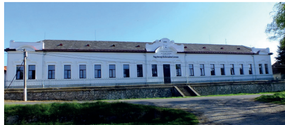
A líceum központi tanulmányi épülete, az egykori népiskola (2014)

feltárásnak köszönhetően újra köztudatba kerülhet, miszerint az iskolaépületet a falu politikai közössége építtette , se nem az egykori monarchiabeli, se nem a csehszlovák állam és nem is az egyház.