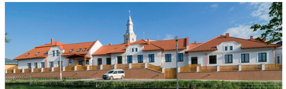
A 2014-ben átadott épületrész az utcáfrontról nézve 25

A nagyszabású építkezések 2014-ben fejeződtek be, amelynek eredményeképpen egy oktatási épületegyüttes alakult ki. Az egykori felekezeti iskola épületének termeit immár csak oktatásra használják, illetve itt került elhelyezésre a líceum könyvtára is. Az új épületrészben a tornaterem, a konyha, étkezdé, valamint a kollégium kapott helyet. Az épületkomplexum átadására 2014 augusztusában került sor.