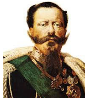
II. Viktor Emánuel, Olaszország első királya

Cavour mindig gyanakodva nézte Garibaldit, az őt viszont soha, pedig szülőföldjét, Nizzát engedte át a franciáknak. Cavour, Bismarckhoz hasonlóan, nélkülözhetetlennek tartotta magát. Garibaldi, mint idealista, a hazát, Cavour önmagát tartotta a legtöbbre – véli Taylor . 36 S bár Garibaldi nem igazán volt intellektuális alkat, ösztönösen talált rá a helyes útra. Ezt az emberi sikert irigyelte tőle Cavour, s még a királynál is rossz hírért keltette. Az idealista Garibaldi forradalmat csinált, a gyakorla-