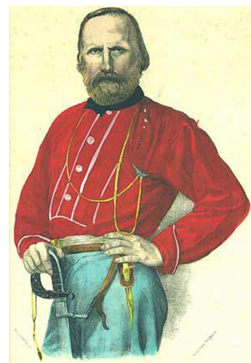
Giuseppe Garibaldi (1807–1882)

Az 1820 januárjában, Spanyolországban elkezdődött forradalmat júliusban a nápolyi felkelés folytatta, amely liberális alkotmányt akart I. Ferdinándtól. Ezt a király, kénytelen, kellelten ki is adta, ill. liberális miniszterelnököt nevezett ki. A felkelés következő állomása Piemont, majd Párizs és a portugál flotta lett. A mozgalmak a Szent Szövetség tagjainak „idegességét” váltották ki, mondván, Franciaországban is először csak alkotmányos monarchiát akartak, s aztán mi lett belőle... Már március 3-án I. Sándor orosz cár köriratban fordult az európai hatalmakhhoz, s katonai beavatkozást sürgetett. Erre leghamarabb Nagy-Britannia reagált, s május 5-én memorandumban határolódott el az orosz intervenciók tervektől, kijelentvén, hogy Madrid és Nápoly nem veszélyezteti Európa