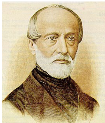
Giuseppe Mazzini (1805–1872)

A hosszú 19. század elé nyugodtan oda lehet tenni a nemzeti jelzőt – írta Diószegi István – mivel akkor a társadalom egyedei a maguk közösségi meghatározásában a nemzeti hovatartozást tették első helyre. 1 Egy nemzet az azonos nyelvet beszélő polgárok összessége – ezt pedig már Giuseppe Mazzini genovai jogász gondolta, s ki is jelentette: „ Italia fara da sé ”, vagyis Olaszország egyedül is megcsinálja. Mazzini, aki a svájci emigrációban létrehozta a Giovine Italia (Ifjú Itália)