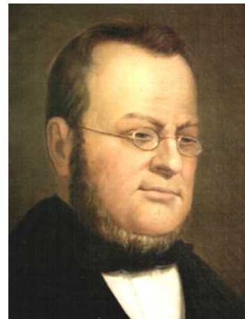
Camillo Benso di Cavour gróf (1810–1861)

Diplomáciailag legmozgalmasabb időszaka az olasz félszigetnek az 1848–49-es forradalmak idején következett be, bár ugyanaz maradt a kérdés, mint 1831-ben – Ausztria kiűzése, s az egység létrehozása. Pedig Metternich osztrák kancellár 1847-ben még azt mondta, hogy Itália csak egy földrajzi, nem állami fogalom. S hogy a földrajzi közelség, politikai érintettség, stratégiai távlatok játszották-e a meghatározó szerepet a döntés meghozatalakor, azt nem tudni, ám az tény, hogy újra Ausztria próbált rendet rakni a térségben. 1848. március 18–22. között Joseph Radetzky tábornokot kiverték Milánóból, pedig az tizennégyezer fegyelmezett katonával és harminc ágyúval „örizte a rendet” a városban. 12 Radetzky március 22-én naplójába a következőt jegyezte fel: „Ki kell ürítenem Milánót, ez életem legszomorúbb órája! Fellázdadt az egész környék; Piemont felől, hátulról fenyegetnek.” 13 Eztán a lombardiai várnégyszögbe volt kénytelen menekülni, 14 s védelemre rendezkedett be. A mindezidáig mérsékelt politikát folytató Cavour a Risorgimento 15 március 23-i vezércikkében ezt írta: „...a szárd királyság számára elérkezett a döntő óra: egész léte és jövője attól függ, vállalja-e a vezető szerepet az ország függetlenségi harcában, vagy elmulasztja a megfelelő pillanatot...” 16