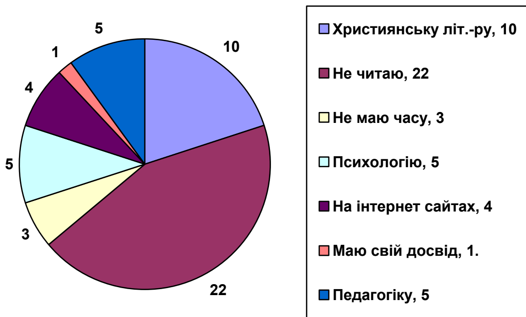
Діаграма 1. Рівень зацікавленості батьків у педагогічній літературі

В тестуванні було питання для батьків: «Чи читаєте педагогічну літературу, якщо так, то яку?» На основі відповідей батьків я хотіла дізнатися, чи розвивають себе батьки педагогічно. Основні відповіді батьків показано у діаграмі № 1. На діаграмі добре видно рівень зацікавленості батьків у педагогічній літературі. (Див. Діаграма 1)