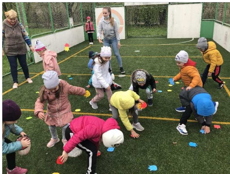
III. és IV. megálló képei (saját felvétel, 2021.04.21)