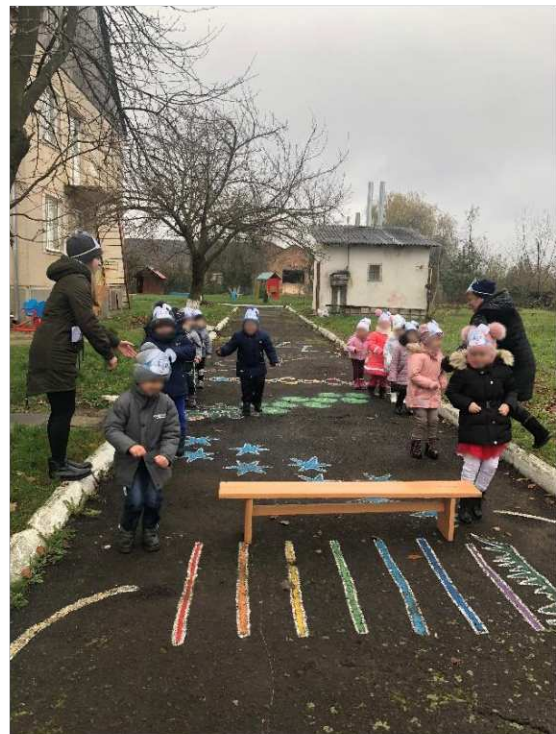
III. és IV. megálló képei (saját felvétel, 2020. 11. 20)