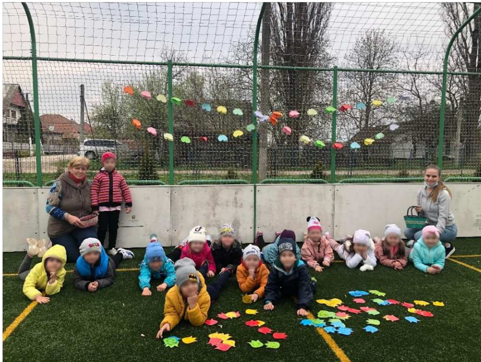
Saját felvétel (2021.04.21)

Végeredményben az elején említett visszacsatolás abban mutatkozott meg, hogy a gyerekek visszatudtak emlékezni, az előző évszakban bemutatott növényekre. Tudták a növény nevét és tulajdonságát. Emlékeztek a fenyőfára, arra, hogy ez egy örökzöld növény, tudták, hogy mi a termése. Aztán a csipkebokorra is emlékeztek, észrevették a változást rajta. Tudták azt is, hogy mi változott meg őszi óta és hogy ez miért történt. Fontos, hogy a gyerekeknek a tanösvényt játékosan mutassuk be, így jobban megjegyzik a fontos dolgokat. Ezért úgy gondolom, hogy az ilyen jellegű tanösvényeket óvodában is lehet és kell is alkalmazni.