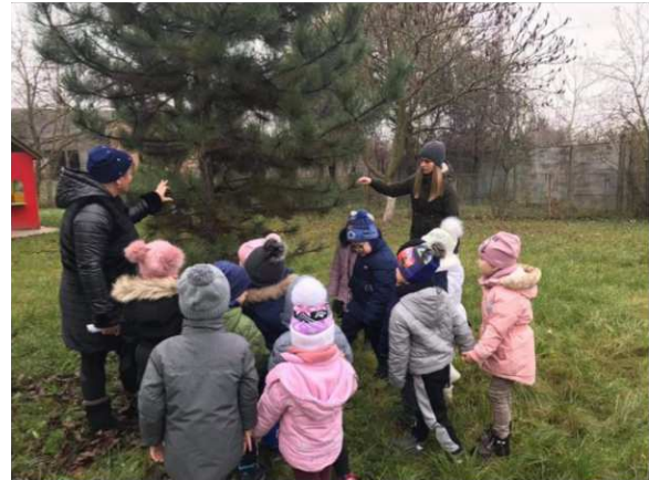
I. és II. megálló képei (2020. november 20.)