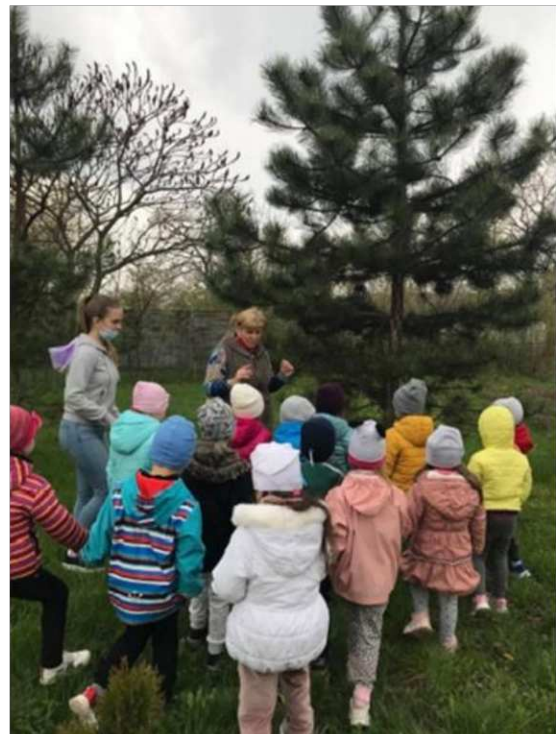
I. és II. megálló képei (saját felvétel, 2021.04.21)