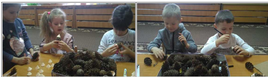
23. ábra. Barkácsolás természetes anyagból

Az uzsonnát követően a gyerekek mozaikos, kirakós játékokkal játszanak. Az érdeklődőkkel termésekből barkácsolunk különböző figurákat, vigyázva az eszközök rendeltetésének megfelelő használatára a baleset megelőzése érdekében (23. ábra). Ezáltal fejleszteni képességüket, türelmüket, figyelmüket, fantáziájukat és esztétikai érzéküket. Beszélni a gyerekeknek arról, hogy régen a gyerekek olyan játékokkal játszottak, amit a felnőttek vagy saját maguk készítettek el. A játékok alapanyagát a természetből, a környezeti sétán gyűjtöttük.