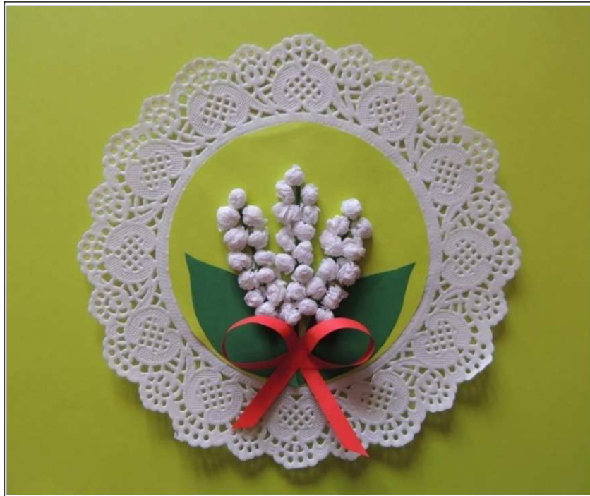
4. ábra. Kép készítése papírgyűrűssel (saját készítés)

Azon túl, hogy nagyon érdekes elfoglaltság, fejleszti a kreativitást, a finommotoros készségeket, türelmet, kitartást, kézügyességet, fantáziát. Megmozgatja mindkét agyféltekét, ami nagyban hozzájárul az intelligencia fejlesztéséhez.