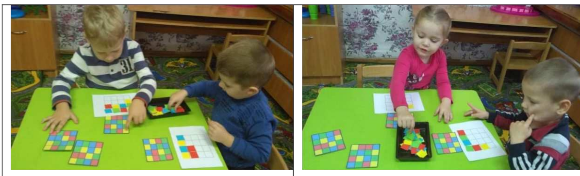
34. ábra. Memóriajáték színes táblákkal

Játékleírása: gyermek feladata, hogy a kiválasztott kártya alapján színes kis négyzetekkel ki kell tölteni az üres 4 \times 4 -s alaplapot. Ha sikerült kirakni a sorrendet, új kártyát választhatnak a játékosok. A gyerekeknek tudni kell megnevezni és megmutatni az alaplapon a sorokat, oszlopokat. Sorszámok gyakorlása az oszlopok és sorok megadott négyzeteinek megkeresésével (szín, irányultság; téri elhelyezkedés) (34. ábra).