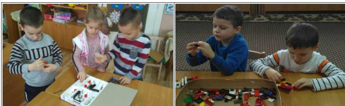
33. ábra. Legózás a reggeli órákban

A gyerekek szabadon játszanak, legóznak, míg megérkeznek a többiek (33. ábra).