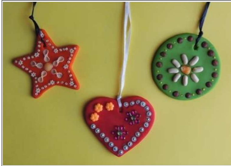
11. ábra. Gyurma készítmények tésztával, természettel és gyöngyökkel díszítve (saját készítés)