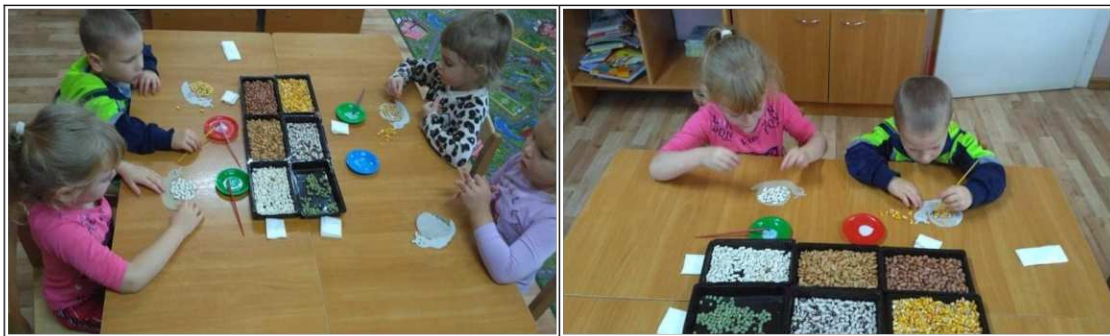
35. ábra. Csigaház díszítése termésekkel

Ismertetem a gyerekekkel a munka menetét, megismételjük a ragasztó használatának szabályait. Megemlítem, hogy a termések használatakor több ragasztóra lesz szükségünk, mint máskor. Ezt követően hozzá látnak a munkához. A gyerekek önállóan munkálkodnak, szükség szerint segítséget nyújtok (35. ábra). Mikor elfáradnak, tornapercet tartunk, egy ismert csigás mondóka szövegére (17. táblázat).