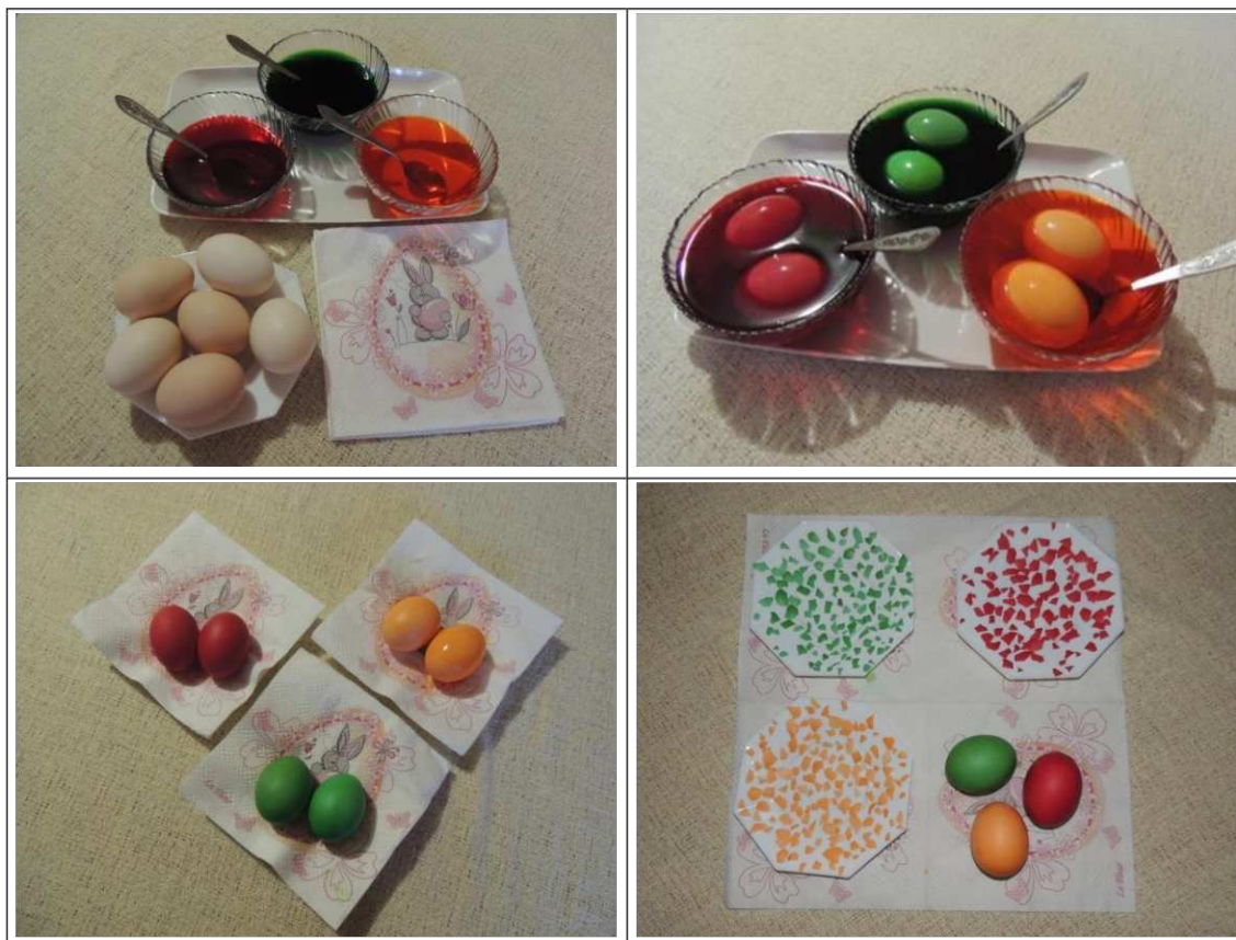
1. ábra. Mozaik tojás készítésének folyamata