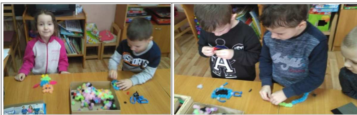
21. ábra. Kézügyesség fejlesztése a reggeli órákban

A gyerekek a reggeli órákban szabadon játszanak a szőnyegen, a megfigyelésem alatt. A nem játsszó gyerekeket igyekszek bevonni, a mindenki számára közkedvelt tevékenységek elvégzésébe, vár építésbe, legózásba, különböző mozaik játékok kirakásába (21. ábra). Miközben rendezgetik a különböző méretű, színű és formájú elemeket sok más mellett fejlődik a kézügyességük is. Közben csoportosítanak különböző szempontok alapján, ami elősegíti a matematikai készségek fejlődését.