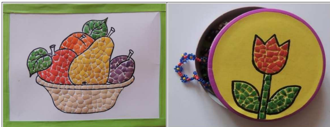
15. ábra. Festéssel kiegészített képek tojánhéjből (saját készítés)

Vízfestékkel vagy temperával is gyönyörű színeket varázsolhatunk. Ebben az esetben azonban előbb készítsük el a tojánhéjből a kívánt tárgyat, majd miután már fölragasztottuk és hagytuk megszáradni, csak akkor színezzük be. Egy kevés festéket felviszünk a mozaikrész felületére, majd ecset segítségével befestjük azt. Hagyjuk, hogy a gyerekek tetszés szerint válaszhatnak, használjanak színeket (színek felismerése, ismert színek megnevezése) (15. ábra).