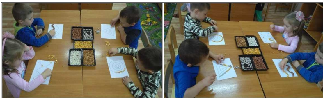
36. ábra. Mintavonal nyomkövetése termékekkel

Feladat: A gyerekek megkapják a lapra előrajzolt mintát. Termékekkel (málé, paszuly) nyomon követni a minta vonalát. Ezt tehetik kézzel vagy csipesszel. Kirakhatnak fantáziájukra bízva periódus sorrendet is (36. ábra).