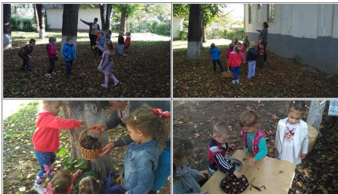
19. ábra. Kirándulás a természetben: Termékek gyűjtése

Öltözködést követően párban felsorakozunk. Séta közben énekeljük a „Sárgul már” című dalocskát. Az erdőszet területén megnézzük, megismerjük a fákat, bokrokat, virágokat. Megfigyeljük a színük, formájuk alapján. Becsukott szemmel figyelünk a madarak hangjára, megpróbáljuk kiszűrni a természet hangját a különböző környezeti zajok közül. Mókus lesre hívom a gyerekeket, ahol szép csendbe figyeljük a fák lombjait, odút keresve annak reményében, hogy előbukkan egy ügyesen rejtőzködő mókuska. Az avarban süni rejtekhelyet keresünk, hogy megfigyeljük, hogyan készülődik a télre.