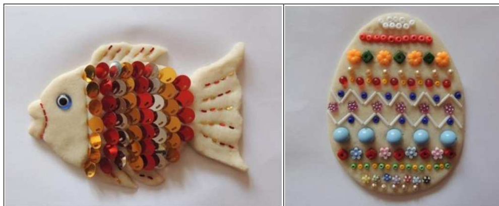
13. ábra. Díszítő elemek felhasználási lehetőségei (saját készítés)

díszítőérzék fejleszthető, hanem elősegíti az írás –és iskola előkészítés munkáját is (12 – 13. ábra).