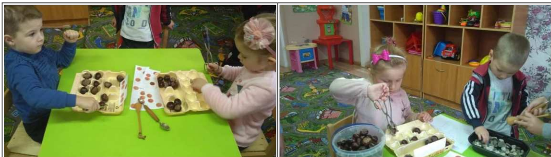
20. ábra. Gesztenyés kirakó

Segédeszköz: kanál, csipesz, feladatkártya. Újrahasznosított anyagok felhasználása: tojástartó. Természetes anyagok: gesztenye.