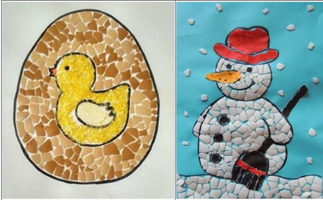
14. ábra. Tojánhéjmozaik technika alkalmazása (saját készítés)

Vízfestékkel vagy temperával is gyönyörű színeket varázsolhatunk. Ebben az esetben azonban előbb készítsük el a tojánhéjből a kívánt tárgyat, majd miután már fölragasztottuk és hagytuk megszáradni, csak akkor színezzük be. Egy kevés festéket felviszünk a mozaikrész felületére, majd ecset segítségével befestjük azt. Hagyjuk, hogy a gyerekek tetszés szerint válaszhatnak, használjanak színeket (színek felismerése, ismert színek megnevezése) (15. ábra).