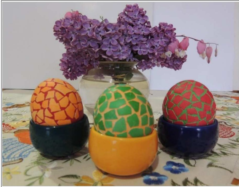
2. ábra. Az elkészült mozaik tojások