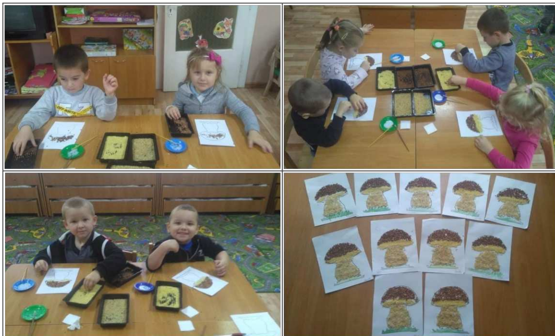
29. ábra. Gomba készítése termésből

munkához. Ismertetem őket a munka menetével, hogy milyen sorrendbe kell, hogy haladjanak (a kívánt felület ragasztóval való megkenése; a kiválasztott terméssel való beszórása; a felesleges termés eltávolítása). Felhívom a figyelmüket, hogy egyszerre csak egy termést használjanak, különben összekeverednek, és nem lesz kivehető a mozaik kép (29.ábra).