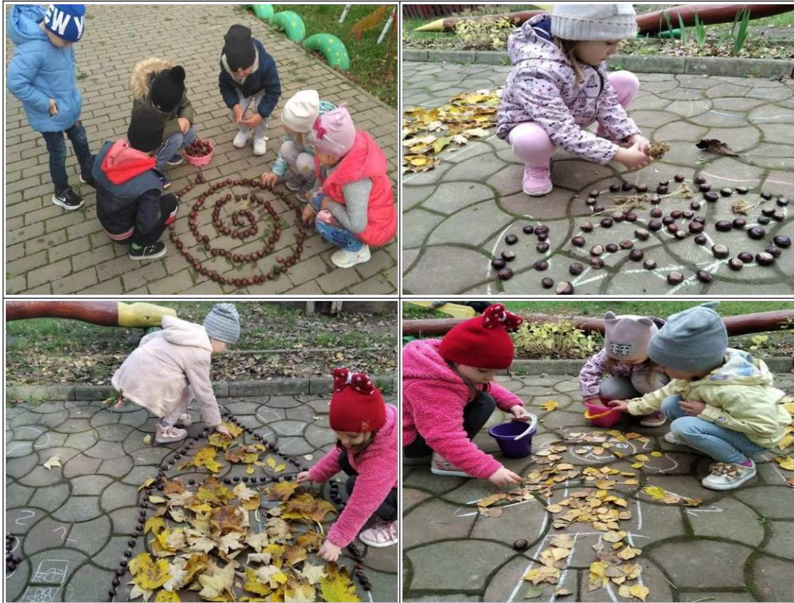
31. ábra. Termékek felhasználása udvar mozaik készítése során