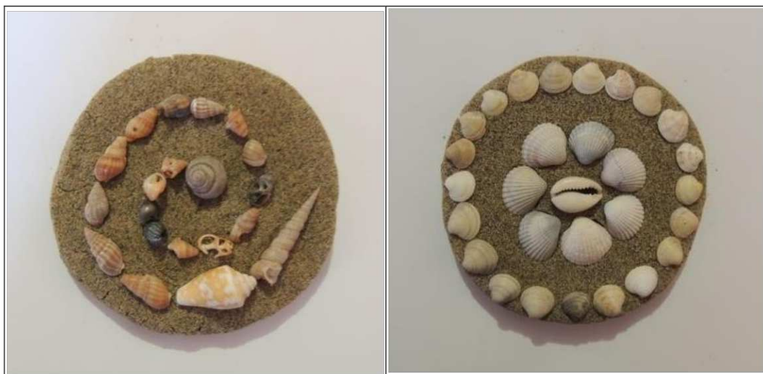
2. ábra. Kagylórakás homokgyurmába (saját készítés)

Munka közben olyan képességek fejlődnek, alakulnak ki, mint a megfigyelés és