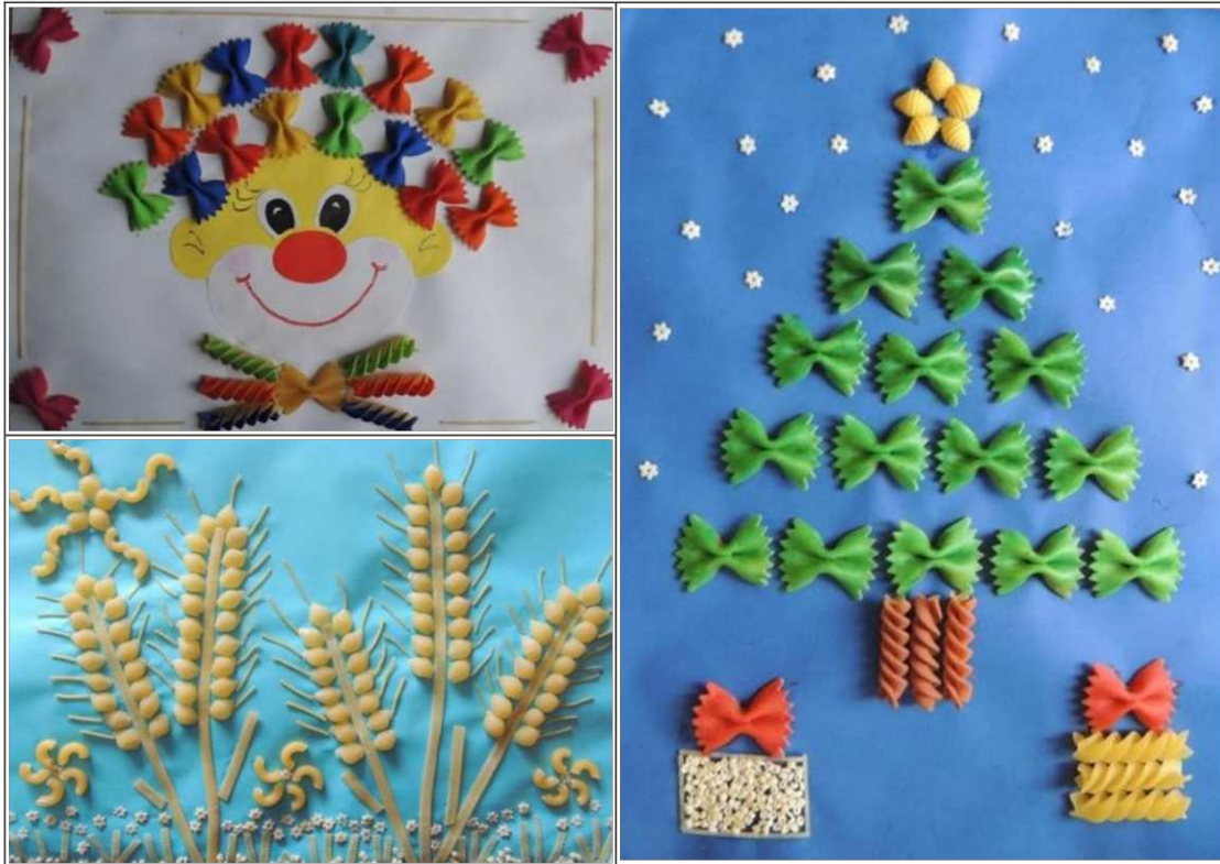
9. ábra. Tésztából készült képek mintái (saját készítés)

Hasonló technikai eljárás alapján készíthetünk képeket tésztából is. Ehhez szükség van különböző formájú száraz tésztákra, amit kedvük szerint kombinálhatnak, variálhatnak alkotásaik közben a gyerekek. Az elkészült művek festhetőek, így még színesebbé, érdekesebbé tehetik munkájukat (9.ábra).