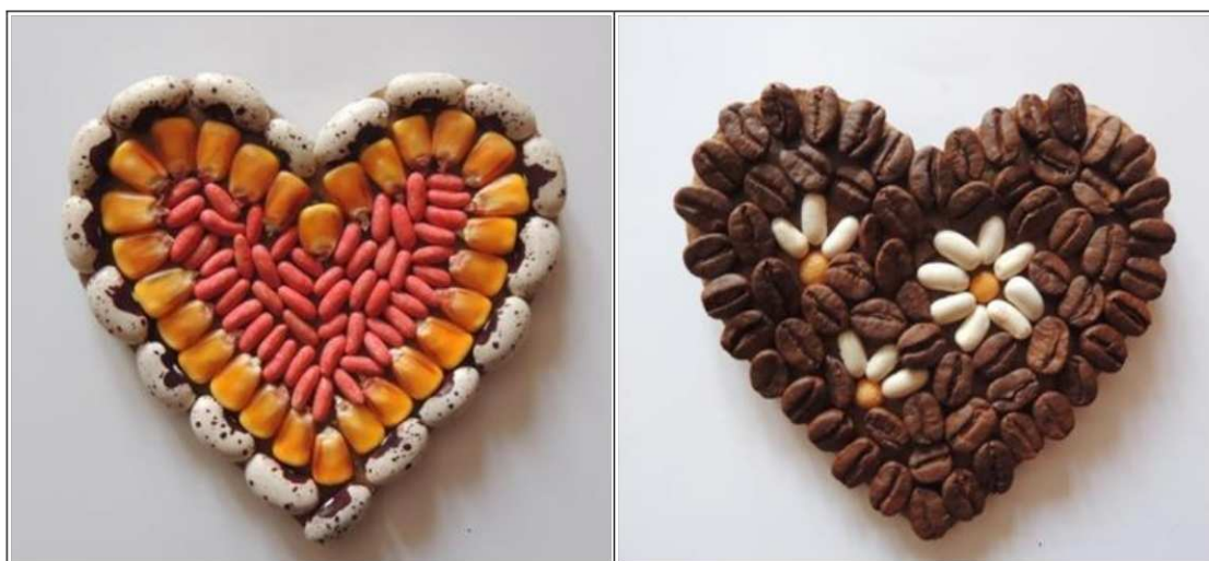
6. ábra. Mozaikkép készítése termésekből 2 (saját készítés)

Erre a célra erős papírt kell használnunk alapnak, mivel a ragasztó a vékony papírt átáztatja, így az könnyen átszakadhat, vagy hullámossá válhat használatkor. Azok a termések, magok ragaszthatók jól, amelyeknek valamelyik fele lapos.