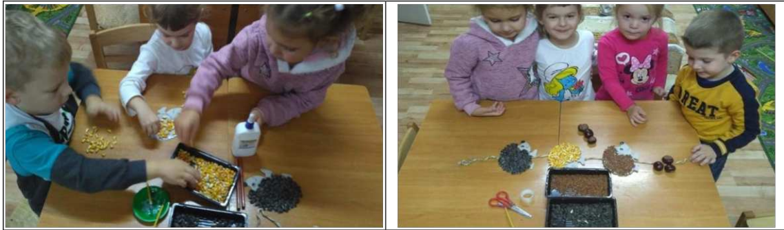
32. ábra. Sünös ajtódísz készítése termésekből

A tevékenység után rendet rakunk és elpakoljuk az eszközöket. A szülők, érkezésekor a gyerekek elköszönnek és hazamennek.