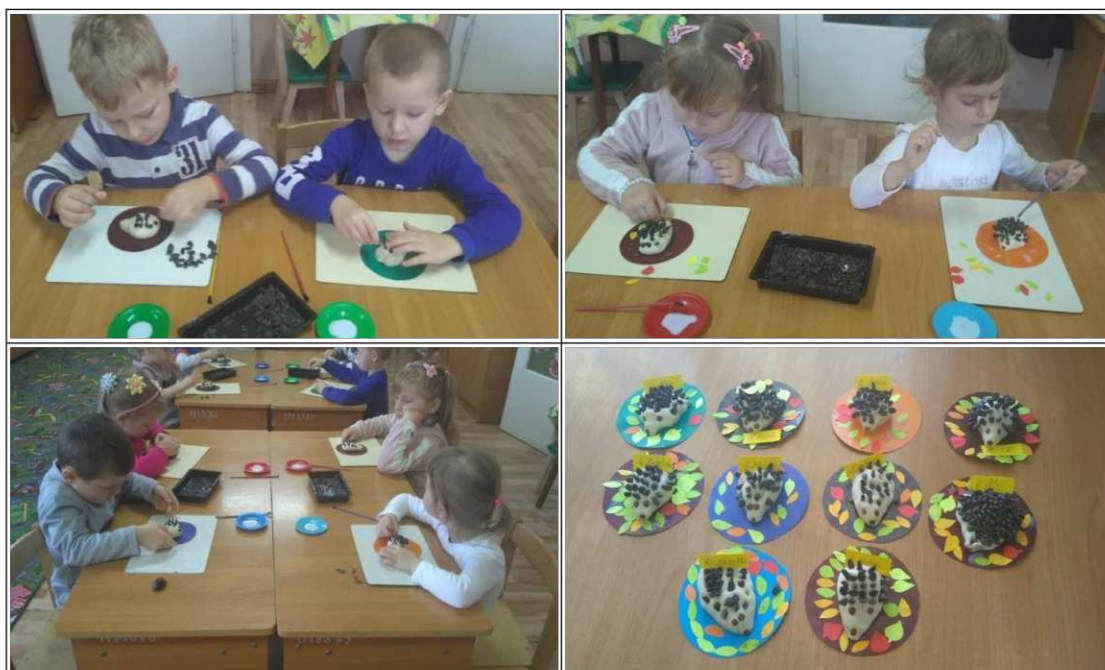
26. ábra. Süni készítése só-liszt gyurmából

A gyerekek hozzálátnak a munkához, önállóan dolgoznak. Ha kérdés vagy nehézség merül fel munkavégzés közben segítséget nyújtok számukra. A háttérben halk zene szól.