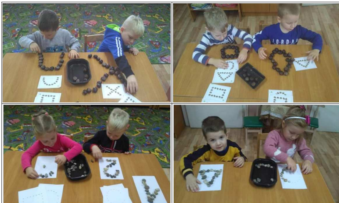
27. ábra. Didaktikai játék: Készíts ugyanilyet

A játék menete: A gyerekek kiválasztanak egy kártyát, ami egy számjegyet vagy alakzatot ábrázol. A feladat a következő: az előrajzolt mintavonal alapján kövek vagy gesztenye segítségével utánozzák le a sormintát, ezáltal is vizualizálják a számjegyeket, alakzatokat (27. ábra). Ezáltal fejlődik kézügyességük, alkotótevékenységük, szem-kéz koordinációjuk és koncentrációképességük.