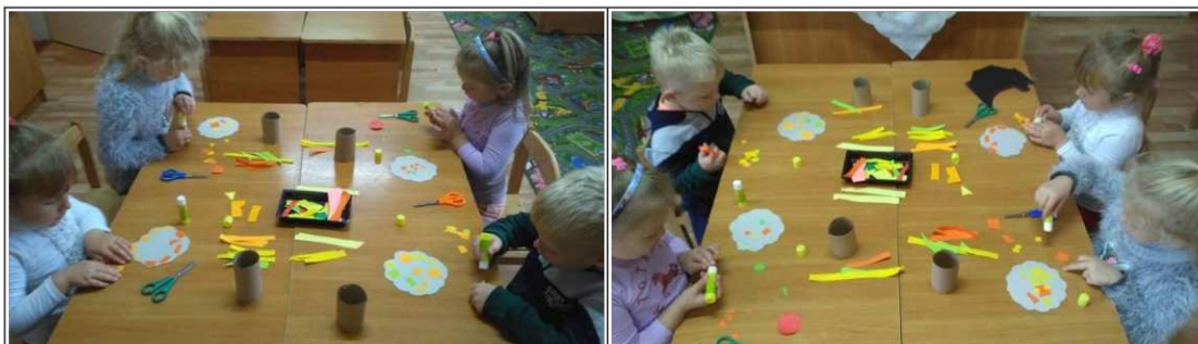
18. ábra. Őszi fa készítése

A háttérben halk zene szól Gryllus Vilmostól a „Hallgatag erdő” című dal.