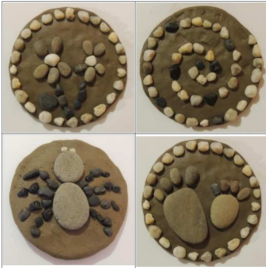
1. ábra. Agyagba nyomott kavicsselemek (saját készítés)

gyurmába illesztjük, nyomkodjuk a különféle természetes színű kavicsokat, kagylókat (1-2. ábra).