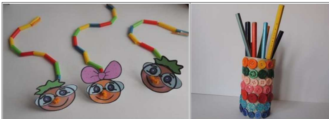
16. ábra. Műanyag felhasználási lehetőségei (saját készítés)

kézrel végzett tevékenységekre. Ezáltal új ismeretekre tesznek szert, és így a kézimunka sokféle anyagával, eszközével, tulajdonságaival ismerkedhetnek meg (16 – 17. ábra).