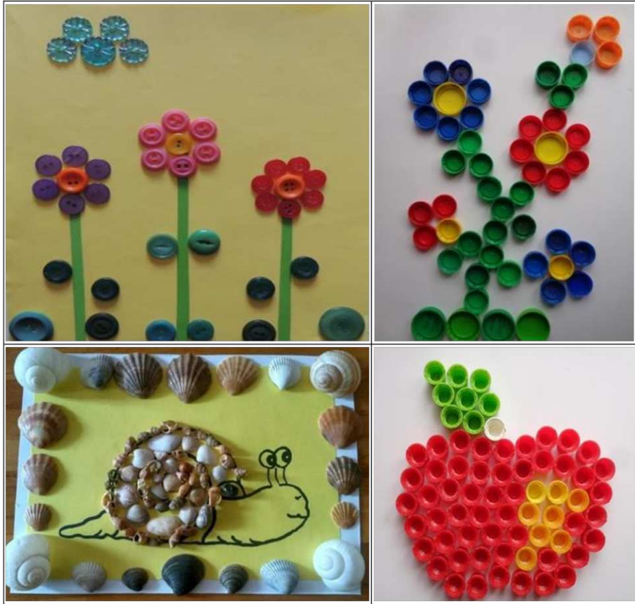
17. ábra. Képalakítás vegyes anyagokból (saját készítés)