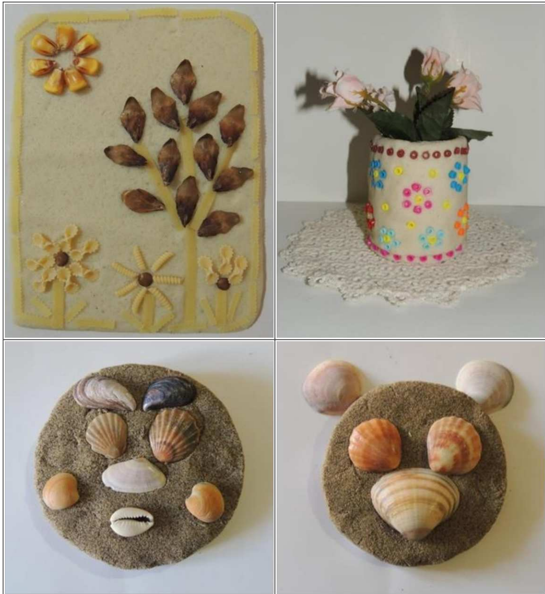
10. ábra. Só - és homok- gyurmából készített tárgyak (saját készítés)

bármilyen új anyagot-, műanyagot, gyöngyöt (10 – 11. ábra). Kézügyesség fejlesztő hatása igen nagy (formaérzék, térészlelés, taktilis érzék fejlesztése, felületen való tájékozódás, szélen, közepen). Munka közben megtörténik a felület tudatos rendezése (elemek szabályossága, ritmus), az alaptechnikák kombinált alkalmazásának és manuális képességeiknek fejlesztése (10. ábra).