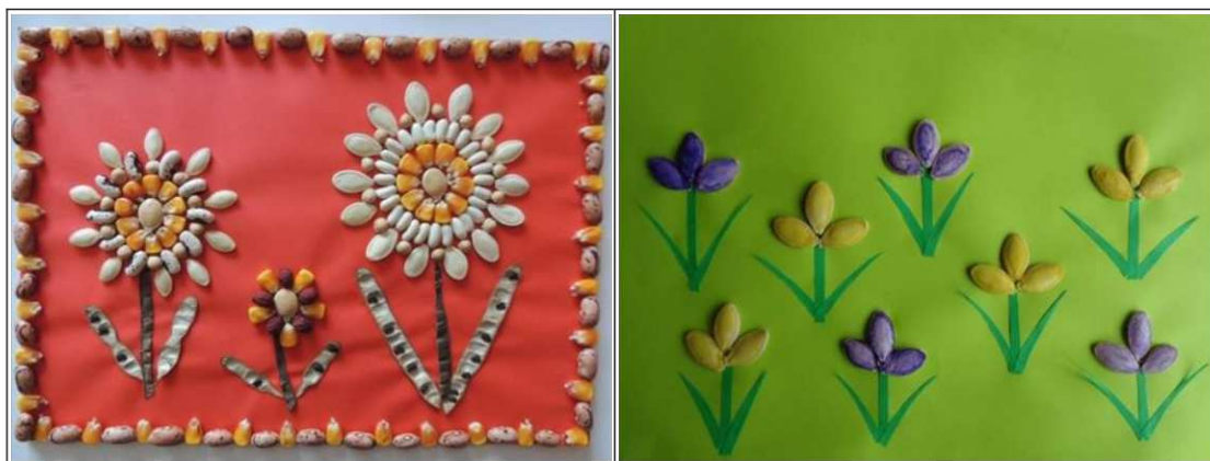
5. ábra. Mozaikkép készítése termésekből 1 (saját készítés)

Az egész év folyamán alkalom adódik a sétákon, kirándulásokon a különféle természetes anyagok gyűjtésére, de az ősz igazán alkalmas évszak erre a célra. Ezekből a kincsekből sokféle alkotást készíthetünk a gyerekekkel. Használhatunk apró magokat, terményeket, melyekkel kirakhatunk különböző alakzatokat (5. ábra). Ez a technikai eljárás nagyon alkalmas az alkotó gondolkodás képességének fejlesztésére, tapasztalatuk bővítésére, természetesen a gyerekek életkorához igazodva. Munka közben nem csak a kreativitásuk fejlesztése történik, hanem a koncentráció képességük is.