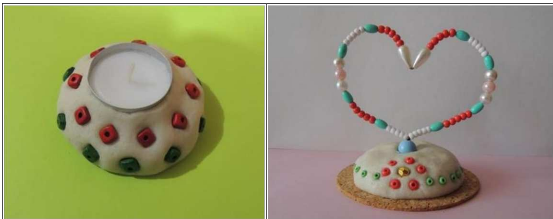
12. ábra. Gyöngyökkel díszített tárgyak (saját készítés)

Az óvodás gyerek számára a gyöngyökkel való találkozás mindig örömet szerez. A színek, formák, méretek elvarázsolják a gyerekeket, és örömet szerez számukra mindenféle tevékenység, amit az apró szemekkel végezhetnek. Különböző sormintákat (azonos forma és szín váltakozása ritmusosan, 2 más-más forma és szín váltakozása a sorban, - 2 forma más- más szín és távolság váltakozása) rakhatnak ki, ami nagyon jól fejleszti a finom motorikus képességeket, szem-kéz koordinációt, monotonia tűrést, gondolkodást, és ez mind sikerélményhez juttatja őket.