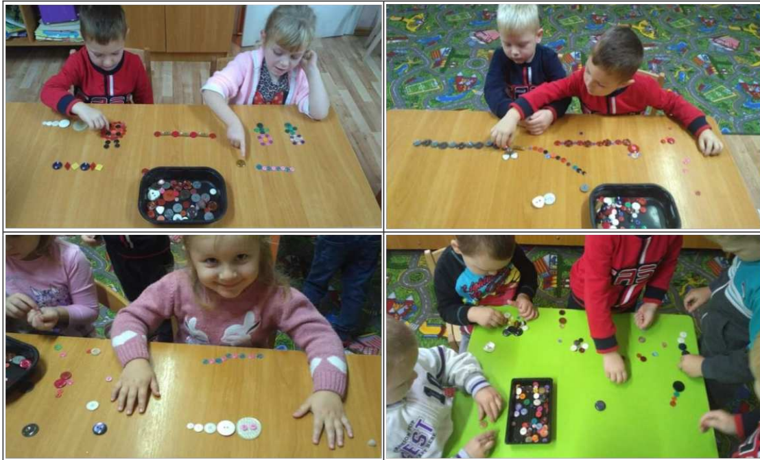
25. ábra. Gombos játék

Játékot segítő kérdések: „A két gomb közül szerinted melyik a nagyobb?”, „Tedd a gombokat méretük szerint növekvő sorrendbe. Ide tedd a legkisebbet, és mellé a többit sorban”, „Válogasd szét a gombokat színük szerint”, „Rakj ki váltakozó sormintát a piros és barna gombok segítségével”, „Melyik színű gombból van több? Kevesebb?”, „Rakj ki ugyanannyit”, „Melyik a legnagyobb? Melyik a legkisebb?”, „Válogasd szét a gombokat a lyukak száma szerint”.