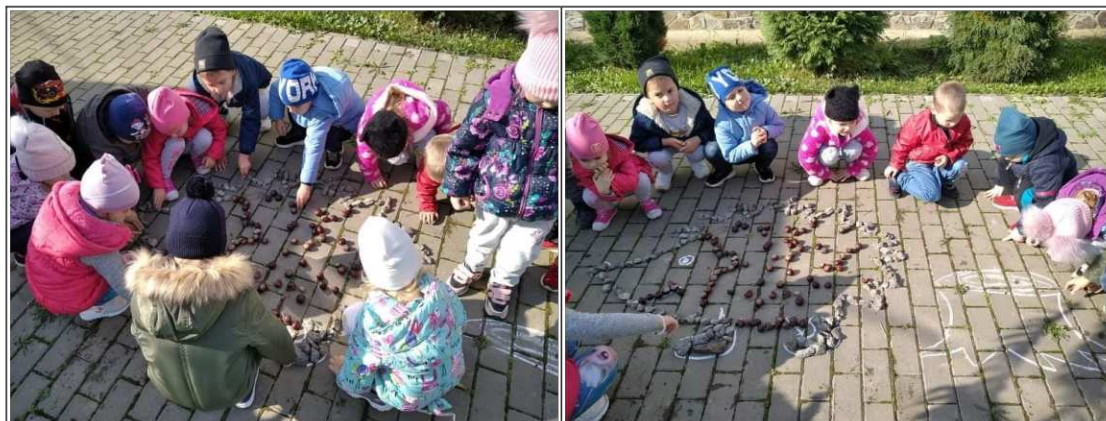
22. ábra. Udvar mozaik készítése: „Sün Balázs” című mese alapján

A sétát követően a „Sün Balázs” mese hatása alatt gesztenye és kövecske felhasználásával udvarmozaikot készítünk előrajzolt krétavonal alapján (22. ábra). Ezáltal fejleszteni fantáziájukat, vizuális látásukat, kézügyességüket.