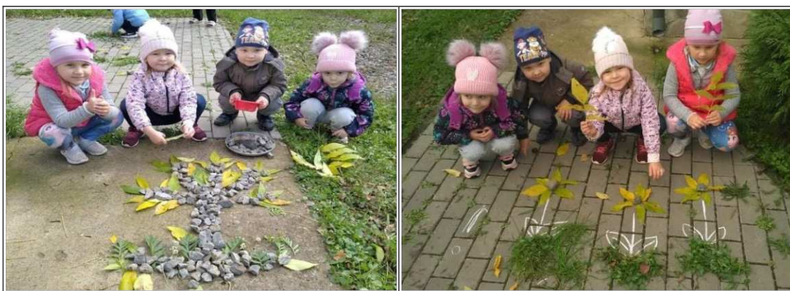
30. ábra. Őszi virág és fa kirakása természetes anyagokból

Megfigyelés. Ezt követően megfigyeljük a gyerekekkel az őszi virágokat a virágos kertben, tudni felsorolni a nevüket, a virágok színeit, megfigyelni a levél formáit. Tudni, hogy minden növénynek van szára, levele és gyökere. Megfigyelni a fák lombjait, a formájuk, színük, erezetük alapján. Megpróbálni találni két egyformát, miért lehetetlen ez? Hogyan csoportosíthatjuk a leveleket, miért gyűjtjük őket? Felhívom a gyerekek figyelmét a természet szépségére, az őszi levelek sokszínűségére.