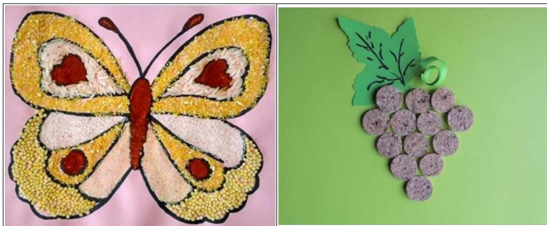
8. ábra. Parafadugóból készült szőlőfürt (saját készítés)

Használhatunk karikára vágott parafa dugót is (8. ábra), hiszen ez is természetes anyagból készül, és könnyen kezelhető. Fontos a jó ragasztó megválasztása, ami esetleg lerövidíti a száradási időt, és lehetőséget biztosít a módosításra alkotás közben.