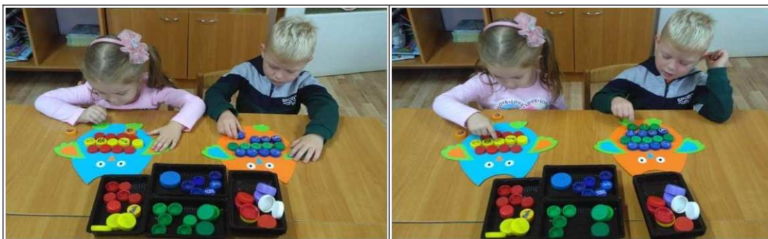
24. ábra. Baglyos játék

Tippi, topi, topp, topp, topp. (végén taps, taps, taps)