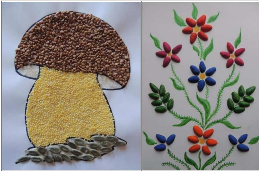
7. ábra. Mozaikkép készítése termésekből 3 (saját készítés)

megbeszéltek alapján. A tervezés közben az összes termésfélét kirakjuk a munkaasztalra, és lehetőséget biztosítunk a gyerekeknek számára, hogy szabadon válogathassanak az alapanyagok között, önállóan tervezzenek sordíszeket, díszítéseket. Miután megbeszélték, hogy mi is az általuk kirakott kompozíció, hozzákezdhetnek a ragasztáshoz. Fejlődik ritmus érzékük (térviszonyok, irányok, síkbeli tájékozódás stb.), rész-egész kép kiegészítése, tárgyak színek szerinti válogatása.