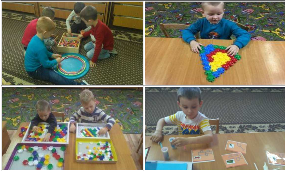
28. ábra. Mozaik játékok a reggeli órákban