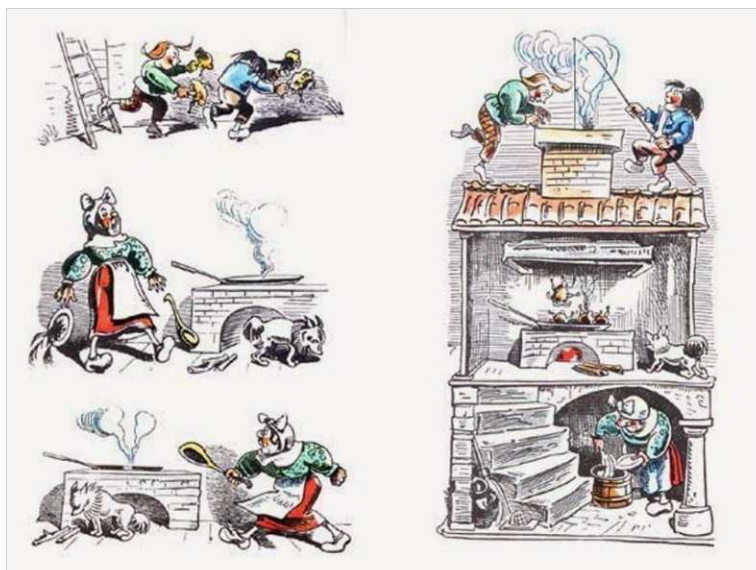
8. ábra. Wilhelm Busch készítésével Max és Móric humoros képregény részlete

használta ki a képregény kínálta lehetőségeket: a gúnyrajzokat helyzetkomikummal, gegekkel kombinálta. Legsikeresebb rajzsorozata, a Max és Móric 1865-ben jelent meg. 23