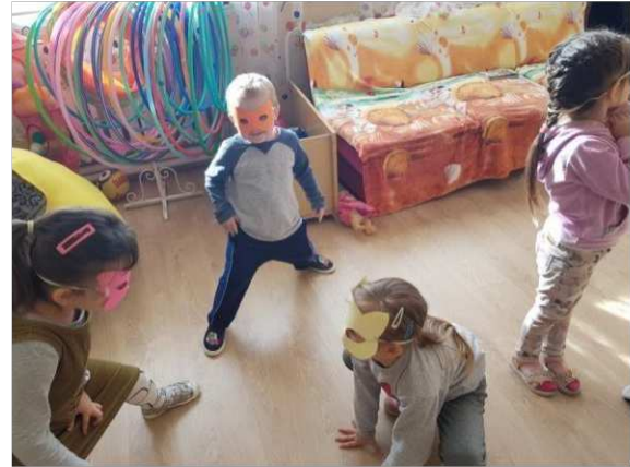
15. ábra. Az összecsapás

Az otthon már előre elkészített szuperhős maszkokat szétosztottam a csoportba, a gyerekek önállóan választhattak a tetszés szerint a maszkok közül. Majd szerepjáték keretén belül eljátszottunk egy történetet, amit úgy kezdtünk, hogy kettéosztottuk a csoportot, a „jó és a gonosz” szereplőire. A lányok vállalkoztak a jó csapatban való részvételre, a fiúk pedig a gonoszok táborába szerettek volna tartozni.