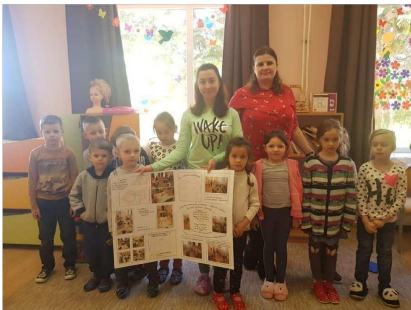
24. ábra, Csoportkép a Tégvási óvodában