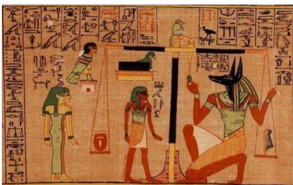
2. ábra. Halottak Könyve, Ozirisz

barlangfestmény. A barlangrajzok alapvető jellemzője, hogy az állati alakokat – többnyire bőlényeket, vadlovakat, szarvasokat - a legjellemzőbb nézetből, oldalirányból ábrázolták, és mozdulat közben. Nem nyújtanak pontos részletekbe menő betekintést csupán feltárják a lényeket egy leegyszerűsített formában. Híján vannak a tudatos kompozíciónak valamint a szerkesztésnek. A színvilágot vörös, sárga, fekete színeket alkották; a porrá zúzott anyagokat vízzel, zsírral, vérral elkeverve vitték fel a falra. 9