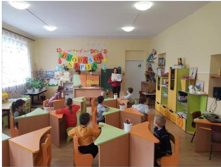
11. ábra. Képregények bemutatása

Miután megbeszéltük hogyan is néznek ki a képregények, és szemügyre vettük őket kezdődött a rajzfoglalkozás. Megmutattam és elmagyaráztam a kinyomtatott képregénykonkákat, hogy mi is a gyerekek feladata. Felolvastam nekik melyik képregény kocka alatt milyen szöveg áll, és hogy ezáltal rávezetés segítségével milyen rajzot kell elkészíteniük, hogy elkészüljön a saját képregény történet.