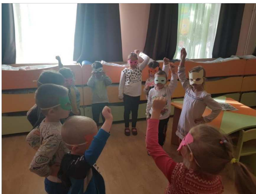
20. ábra. Az összecsapás

A szerepjátékra kitalált mesés történet tartalma, hogy a jó szuperhősök szeretnének megtanulni olvasni a képregények által, a gonosz szuperhősök pedig szeretnék őket ebben megakadályozni, mert ők csak játszani szeretnének, és ezáltal zavarni próbálnak a többieknek, hogy ők se olvassanak, hanem inkább csak játszanak.