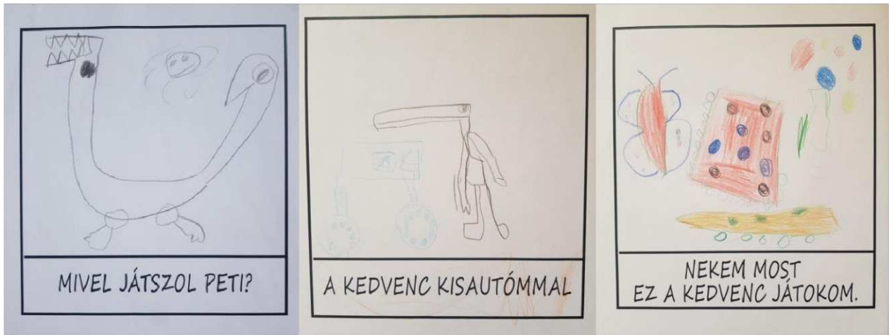
13. ábra. É.D. rajza, 4 éves kisfiú

Az elkészült rajzok után, körbe ültünk a csoportszobában és közösen megbeszéltük ki ismeri a szuperhősöket, mit tud róluk. Majd ismereteik bővítésével beszélgettünk arról, hogy milyen szuperképességekkel rendelkeznek a szuperhősök, kik harcolnak a jó érdekében, és kik a gonosztevők egy szuperhős történetben, milyen jelmezdarabok tartoznak egy szuperhős kinézetéhez.