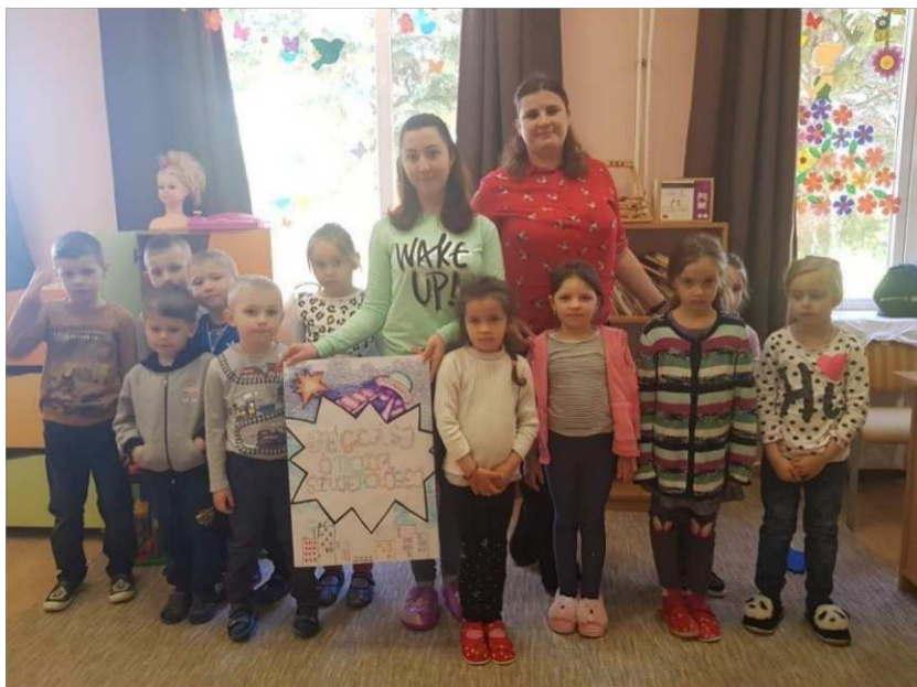
23. ábra, Csoportkép a Tégvási óvodában az elkészült képregénnyel