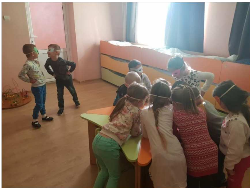
19. ábra. Szerepjáték

A szerepjátékra kitalált mesés történet tartalma, hogy a jó szuperhősök szeretnének megtanulni olvasni a képregények által, a gonosz szuperhősök pedig szeretnék őket ebben megakadályozni, mert ők csak játszani szeretnének, és ezáltal zavarni próbálnak a többieknek, hogy ők se olvassanak, hanem inkább csak játszanak.