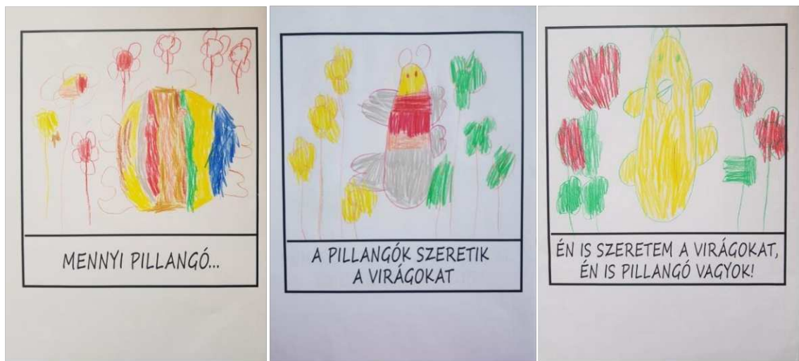
18. ábra. K.V. rajza. 5 éves kislány. Pillangót és virágokat ábrázol

Következő foglalkozást meseolvasással indítok, egy népmesét választottam, ami a jó és a gonoszról szól. Majd kérdéseket feltéve közösen megbeszéltük, hogyan értelmezik a mesét, mire emlékeznek belőle. Következő feladat előtt kettéosztottam a csoportot, mindenki önállóan eldönthette hová szeretne tartozni a történetben, amit szerepjáték keretein belül terveztünk meg: „a jó superhősök, vagy a gonosz superhősök” csapatába. Két bátor kisfiú jelentkezett a super gonoszok csapatába, a többiek a jó superhősök táborát erősítették.