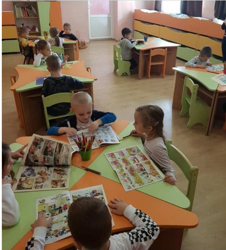
17. ábra. Képregények nézegetése

Miután a képregények vizsgálatát befejeztük áttérünk a rajzfoglalkozásra. Kiosztom és elmagyarázom a gyerekeknek mi is a feladat. A már meglévő képkockákba az adott szöveghez készítjük a rajzot, hogy elkészüljön a kép-történet. A gyerekek jól fogadták a feladatot, szívesen rajzoltak és színezték ki munkáikat.