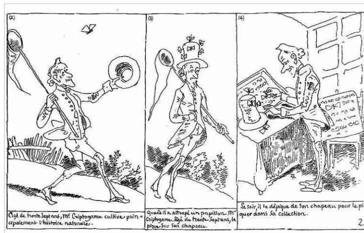
7. ábra. A svájci Rodolphe Töpffer 1830 környékén megjelent szkeccs-sorozatai

szöveg, mely inkább csak kiegészíti, összekapcsolja a képeket. Ernst Gombrich megállapítása szerint Töpffer új művészete engedte, hogy a hézagokat a közönség töltsse ki saját képzeletével. 19