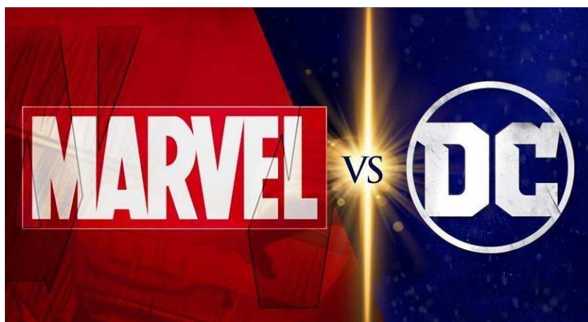
10. ábra. Marvel vs DC

DC vagy Marvel? Ez a kérdés merül fel minden egyes rajongónál. Mind a két képregénykiadó hasonló színvonalat képvisel. 85