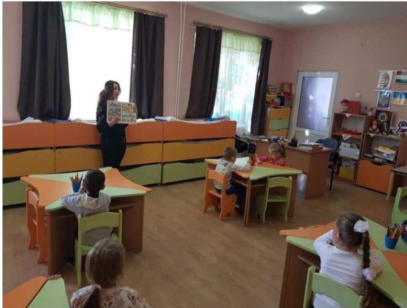
16. ábra. A képregények bemutatása

Bemutattam s elmagyaráztam a képregények kinézetét, külső borító alapján, és belső tulajdonságainak használatát. A képkockák segítségével haladunk, hogy megismerjük a történetszálakat. A szóbuborékokban helyezi el az író a párbeszédet, vagy épp az adott szereplő gondolatait, amit majd csak iskolás korban ismerünk meg, az olvasás elsajátításával.