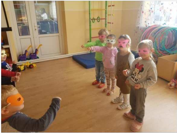
14. ábra. Szerepjáték