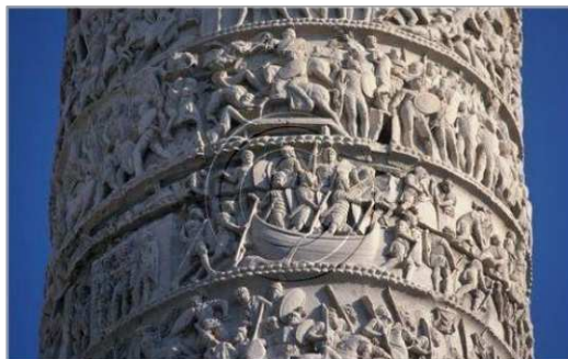
3. ábra. Traianus oszlopa

Ismert példa Traianus római császár oszlopa, ami a dáciai hadjáratnak állít emléket. Viszont eme oszlop domborművei még csak illusztrálnak egy történetet, mely ismeretlen volt az otthon maradottak számára: nem érthették volna meg az eseményeket csupán az ábrázolás alapján. 11