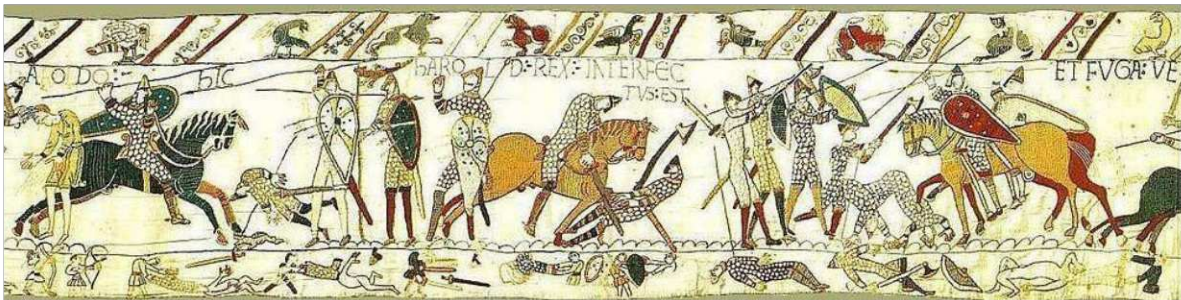
5. ábra. Bayeux-i kárpit

A Bayeux-kárpit a 11. század végén készült, és a William és Hastings-i csata 1066-os angliai partraszállását ábrázolja. Ez a képregényekben a leggyakrabban említett példa. Több mint 600 képen latin címeket szönek, hogy jobban megértsék a cselekményt.