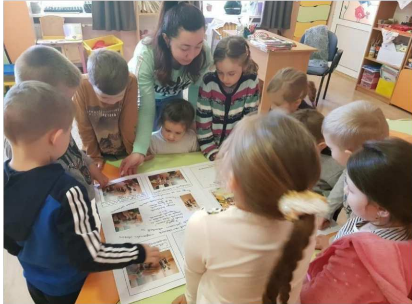
21. ábra. Képregénynézegetése