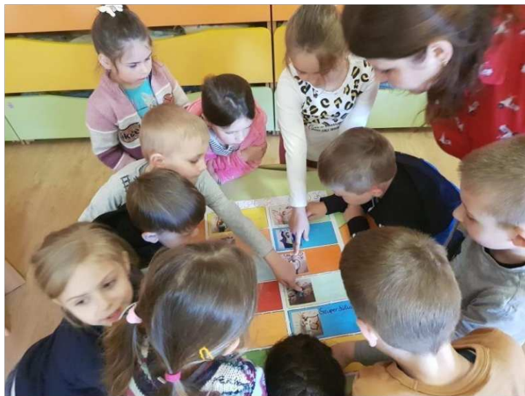
22. ábra. Szuper személyazonosság felderítése

Élménydús volt a Téglási óvodában való szakmai gyakorlat teljesítése. Véleményem szerint a foglalkozások a megfelelő módszertani követelmények szerint zajlottak le. A foglalkozások keretein belül sikerült létrehoznunk egy olyan mesés szuperhős történetet, amely segítségével eljátszhattunk egy szerepjátékot és életrekelthettük a képregények főszereplőit. Játékos formában ismerkedhettek meg képregény elkészítési folyamatával. A gyerekeknek egy új élményt adott, a foglalkozásokon örömmel és kíváncsisággal vettek részt. Számomra is nagy élmény volt a kicsikkel együtt dolgozva elérni a kitűzött feladatot.