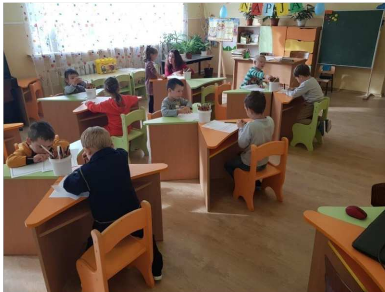
12. ábra. Rajzfoglalkozás

Miután megbeszéltük hogyan is néznek ki a képregények, és szemügyre vettük őket kezdődött a rajzfoglalkozás. Megmutattam és elmagyaráztam a kinyomtatott képregénykonkákat, hogy mi is a gyerekek feladata. Felolvastam nekik melyik képregény kocka alatt milyen szöveg áll, és hogy ezáltal rávezetés segítségével milyen rajzot kell elkészíteniük, hogy elkészüljön a saját képregény történet.