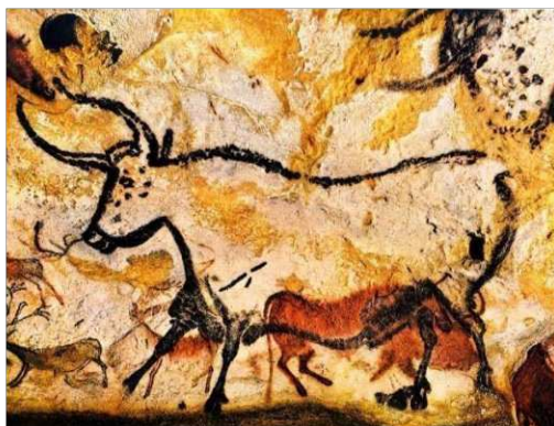
1. ábra. Bőlény ábrázolása a Lascaux-barlang falán

Az efféle művészeti alkotások eredete 30 000 évvel korábbra nyúlik vissza. A legnagyobb hírnek a barlangfestmények örvendenek; napjainkban mintegy 200 őskori falfestménnyel ellátott barlangot tartanak számon. Közülük a franciaországi Lascaux-barlang, valamint a spanyolországi Altamire-barlang nevezhető a legnépszerűbbnek.