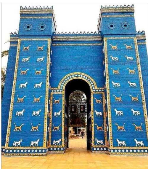
4. ábra. Istar-kapu

Számos alkotás odaveszett az idők folyamán, sokat a házak falára festettek. Habár Pompeji városa elpusztult a Vezúv miatt, éppen emiatt maradtak meg a legépebben a falfestmények. Sokszor látható mozaikdíszítés az épületeken. A mozaikművészet alkalmazott díszítő részeket (ornamentika), amik