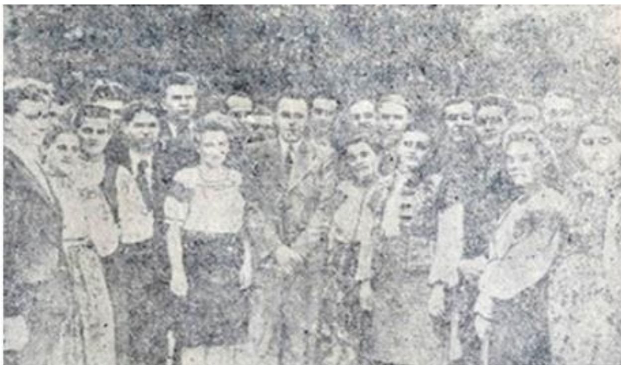
Forrás: «Закарпатська правда» 13 вересня 1946р.