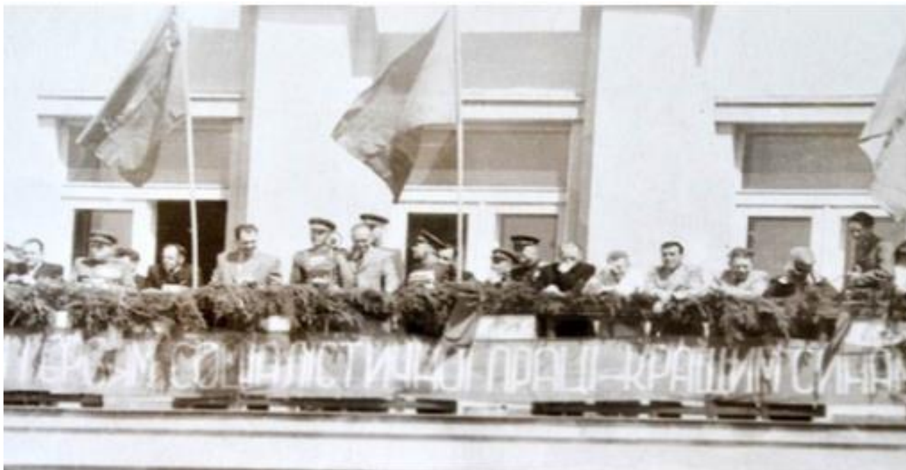
Forrás: «Закарпатська правда» 4 травня 1946 р.