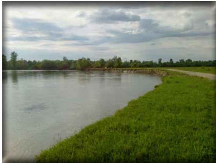
2. ábra. A 13. mintavételi pont partvonala a szakadóparttal

2008. április 29. – a 9., 10., 11., 12., 13. megfigyelési pontokon kézi kotróhálós módszerrel történő mintavételre került sor.