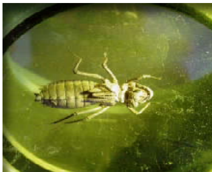
6. ábra. Ophiogomphus cecilia lárájának mikroszkópos képe