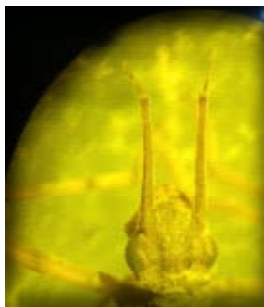
3. ábra. Agrion splendens lárva fejének és előtörének mikroszkópos képe (Hosszú csáptóize alapján jól elkülöníthető a hasonló felépítésű Caleopteryx virgatól )

Lárvái 30–35 mm hosszúak. Lábaik és a test színe sötét. A tracheakopoltyúlemezek harántsávok húzódnak. A csáp tóize hosszúra nyúlt, szőrös vagy csupasz. Az alsó ajak középlemezének kivágása széles rombusz alakú, kb. 3 mm hosszú, mint a fej szélessége vagy annál valamivel hosszabb. Az alsó ajak keskenyebb és rövidebb. A lábakon és a tracheakopoltyúk végein nincsenek szőrök. A kopoltyúlemezek feltűnően különböznek egymástól, a középső lemez felével rövidebb, mint a szélsők. A 3 lemez mindegyikén 3-3, nagyságban és színben változó sötét folt van (Dr. Steinmann H. 1964).