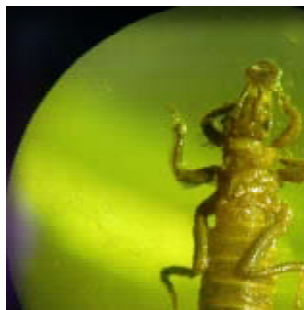
7. ábra. Gomphus flavipes lárájának mikroszkópos képe

A lárvák potroha széles vagy aránylag széles a potroh végén lévő 5 tüske, illetve az anális piramis felé fokozatosan keskenyedik, lapos, a hátoldala kissé kidomborodó. Az alsó ajak középlemeze széles, lapos, sima, belső felszínén szőrök, serték, tüskék nincsenek. A lábak rövidek, a 3. lábpár vége kinyújtott állapotban nem éri el a potroh végét. Az alsó ajak oldallemezének belső pereme 2–5 fogú, a véghorog töve keskeny. A potroh végefelé kihegyesedő. A 9. potrohszelvény megnyúlt, keskeny, hossza 2,6–3 mm, szélessége 2,7–3 mm. A lárva 31–35 mm (Dr. Steinmann H. 1964).