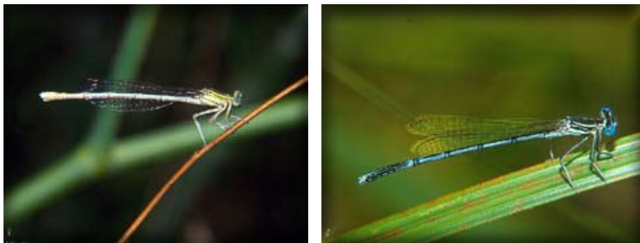
5. ábra. Platycnemis pennipes nőstény és hím imágója

A megfelelő pár felismerésében a hím jellegzetes udvarlási „násztáncot” lejt a nőstény előtt, melyben a faji bélyegeket hordozó, kiszélesedő elülső lábának fontos szerep jut.