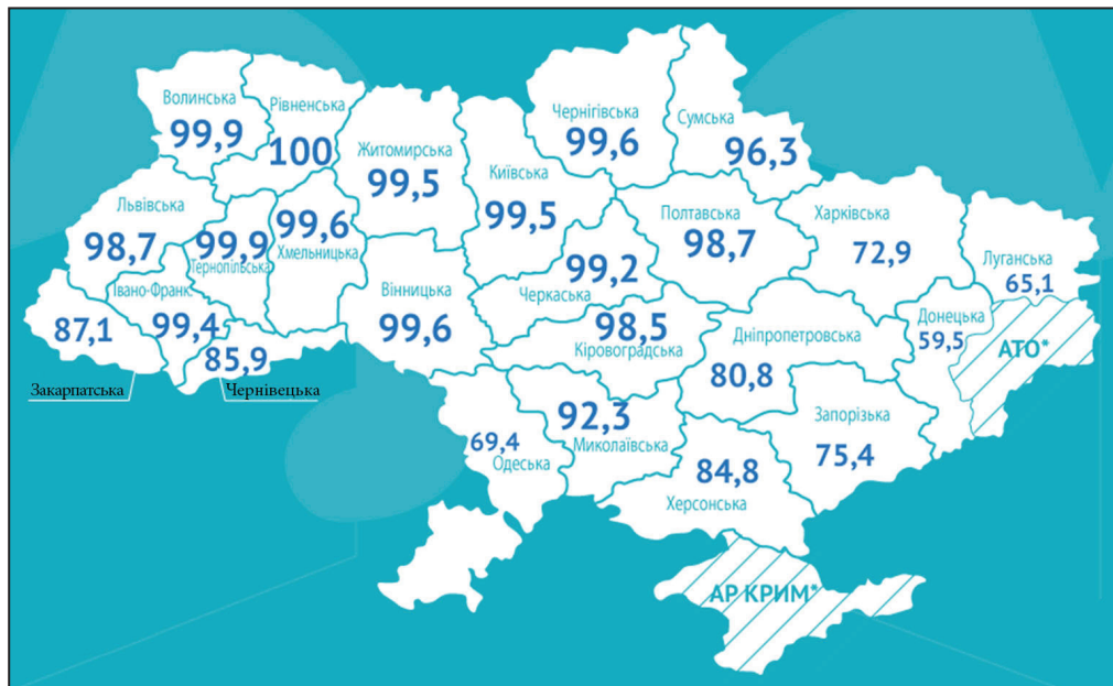
2. térkép. Az ukrán tannyelvű iskolák aránya Ukrajna megyéiben (2017) 45

szerint az fog minden problémát megoldani Ukrajnában, ha az országban mindenki ukránul fog érezni és beszélni. Jól jellemzi az ezzel kapcsolatos várakozásokat a 2015. július 1-jén Kijevben A nyelv egyesít minket címmel tartott fórumon elfogadott kiáltvány, mely szerint „az ukrán nyelvnek egyesítő tényezővé kell válnia Ukrajna valamennyi állampolgára számára, [...] az államnyelv egységesítő és nemzetalkotó tényező, mely nélkül nem létezhet sem ukrán demokratikus állam, sem az ukránok modern politikai identitása”. 43