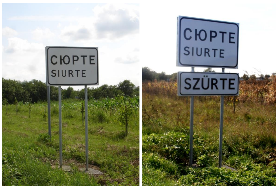
9. kép 7 és 10. kép

Némileg más, de szintén eredményes utat járt be az Ungvárhoz közeli Szürte község magyar közössége. A település határában itt is olyan táblát állított a közútkezelő, melyen csak a falu ukrán neve ( Сюрте ), illetve annak latin betűkkel átírt, ám a helyi magyar nyelvhasználattal nem egyező változata ( Siurte ) szerepelt (9. kép). Az önkormányzat azonban saját kezébe vette a probléma megoldását, és ugyanarra a táblára felszerelt egy újabbat, melyen már a község hagyományos magyar neve ( Szürte ) áll (10. kép).