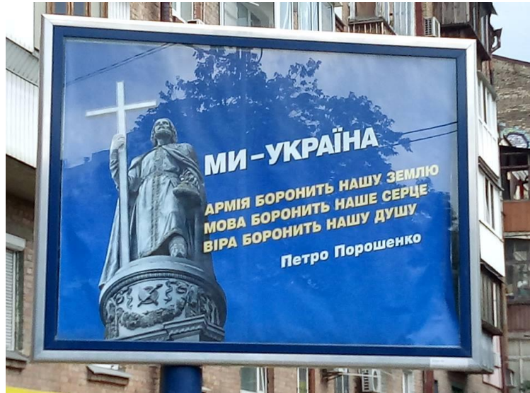
1. ábra. Petro Porosenko hivatalban lévő államelnök választási plakátja a 2019. március 31-i elnökválasztás első fordulójára

Ám miközben a felszínen úgy tűnik, hogy az ukrán nyelvpolitika fő célja az ukrán politikai nemzet kiépítése, az ukrán nemzettudat megerősítése, a nemzetállam kialakítása, valójában a harc a politikai hatalomért és a gazdasági erőforrásokért folyik az ország két domináns csoportja között, melyek közül az egyik az ukrán, a másik az orosz nyelvet tűzi zászlajára. Nyelv és hatalom kérdése tehát ma is véres konfliktusok és ádáz politikai küzdelmek része, különösen ott, ahol „az államhatárok és a nyelvterületek nem esnek egybe”.