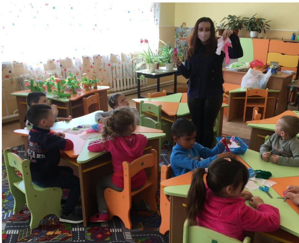
24. sz. fotó: Az anyag nyuszi és az alapanyagok bemutatása