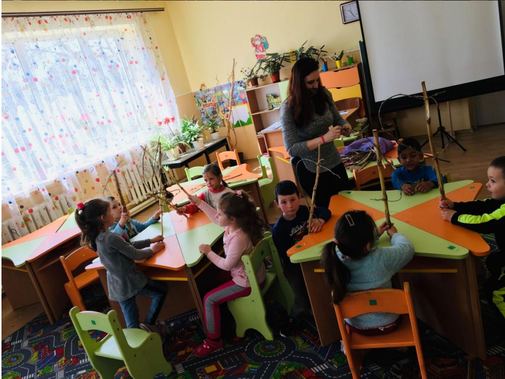
21. sz. fotó: A paripa készítés folyamata