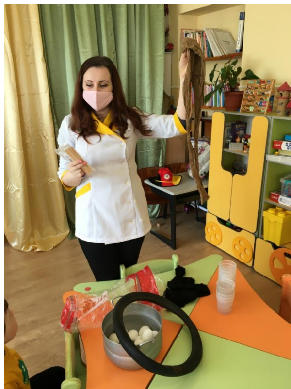
27. sz. fotó: Az alapanyagok bemutatása a tojásfestésnél