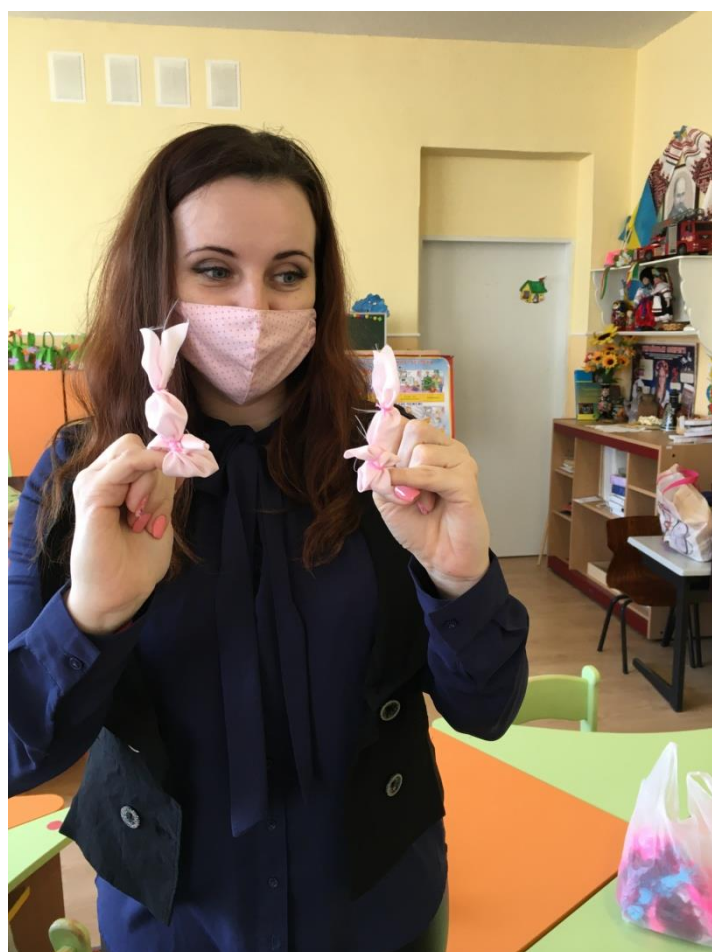
23. sz. fotó: Az anyag nyuszi bemutatása