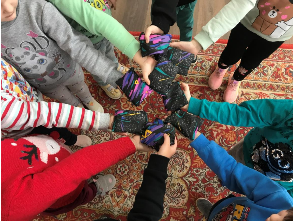
41. sz. fotó: Az elkészült babzsákok a Gálócsi óvodában