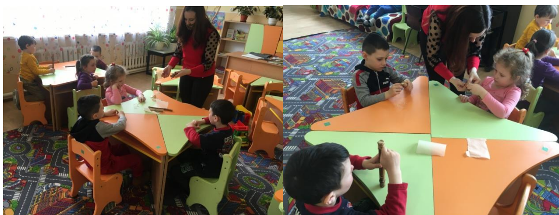
16. sz. fotó: Zajkeltő hangszer készítése