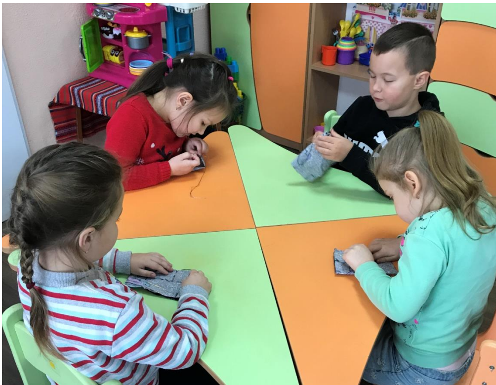
40. sz. fotó: Varrás közben