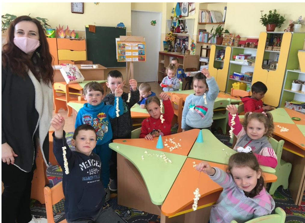
13. sz. fotó: Kukorica és libagége tésztából készült nyakék és karkötő