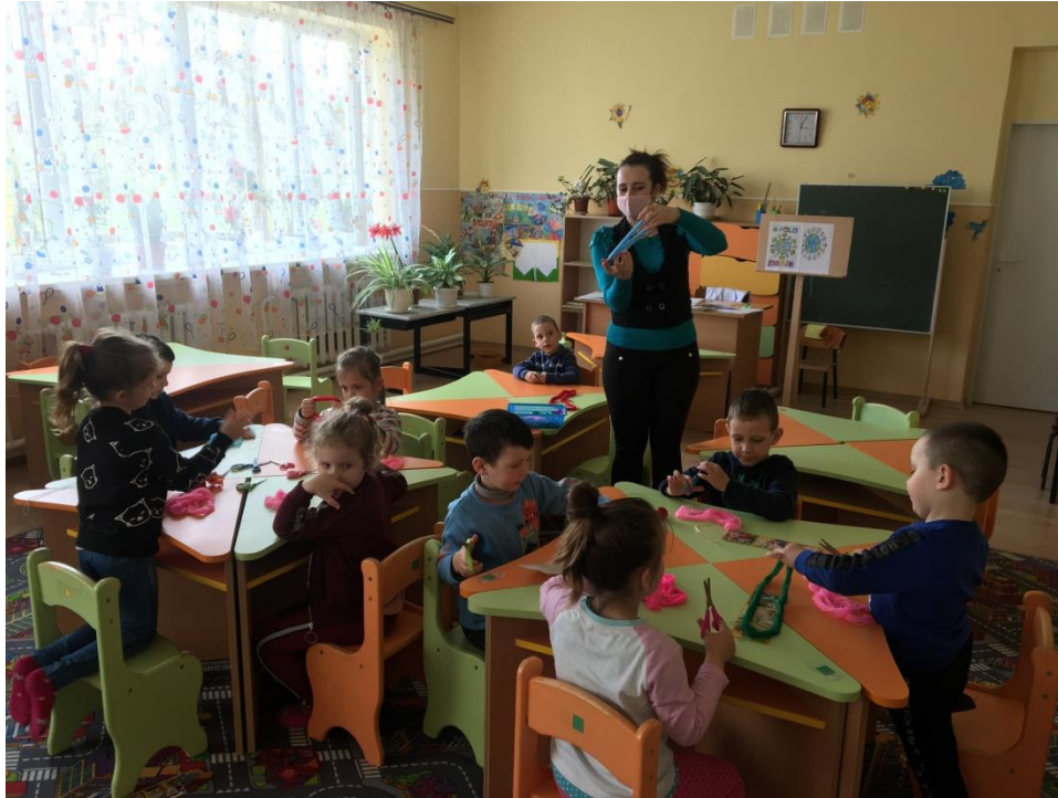
19. sz. fotó: Fonalbaba készítés