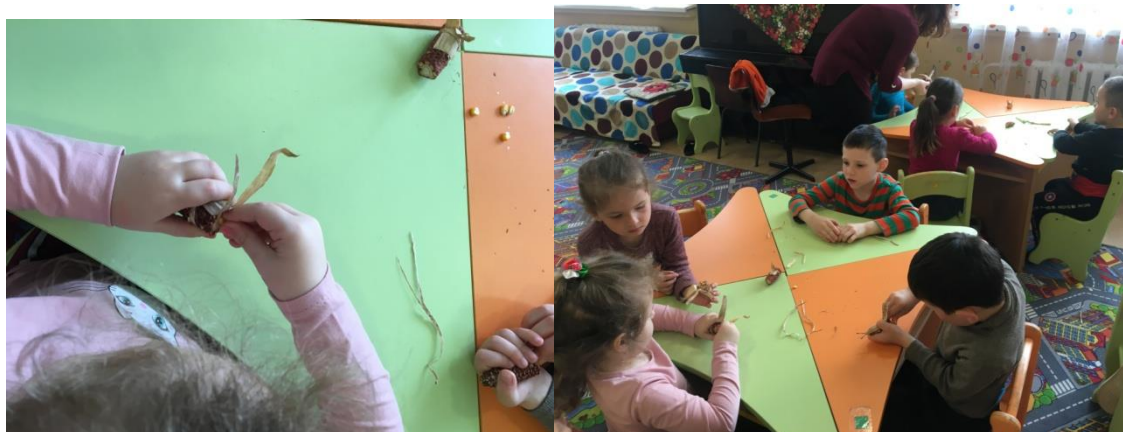
2. sz. fotó: Csutkamalac készítése