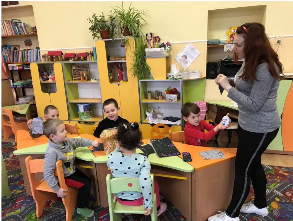
43. sz. fotó: A babzsák bemutatása a Palágykomoróci óvodában