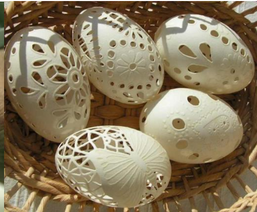
4. sz. fotó: Faragott tojás