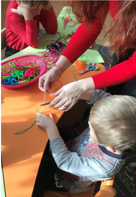
36. sz. fotó: Fonal levágása