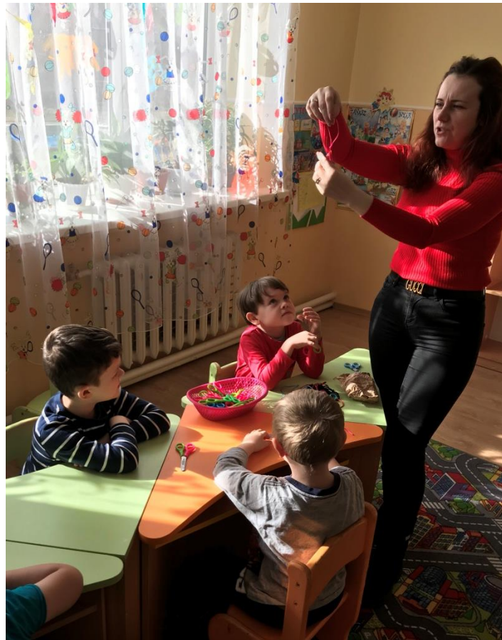
34. sz. fotó: A karkötő bemutatása