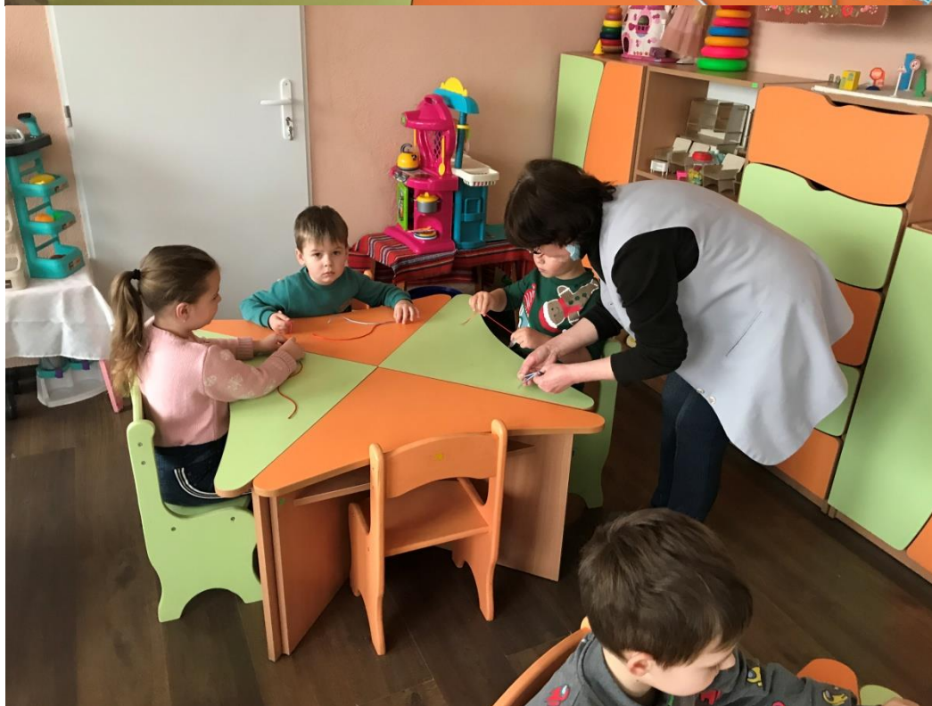
31. sz. fotó: Karkötő sodrása a Gállocsi óvodában