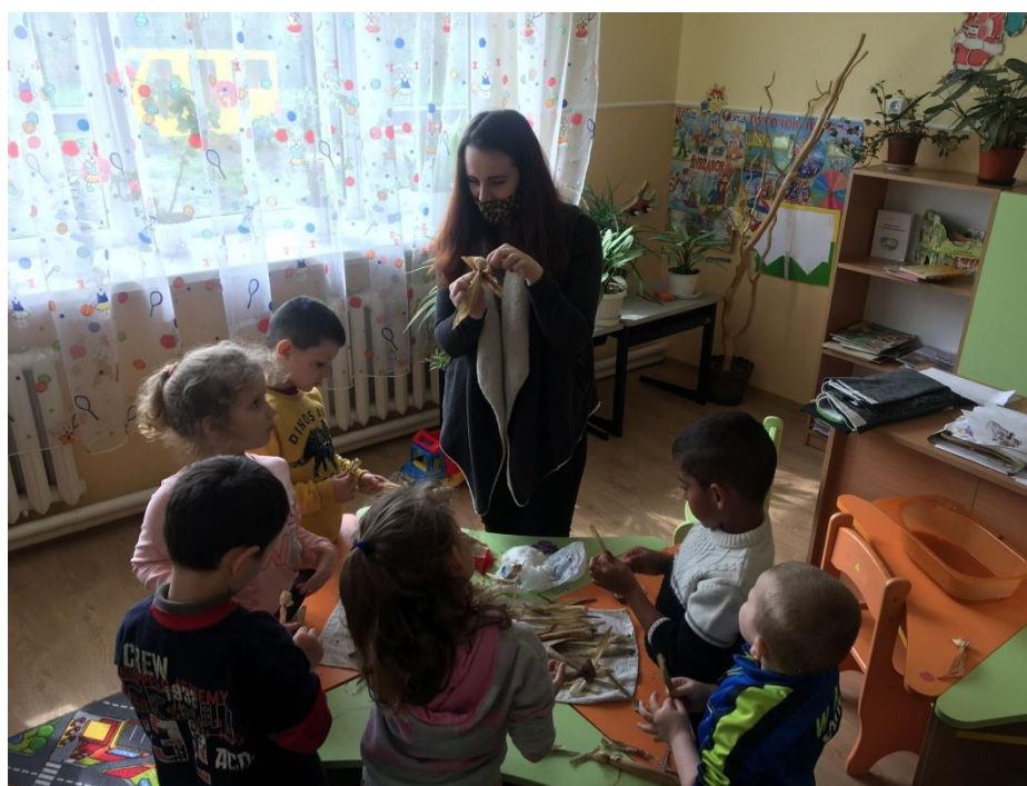
8. sz. fotó: A csuhé angyal készítésének folyamata