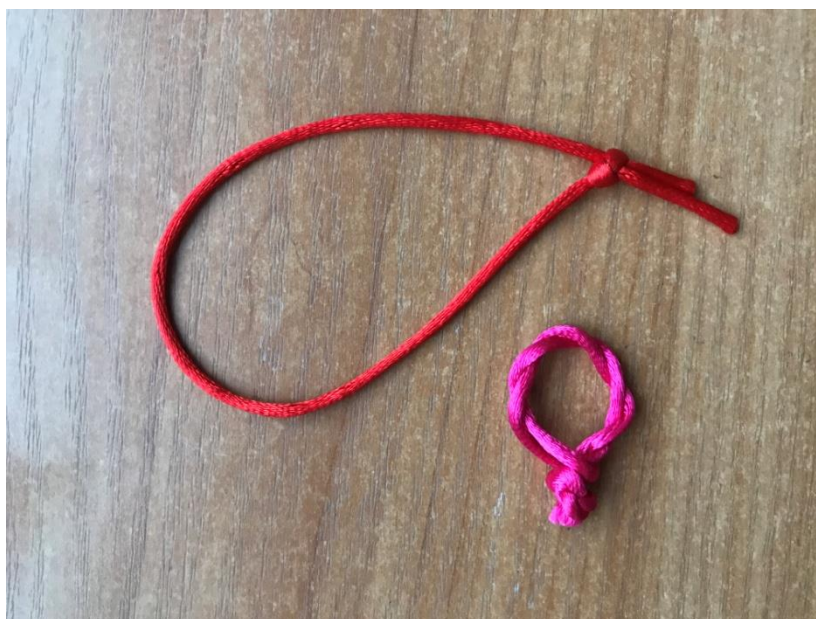
32. sz. fotó: Az elkészült karkötő és gyűrű