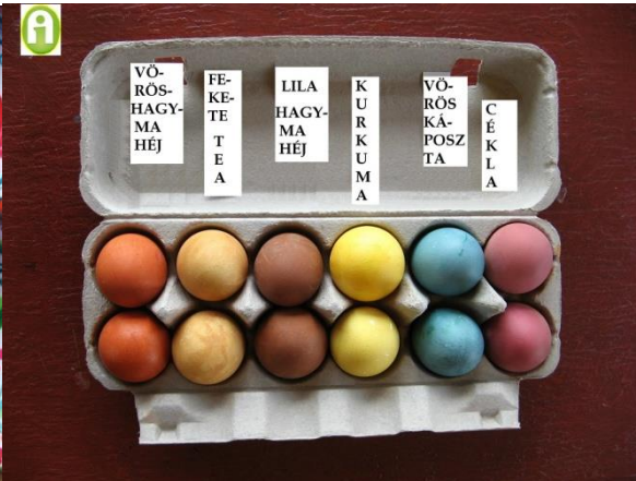
6. sz. fotó: Színes tojások