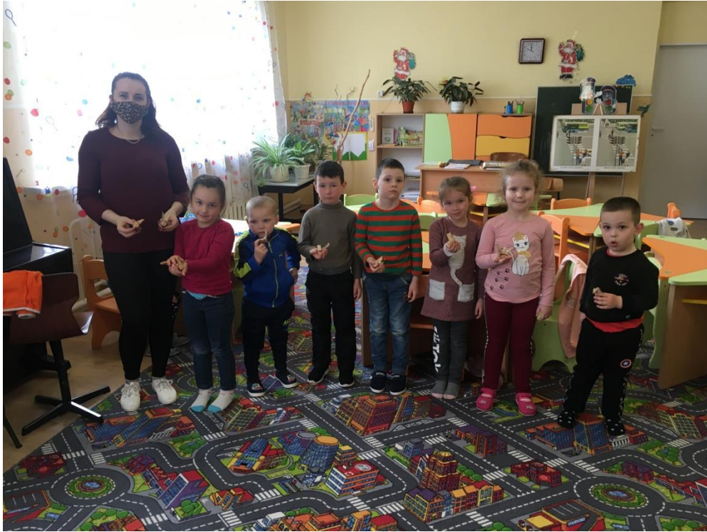
3. sz. fotó: Az elkészült csutkamalacok