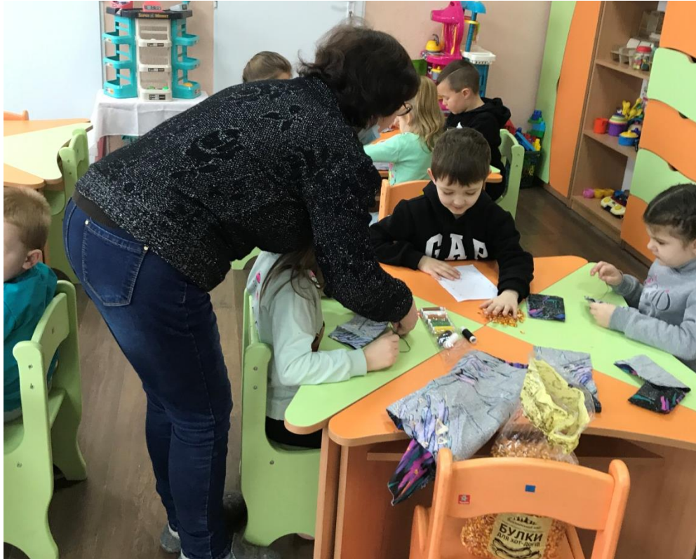
39. sz. fotó: A babzsák varrásának bemutatása