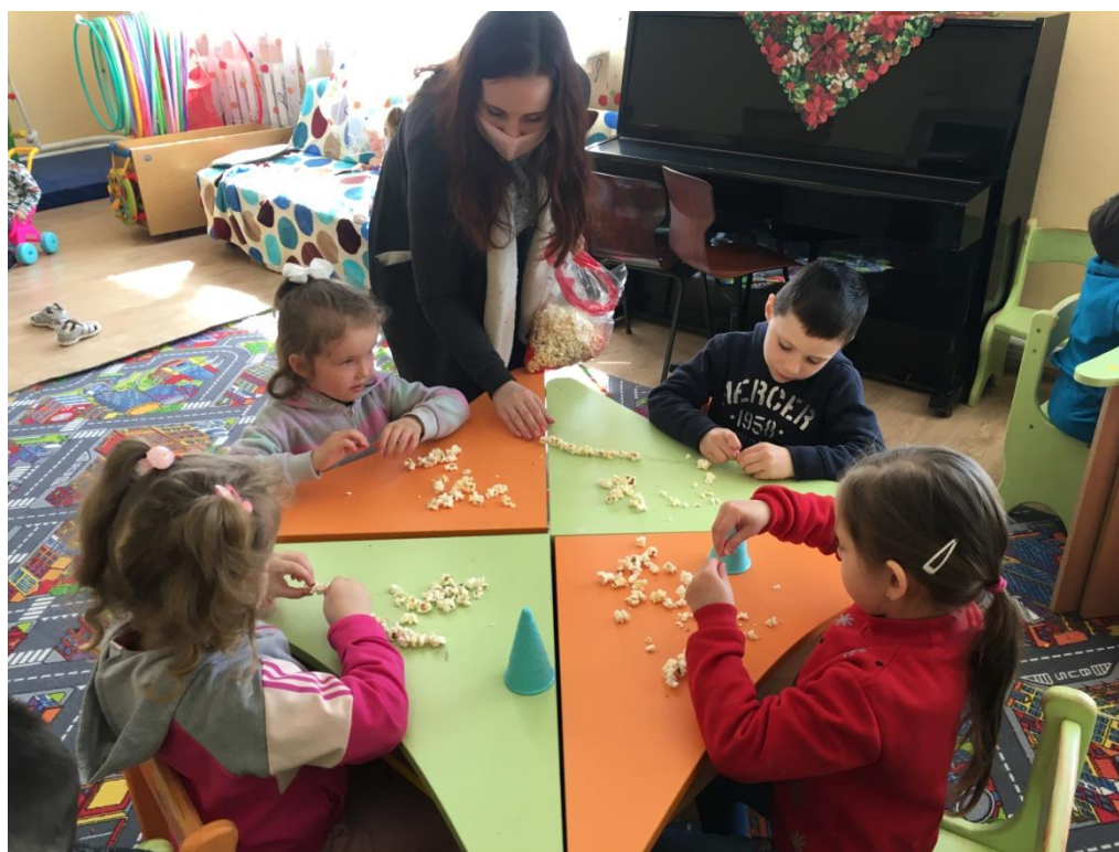
12. sz. fotó: A fűzés folyamata