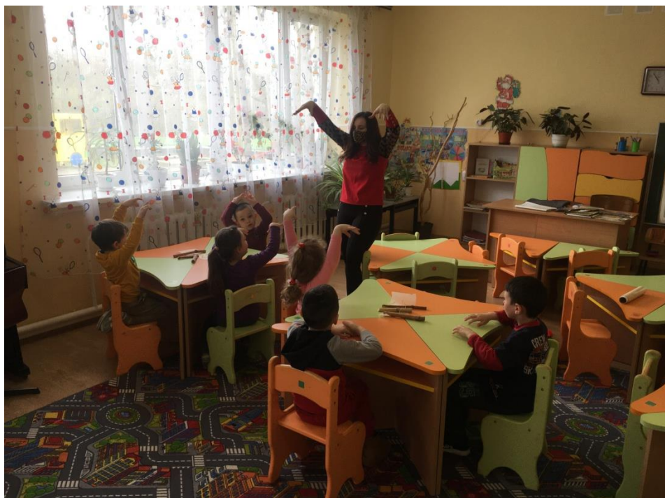
15. sz. fotó: Bemelegítő ujjgyakorlatok