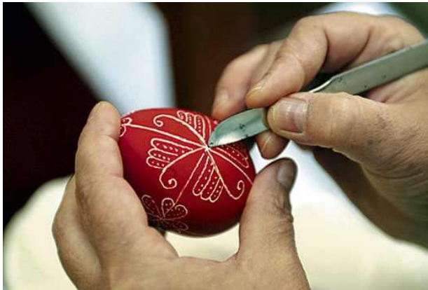
3. sz. fotó: Karcolt tojás