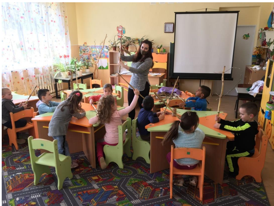
22. sz. fotó: Az elkészült paripák