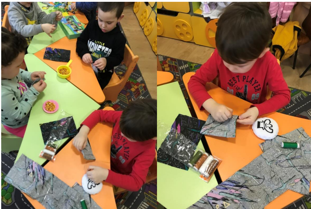
44. sz. fotó: A babzsák varrása