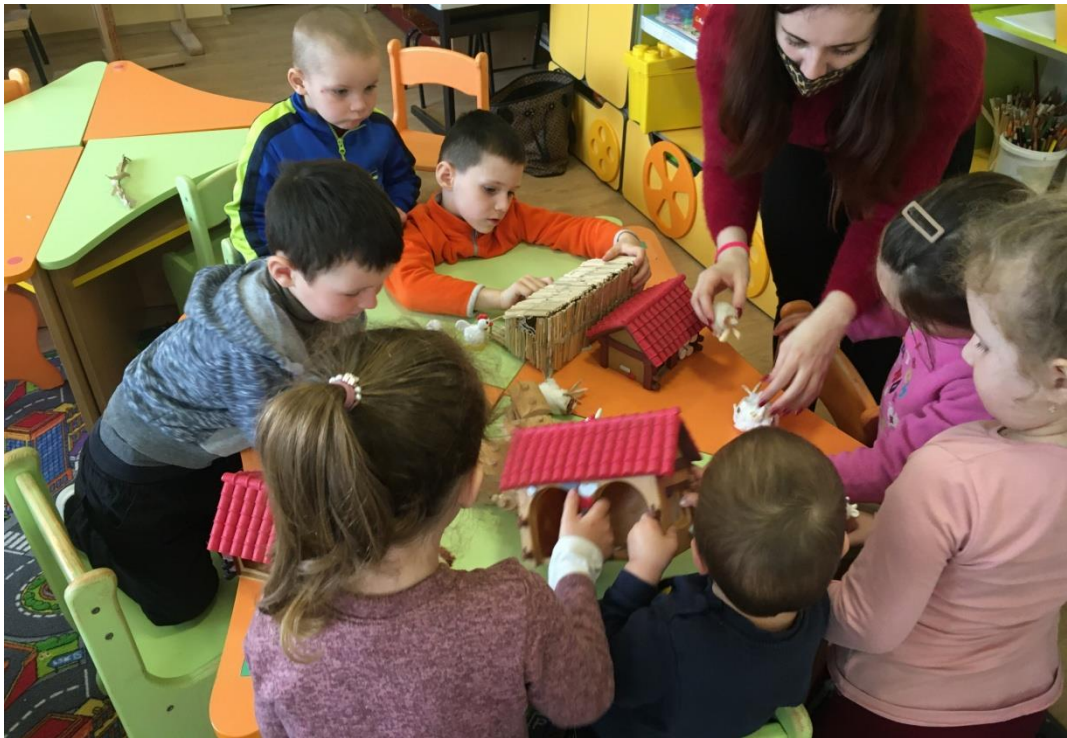
6. sz. fotó: Játék a csutkabáránnyal