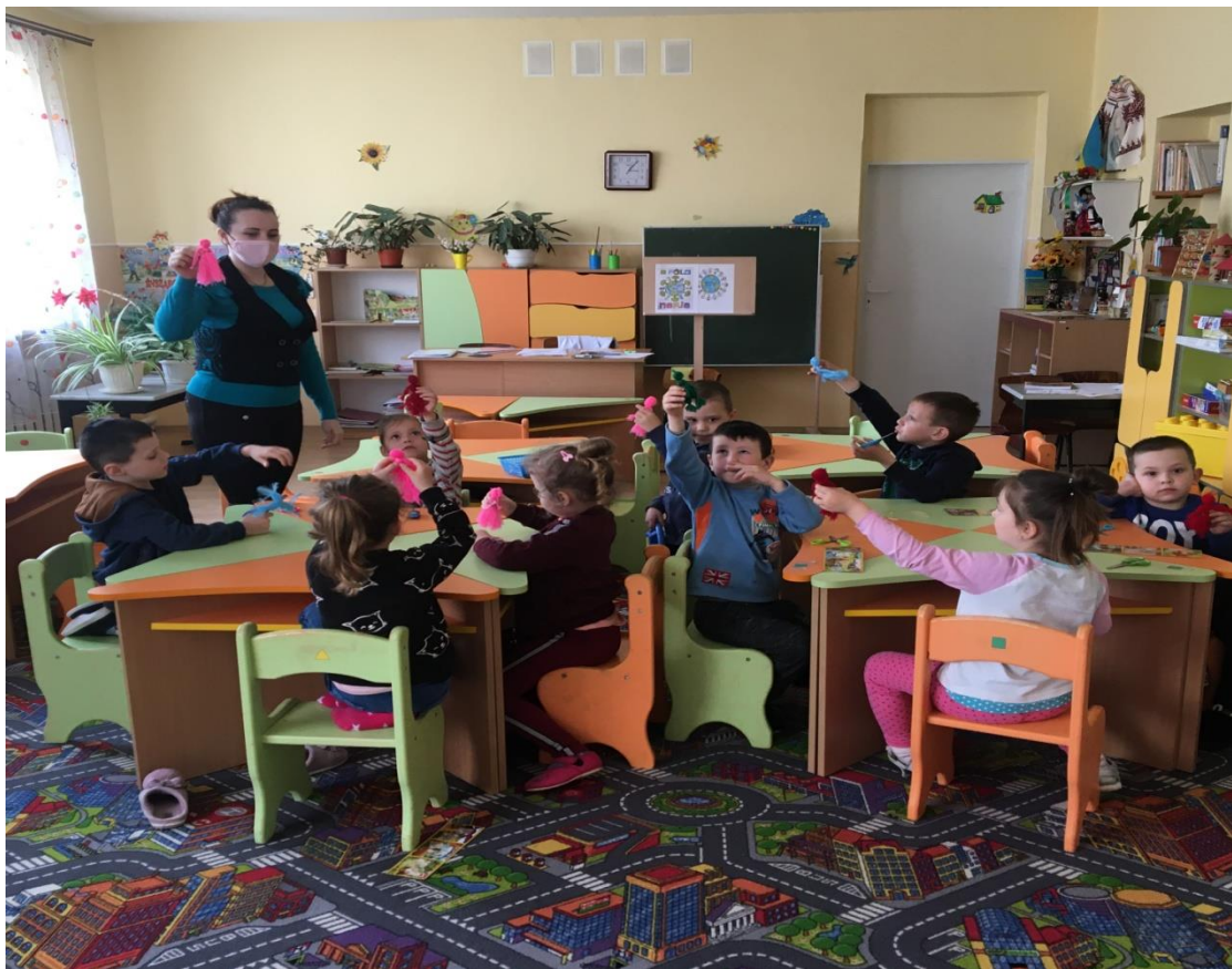
20. sz. fotó: Az elkészült fonalbabák