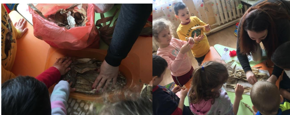
7. sz. fotó: Csuhé előkészítése