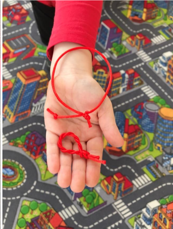
37. sz. fotó: A kész karkötő