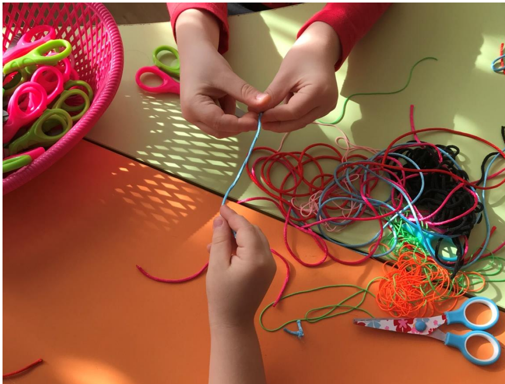
35. sz. fotó: Sodrás közben