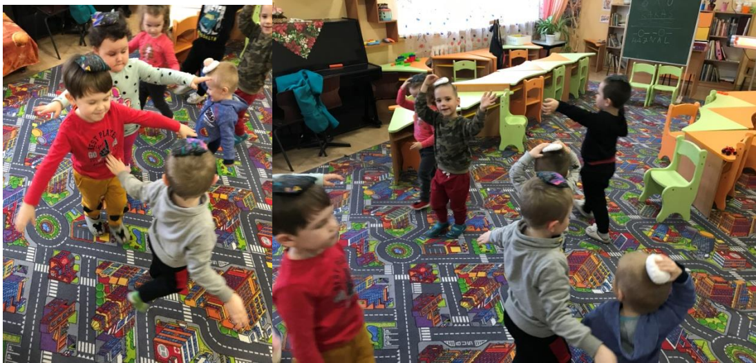
42. sz. fotó: A babzsákok játékbeli alkalmazása a Palágykomoróci óvodában