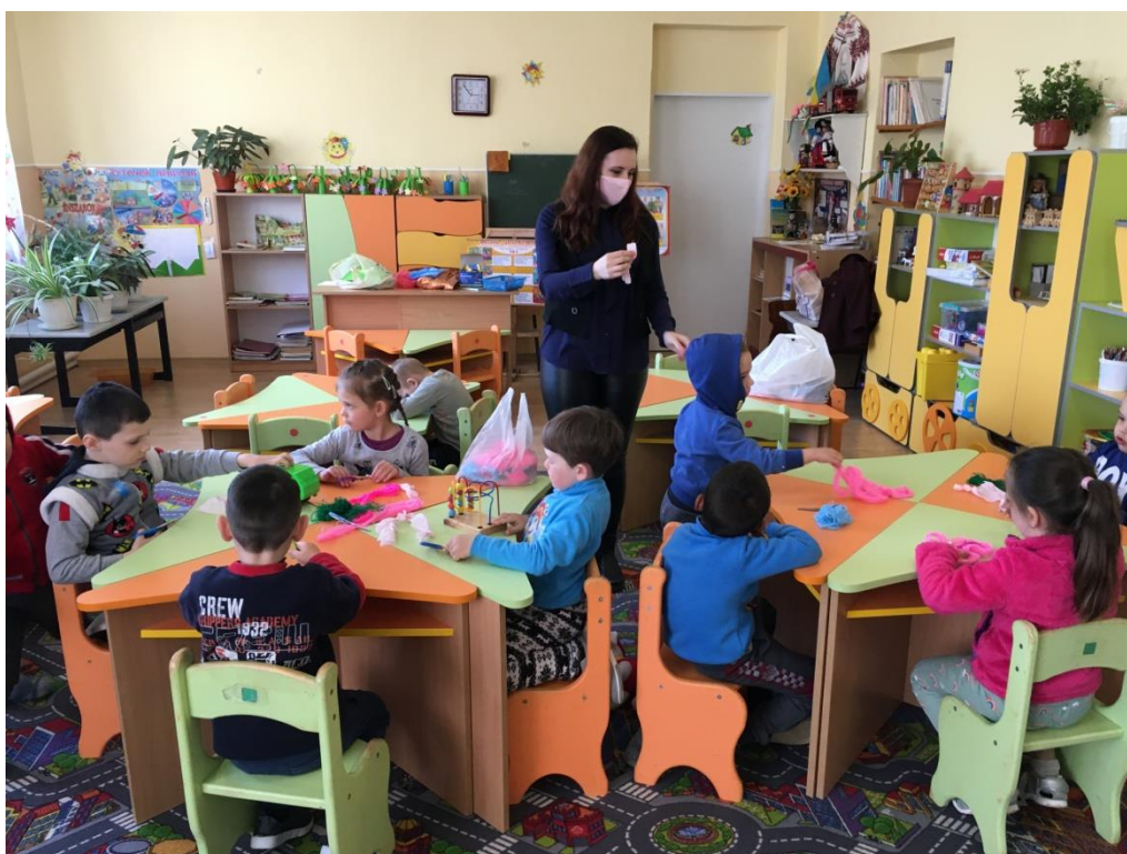
25. sz. fotó: A nyuszihoz elkészítésének folyamata