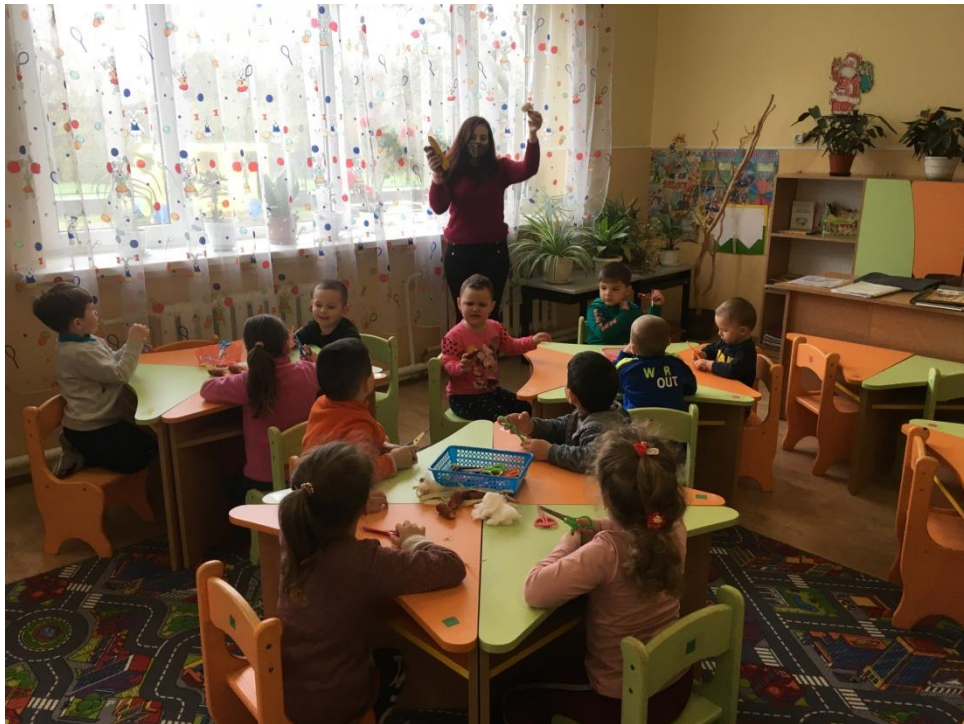
4. sz. fotó: A csutkabárány alapanyagainak bemutatása