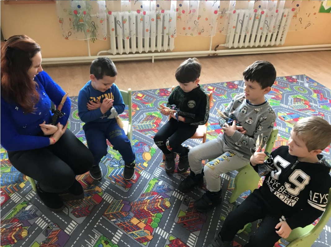
45. sz. fotó: A csutkababával való játék, ringatás