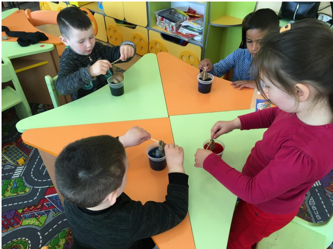
29. sz. fotó: A gumírozott tojások mártogatása