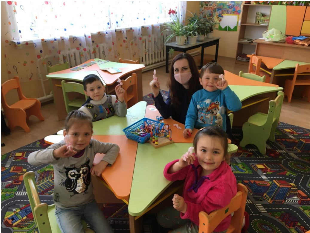
26. sz. fotó: Anyag nyuszi, mint ujjbáb