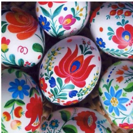
5. sz. fotó: Pingált tojás