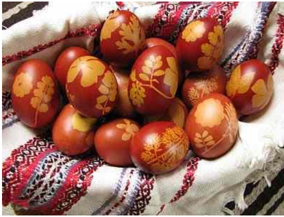
1. sz. fotó: Berzseléses tojás