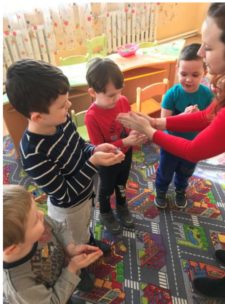
38. sz. fotó: A gyűrű a "Csön-csön gyűrű" körjáték közbeni alkalmazása a Palágykomoróci óvodában