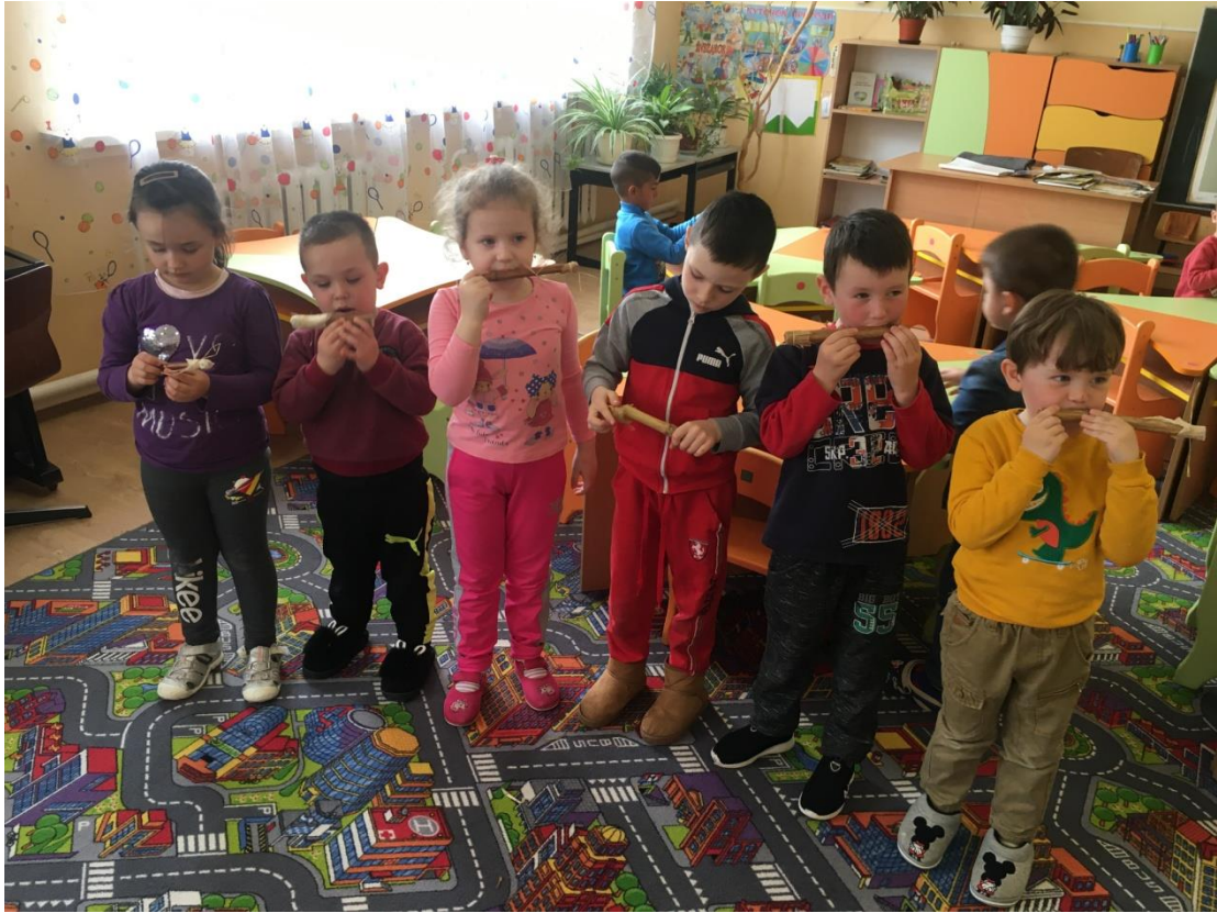
17. sz. fotó: Zajkeltő hangszer együttes(banda)