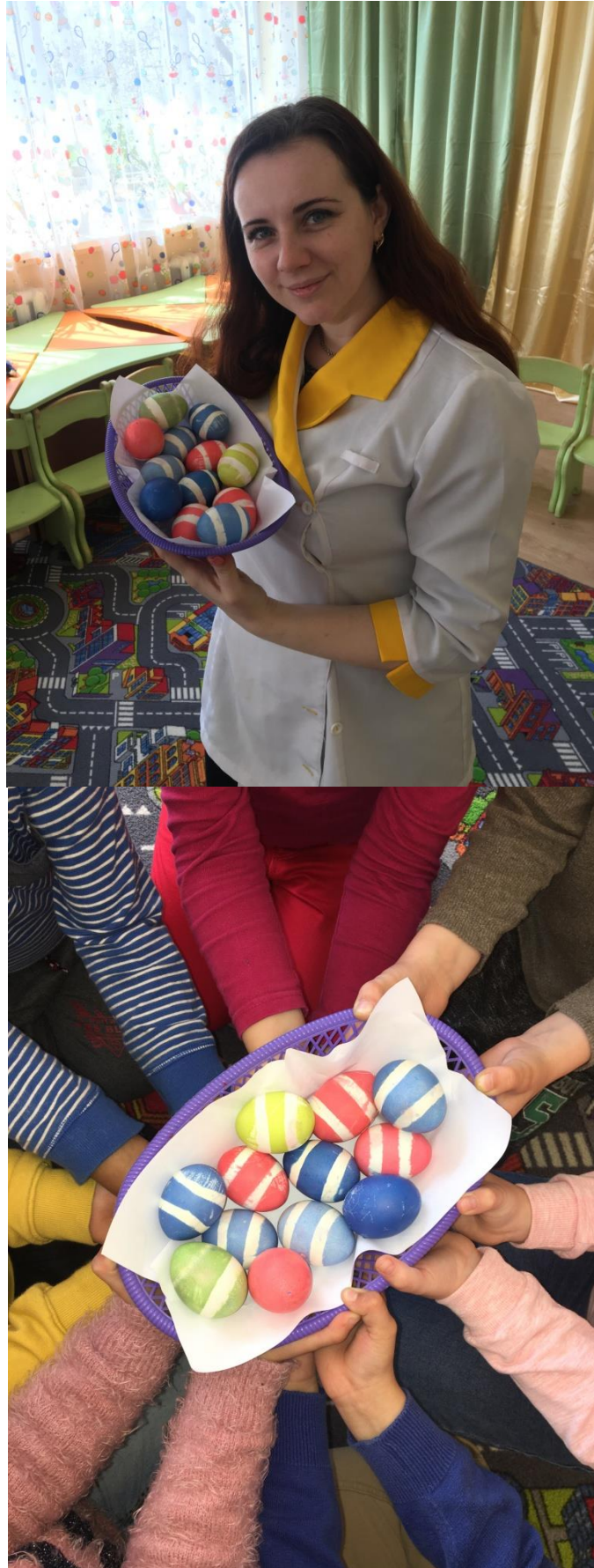
30. sz. fotó: Az elkészült hímesek