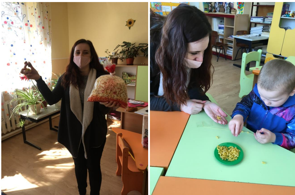
11. sz. fotó: A kukorica és a libagége tészta felfűzésének fázisai