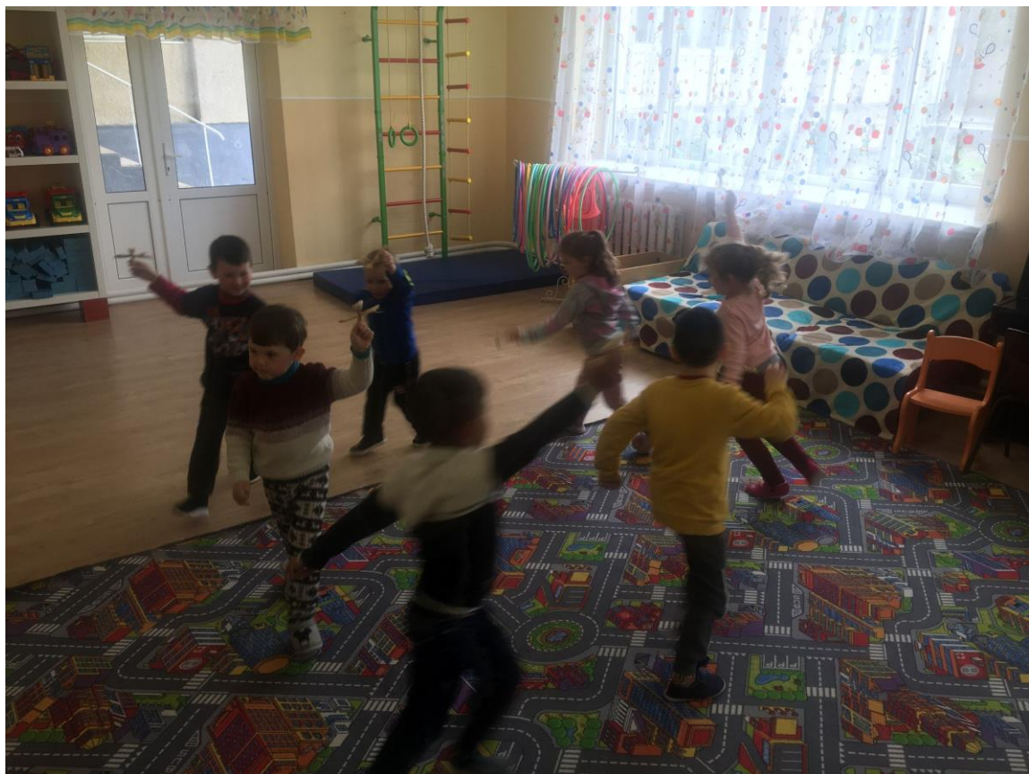
10. sz. fotó: Csuhé angyal reptetés