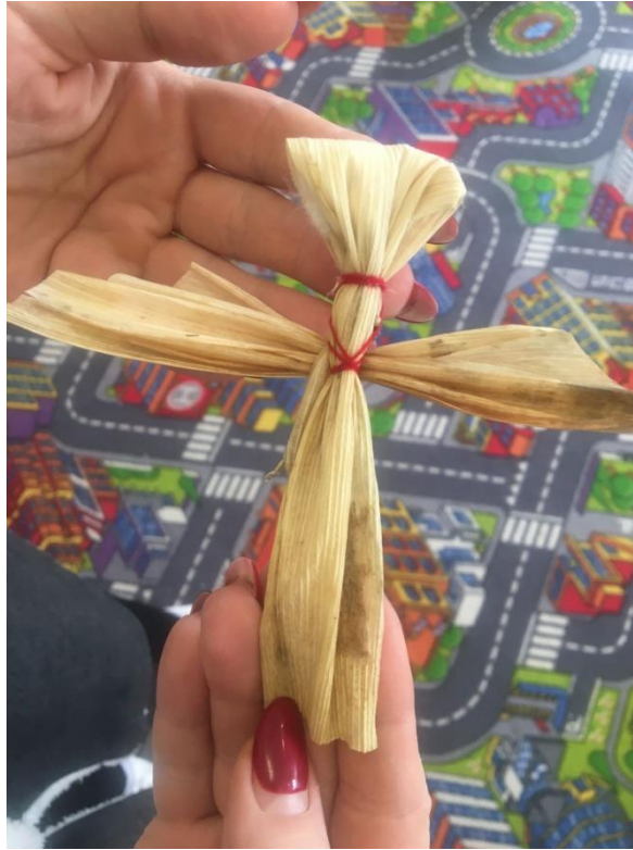
9. sz. fotó: Csuhé angyal