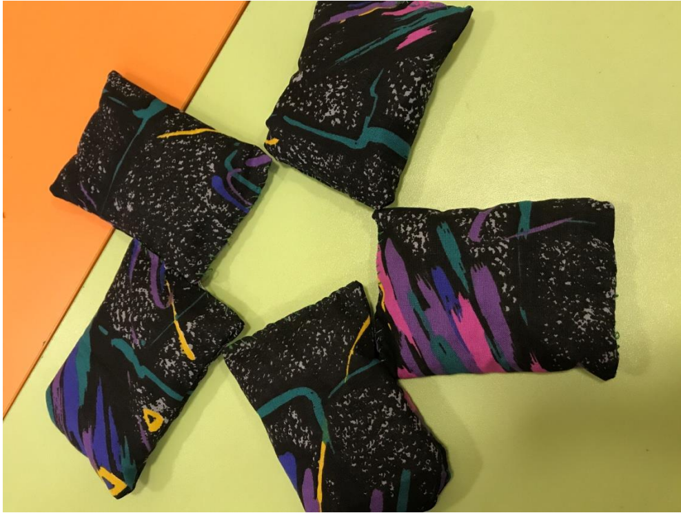
45. sz. fotó: Az elkészült babzsákok