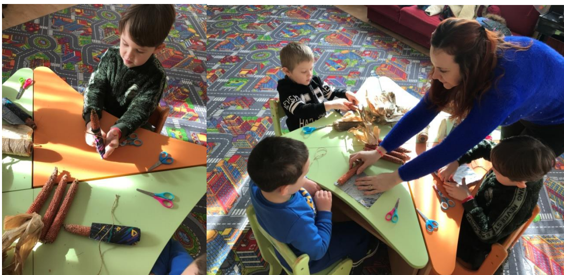
44. sz. fotó: A csutka baba készítése