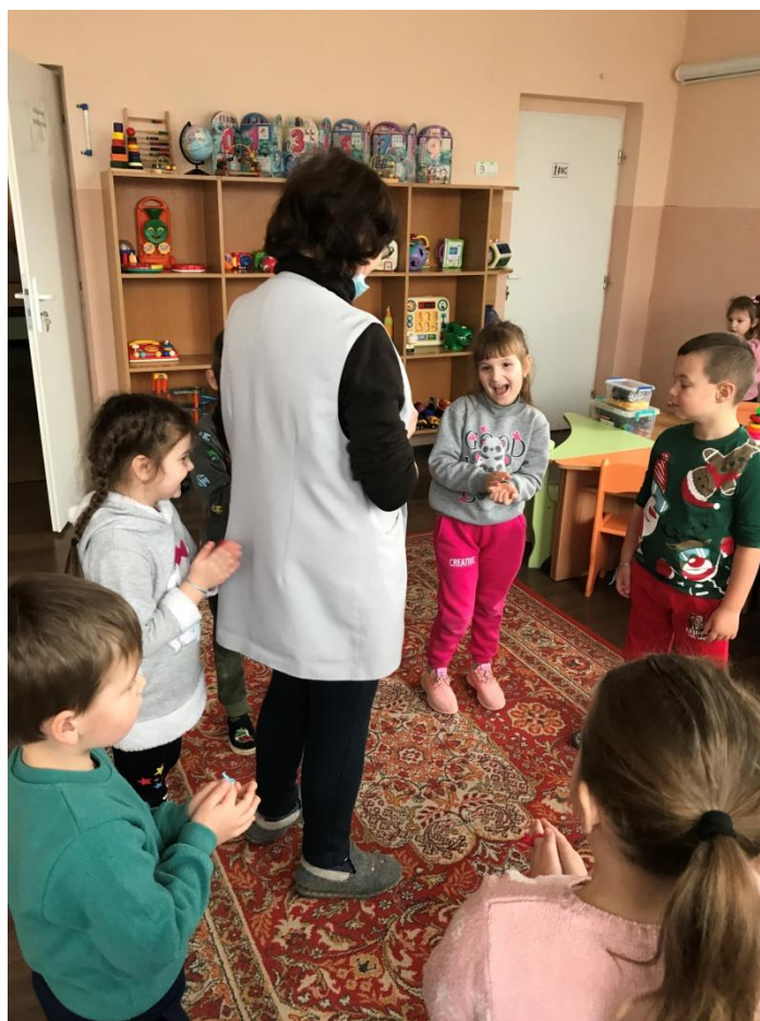
33. sz. fotó: A gyűrű a "Csön-csön gyűrű" körjáték közbeni alkalmazása a Gálócsi óvodában