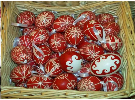
2. sz. fotó: Viaszos tojás