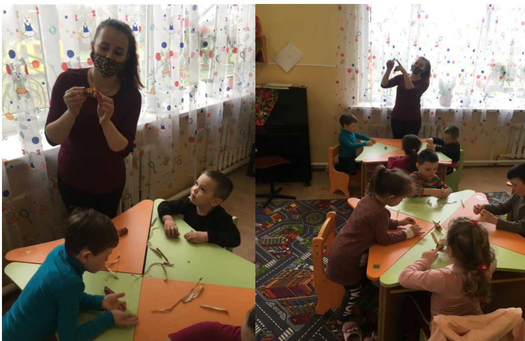
1. sz. fotó: A csutkamalac felépítésének és alapanyagainak magyarázata