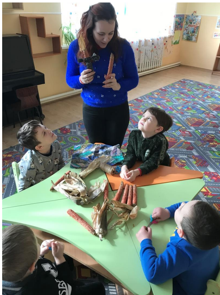
43. sz. fotó: A csutkababa és az alapanyagok bemutatása