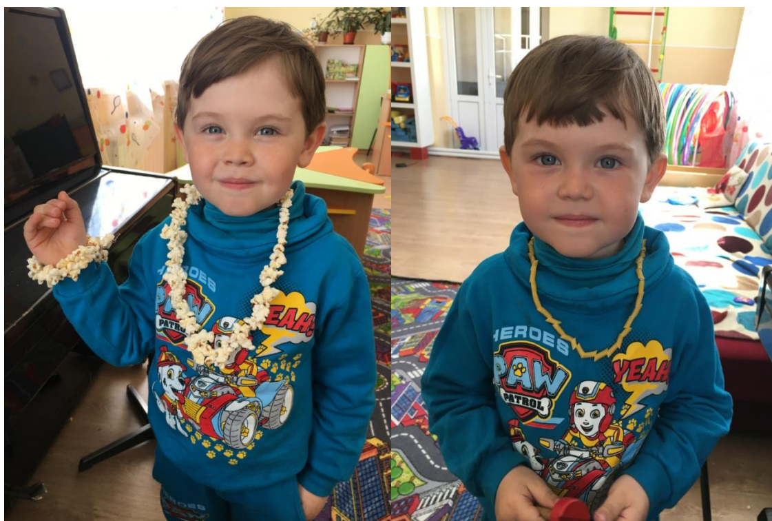
14. sz. fotó: Az elkészült fonatok