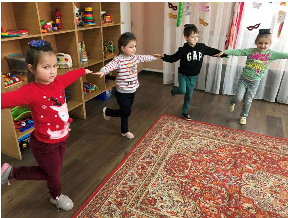
42. sz. fotó: A babzsákok alkalmazása a "Lázár vedd fel lábadat" című játéknál a Gálócsi óvodában