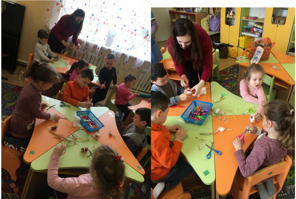
5. sz. fotó: Csutkabárány készítése