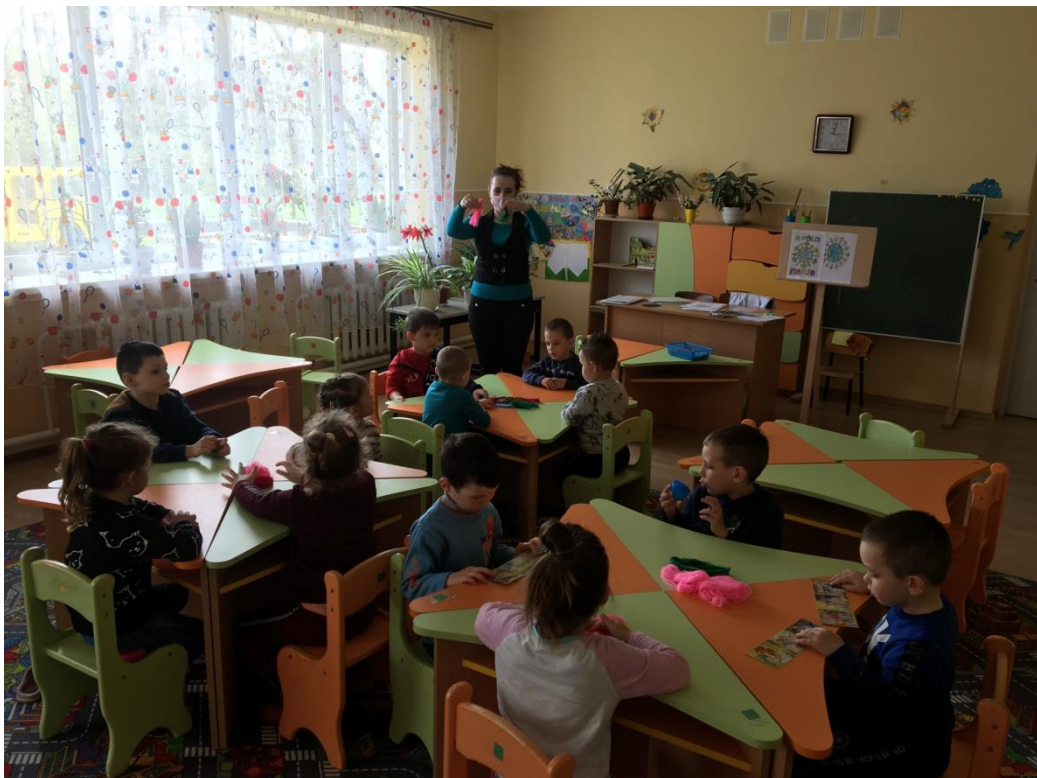
18. sz. fotó: A fonalbaba alapanyagainak ismertetése