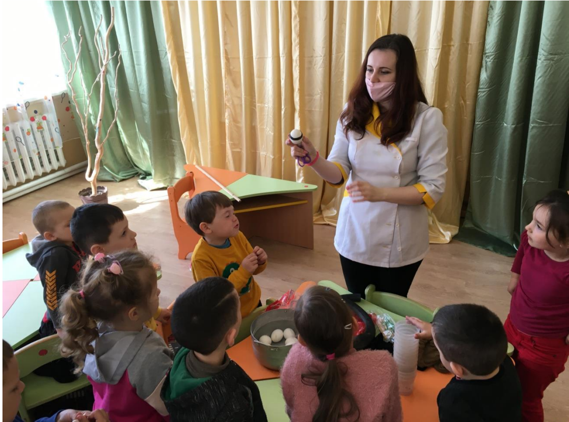
28. sz. fotó: A tojás gumírozása