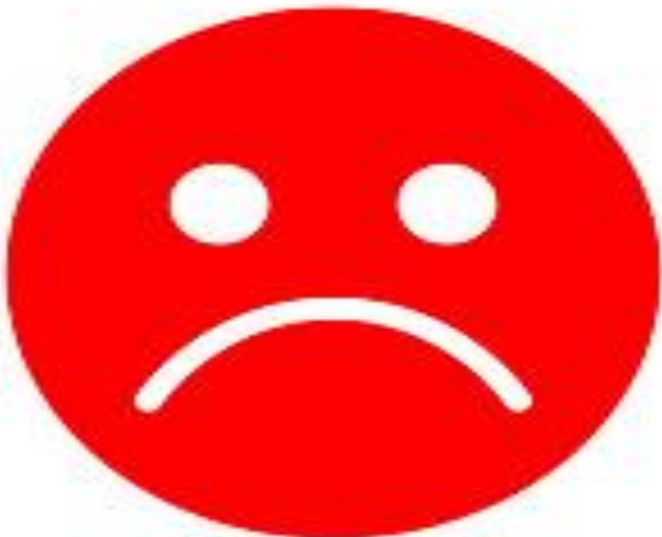
1 sz. melléklet