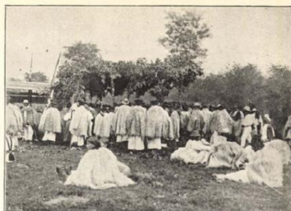
Háthegységi ruthének az ebéd kiosztásánál.