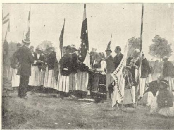
Kászonyi magyarok a tiszaháti járásból.