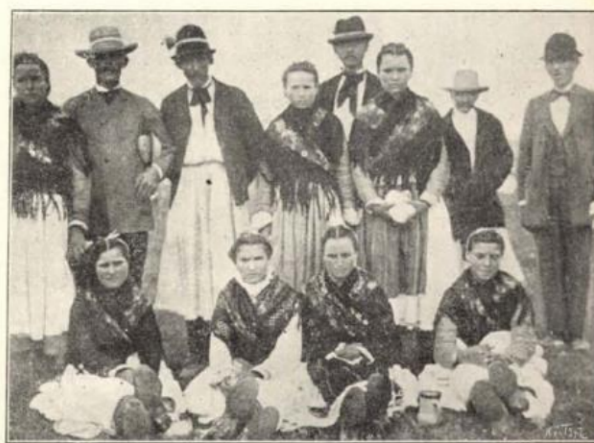
Felső-veczkei ruthének a szolyvai járásból.

A MUNKÁCSI EZREDÉVI ÜNNEPÉLYRŐL.