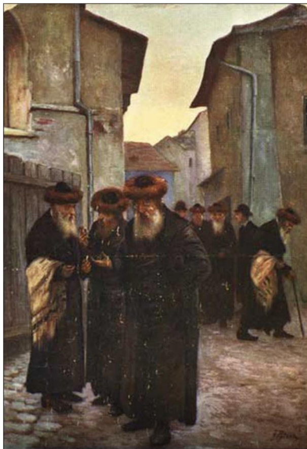
1. ábra. Haszid zsidók 133