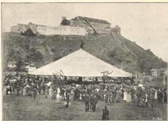
A sátor, a hol Erdélyi miniszter ünnepi beszédét tartotta. (A vár jobb sarkán az emlékhő építkezése látszik.)