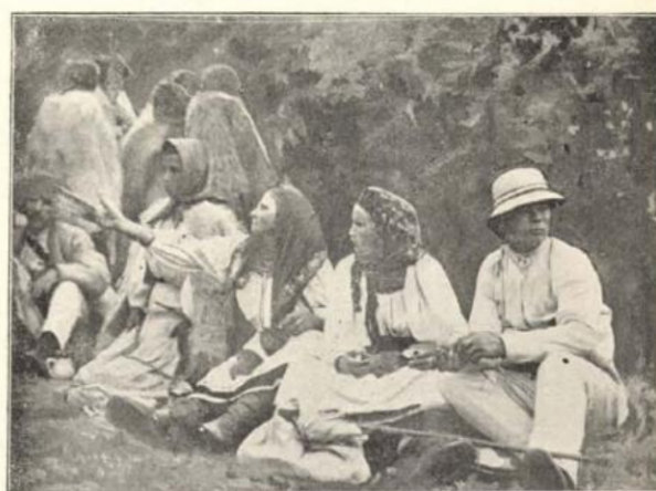
Tökési ruthének a közös ebédnél.