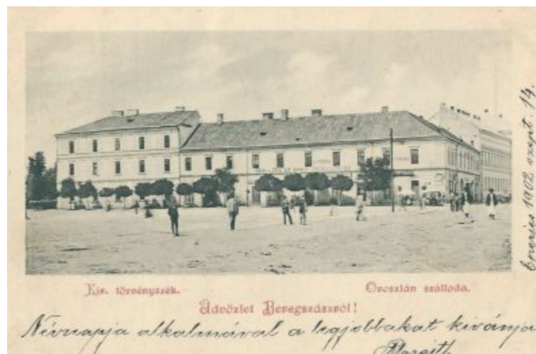
2. fénykép: Oroszlán szálló az 1900-as évek elején 47