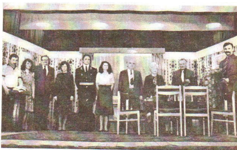
A Férjhez készül a mama szereplői a tarpai művelődési ház színpadán.

1988 áprilisában a Beregi Ünnepi Hét házigazdája Vásárosnamény volt. A Népszínház az eseményre a Tarpán és Lónyán is bemutatott Vlagyimir Kanyivec “Férjhez megy a mama” című művével készült. Az előadást különlegesebbé tette, hogy a darabot ekkor végignézte a darab szerzője Vlagyimir Kanyivec is. 60