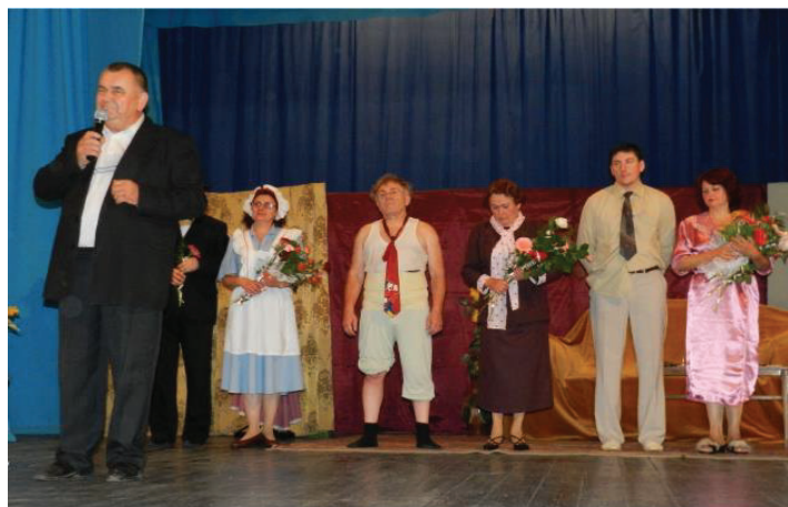
10. fénykép. A “Rózsa a lovag” című előadás szereplői 100

A Népszínház csoportja évente látogatta a mozgáskorlátozott klub tagjait, akiknek elő is adtak, valamint Mikulás és Karácsony alkalmával mézeskaláccsal is kedveskedtek nekik.