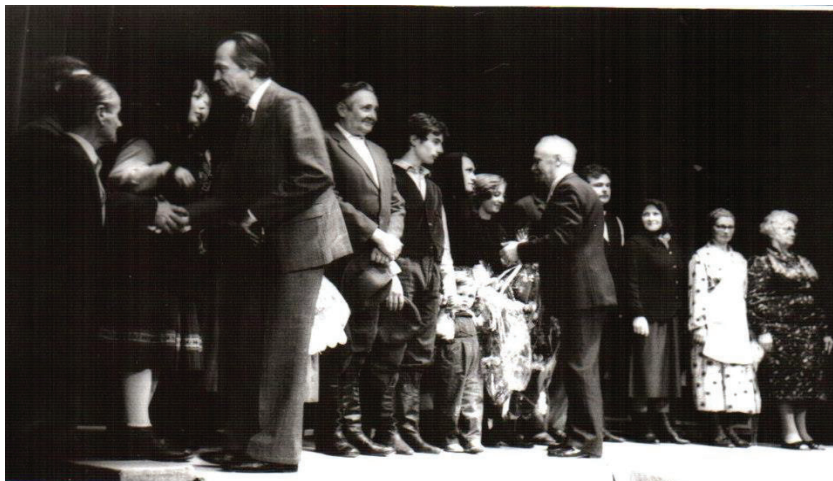
5. fénykép. A “Sátán fattya” című előadás után Budapesten 86

1992 nevezetes kulturális eseménye volt az Amatőr Népszínház által bemutatott Nagy Zoltán Mihály “Sátán fattya” című dráma, amit Schober Ottó dolgozott át és rendezett. 81 Alig egy évvel a regény megjelenését követően történt a bemutató, ezzel ünnepeelve meg a Népszínház megalakulásának 40. évfordulóját. 82 A bemutató híre még Budapestre is eljutott és a Népszínház fennállásának csúcspontjaként tartják számon. December 9-én került sor a darab bemutatására a Magyar Honvédség Művelődési Központjában, teltház előtt. Az Amatőr Népszínház fennállásának addigi legnagyobb sikerét érte meg azon az estén. 83 Az előadás számos magyarországi színházba és fesztivárra is eljutott. A zsűri különdíjjal jutalmazta az előadást a Kisvárdai Határon Túli Magyar Színházak Fesztiválján, de bemutatásra került még a Zsámbéki színházban, Nyíregyházán és számos más településen is. 84 Sinkovics Imre Kossuth-díjas kiváló művész levelében kifejezte sajnáltát, mivel egyik saját előadása miatt nem vehetett részt a bemutaton, de sok sikert kívánt a Népszínháznak az előadáson. 85