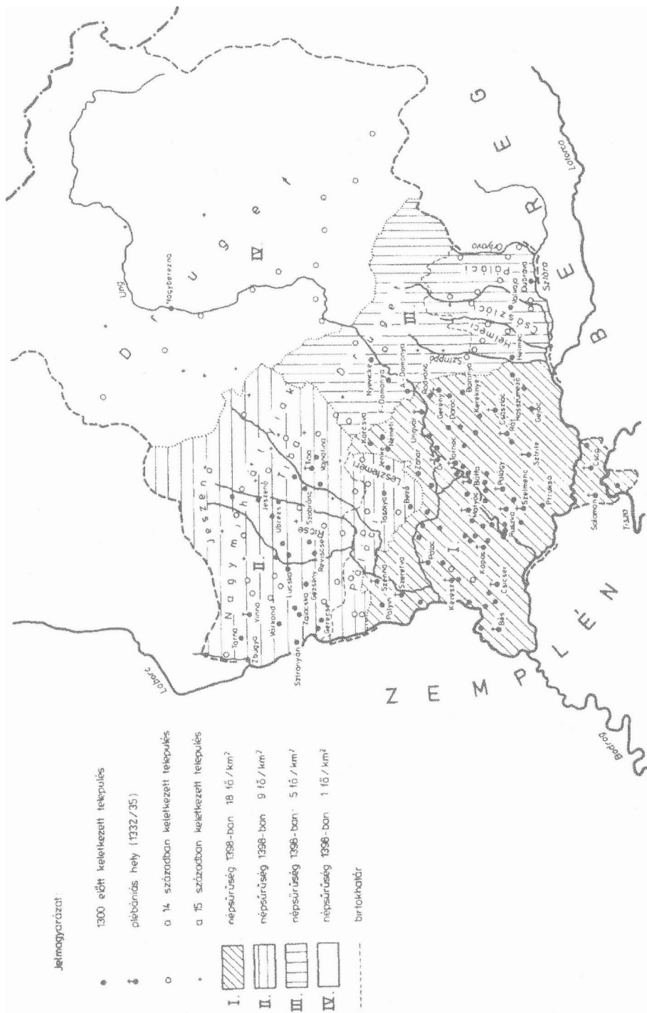
2. ábra. Ung megye települési és népességi viszonyai a XIII–XV. században (Engel, 1985/4).