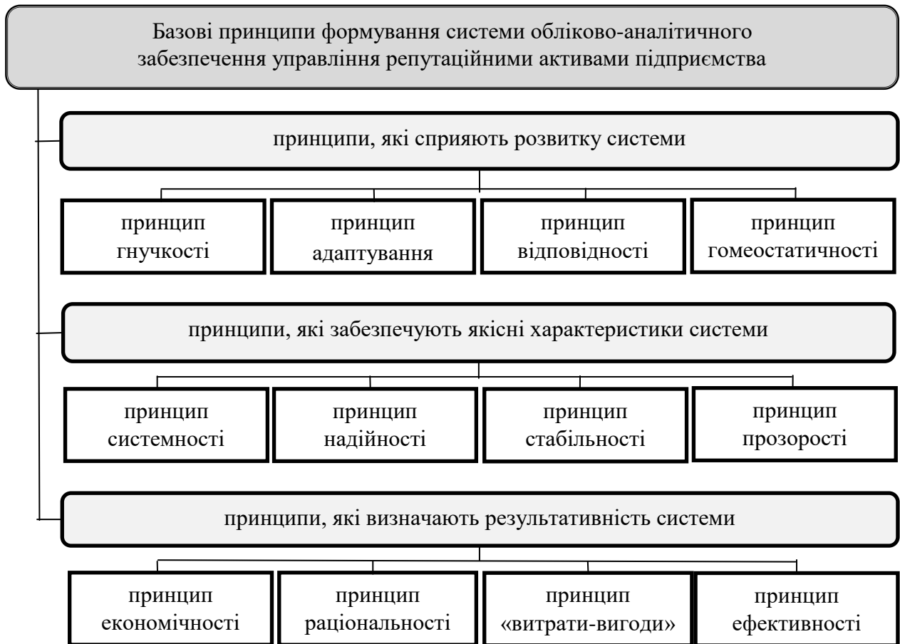
Рисунок 1 - Базові принципи формування системи обліково-аналітичного забезпечення управління репуаційними активами підприємства

Наступна група принципів, яких пропонується дотримуватися, дозволяє забезпечити якість функціонування системи обліково-аналітичного забезпечення репуаційного менеджменту. Цього можливо досягнути за умови врахування принципів системності, надійності, стабільності і прозорості. Особливого значення тут набуває принцип надійності, який покликаний відповідати як за надійність функціонування самої системи, так і за надійність даних, які будуть генеруватися та, на основі яких, будуть проводитися аналітичні розрахунки.