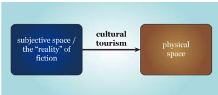
Figure 1. The relationship between fictional space and reality

I would also like to prove that the places and people found in fiction can have a physical manifestation as tourist destinations. It is my personal belief that these manifestations appear on Earth as a result of a specific segment of cultural tourism, which takes readers and audience towards these made-up spaces (Figure 1).