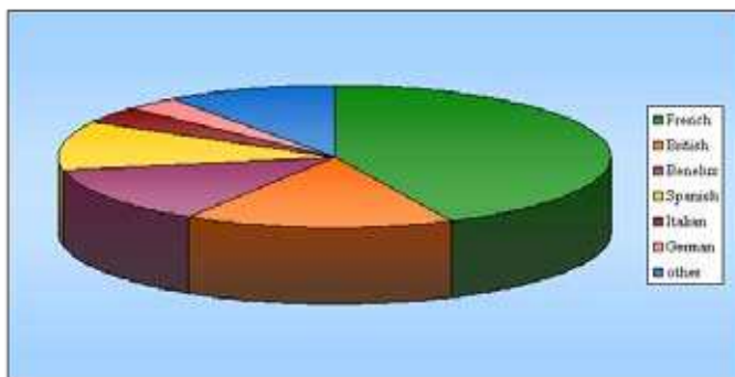
Figure 3: National distribution of the 14.5 million people who've visited Eurodisney in 2007

Despite the fact that you can describe attractions like these, themed after a cartoon, a film or a work of literature in geographical terms, at the end of the day we're still talking about products that have been artificially created. Eurodisney - which is mostly built around decades-old, highly commercialized stories and characters - still manages to bring in as many as 14.5 million visitors each year, making it one of the most popular tourist hotspots in Europe.