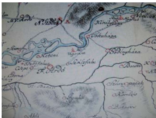
3. ábra. Ugocsavár korabeli fekvése Lipszky János térképén (részlet)