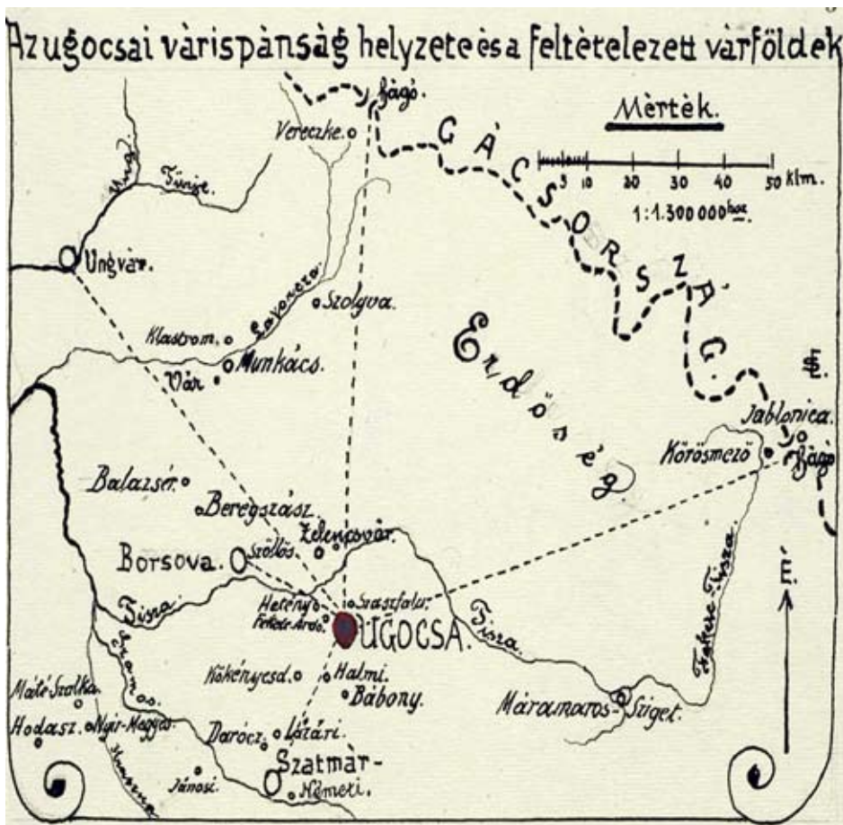
1. ábra. Soós Elemér térképrészlete Ugocsáról