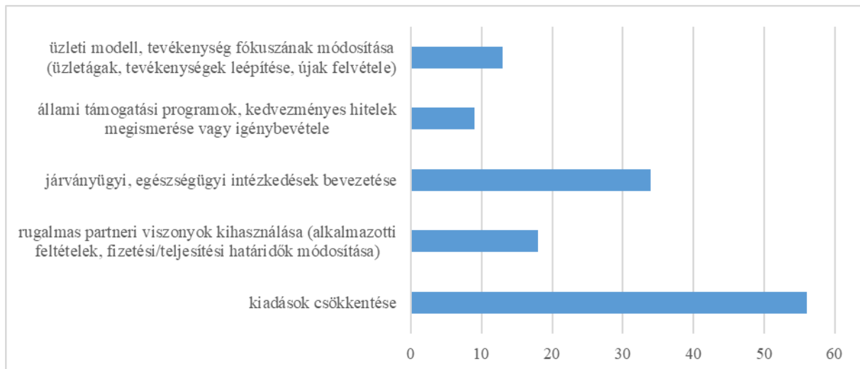
3. ábra: Válságkezelési stratégiák a koronavírus járvány idején

Végül, de nem utolsó sorban, harmadik kérdésünk arra vonatkozott, hogy milyen válságkezelési stratégiát alkalmaztak a megyei vállalkozások. (ld. 3. ábra)