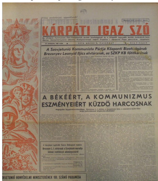
5. kép A Kárpáti Igaz Szó nyitóoldala

A második világháborút követően csaknem húsz évet kellett várni, hogy a helyi magyarság a szovjetesítés és málenyikij robot utáni sokkból felocsúdva bármilyen politikai, kulturális életjelet adjon magáról. Ennek egyik oka nyilván demográfiai volt. Ennyi időre volt szükség, hogy felnőjön egy olyan nemzedék, amely már nem élte meg az 1944-es terrort. Az oktatási rendszer sokáig csonka volt, ez is nehezítette a helyi magyarság talpra állását: ugyan (ahogyan azt az előző fejezetekben már olvashattuk) az anyanyelven oktató általános iskolák egy évvel a világháború után újraindultak, de a magyar nyelvű középiskolai képzés elindítására 1953-ig kellett várni.