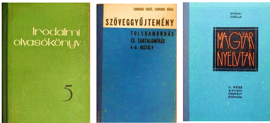
12. kép Az 1972-es, az 1974-es, az 1975-ös kiadás

Forrás: https://www.antikvarium.hu/konyv/csengeri-dezso-csengeri-rozsa-szoveggyujtemeny-845693 , https://www.antikvarium.hu/konyv/dravai-gizella-magyar-nyelvtan-ii-297282-0 , letöltés 2021. júl. 23.